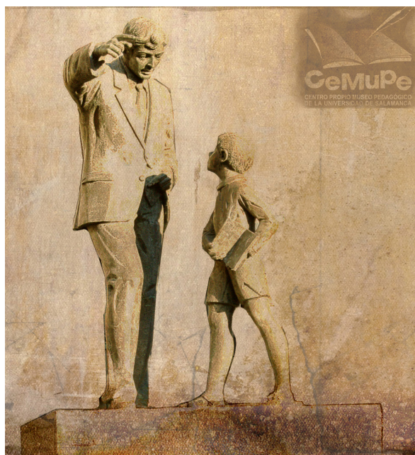
Fig. 1. Monumento al Maestro. Hipólito Pérez Calvo. 1972 / Bronce / Monumento Público / Zamora / 4 x 3 x 3 m.

«En todos sus grados, el de maestro es un oficio complejo y delicado. Porque, desde luego, se trata de un oficio. La profesión es un ejercicio. El oficio es una pasión. Y no hay un oficio más digno de ser amado que aquel cuyo núcleo central es la entrega al ser humano. Ser maestro es una actitud ante la vida. Ser maestro es creer en el hombre como persona y estar dispuesto a ayudar a los más jóvenes en la difícil tarea de hacerse adultos. Por lo tanto, la principal cualidad que necesita el maestro es la generosidad» 14 .