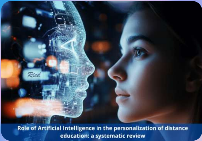
Role of Artificial Intelligence in the personalization of distance education: a systematic review

La inteligencia artificial (IA) representa una oportunidad significativa para la personalización y adaptación de sistemas educativos en modalidad virtual.