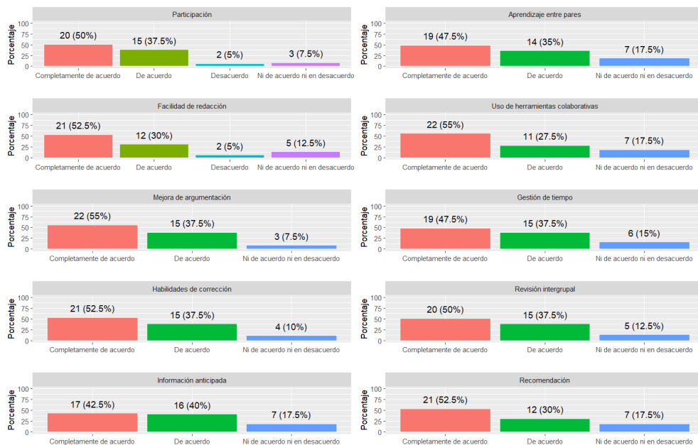
Figura 4 Valoración de los estudiantes al DTP-AIEC