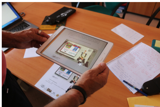
Figura 2. Presentación de los apuntes