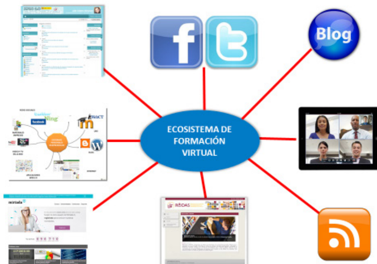
Figura 2. Ecosistema de formación virtual

Lo comentado hasta el momento, puede dar a entretener que no somos partidarios de la incorporación de los MOOC a la práctica educativa, muy al contrario somos partidarios de su incorporación, pero de una incorporación reflexiva y crítica, que los asuma como una tecnología más que los docentes tenemos a nuestra disposición para crear una verdadera escenografía virtual para la formación en la sociedad del conocimiento, y con la que las personas pueden acceder a la información. Dicho en otros términos de una tecnología más que la persona incorpore a su “entorno personal de aprendizaje”, y que al docente le permita crear un verdadero ecosistema para la formación virtual (figura 2).