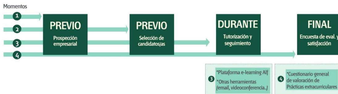
IMAGEN 1. Diagrama del proceso de gestión de las prácticas virtuales.

viven en zonas alejadas (núcleos rurales, alejados de empresas de su sector...) y que debido a la falta de financiación no pueden permitirse un desplazamiento, o a aquellas personas con necesidades específicas de conciliación (familiar, académica...). Partiendo de un contexto laboral en el que la experiencia laboral y la formación práctica como forma de valorización y acceso al empleo son centrales, el objetivo de este proyecto se resume en la finalidad de contribuir al “aumento de la empleabilidad o capacidad de emprendimiento de los estudiantes que complementan su formación académica con esta formación práctica online” (Manzano y Villalón, 2015).