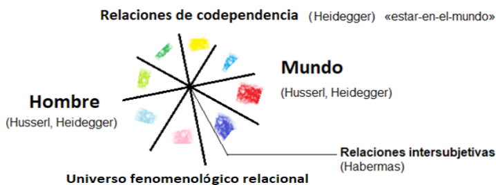
Figura 3. Relaciones de codependencia entre el hombre y el mundo.

Esta correlación a la cual alude Heidegger, significa que el hombre que genera teorías sobre su percepción de la realidad, forma a su vez relaciones de codependencia entre él y el mundo -realidad o realidades- que interpreta y reflexiona a través de la teoría; desde esta perspectiva el argumento se podría referir al mundo de la teoría y al tránsito que existe entre este y el mundo de la vida, que después reflexionaría a profundidad Habermas, refiriéndose a los tres niveles del mundo de la vida. Queda claro que la premisa tiene un fundamento filosófico en relación a estos teóricos. Pero es más interesante, el todo articulado mencionado por la concepción Heideggeriana del «estar-en-el-mundo», que connota un mundo de relaciones generales y específicas articuladas para formar la dimensión relacional entre el hombre y el mundo. La figura 1 muestra gráficamente dichas correlaciones.