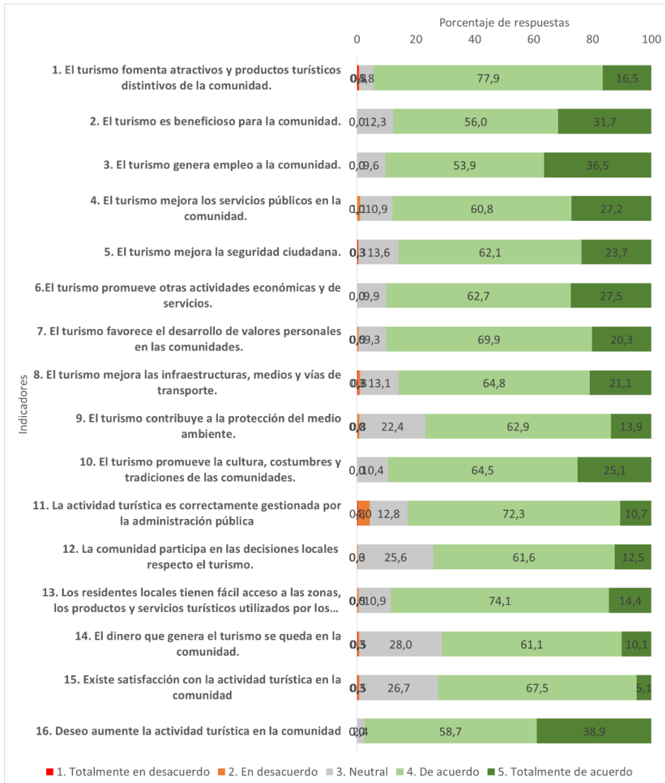
Gráfico 1. Porcentajes de las respuestas según escalas e indicadores