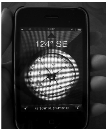
Figura 1. Aplicación de posicionamiento del usuario por coordenadas y puntos cardinales en dispositivo Iphone.

viamente, lo que permite añadir más información sin conexión real sobre lugares próximos, orientación para la circulación de vehículos, publicidad de establecimientos públicos, etc. red (Morrison, et al. , 2011). Este sistema se completa con indicaciones sobre la distancia a un determinado objetivo.