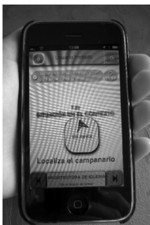
Figura 3. Aplicación de posicionamiento que va suministrando información con relación a un objetivo marcado.

Esta categoría agrupa los dos desarrollos anteriores, generando una interacción entre la posición geográfica del dispositivo y determinados objetos captados (Figura 3). Su funcionamiento debe cumplir dos requisitos: estar en un espacio geolocalizado con cobertura GPS o similar, y que sea reconocible la figura patrón ubicada para que se dispare la información RA de forma automática (Kerr; et al. , 2011). Esta utilidad tiene amplia difusión con la combinación de cartografías que posicionan al usuario, superponiendo en tiempo real otra información digital geo-referenciada sobre la imagen recogida por la cámara, «overhead & live view». En esta línea Langlotz, et al. (2012) trabajan para situar e interactuar con las imágenes captadas de la realidad, y lograr luego reconocer y diferenciar distintas marcas y lugares.