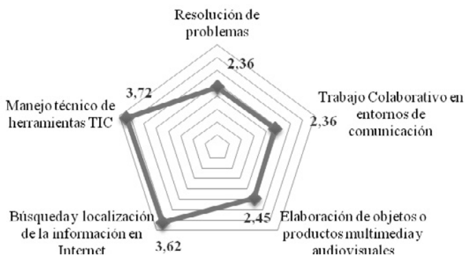
Figura 2. Perfil competencial del alumnado ante las TIC

◆ Media del profesorado sobre la percepción de la habilidad digital de su alumnado