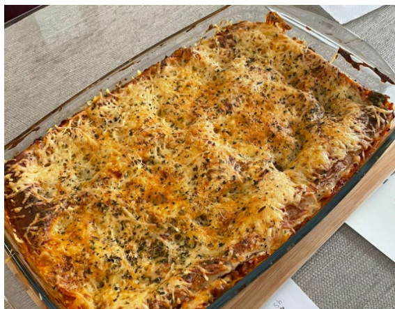
Figura 5. Imagen aportada por la persona entrevistada E.6.