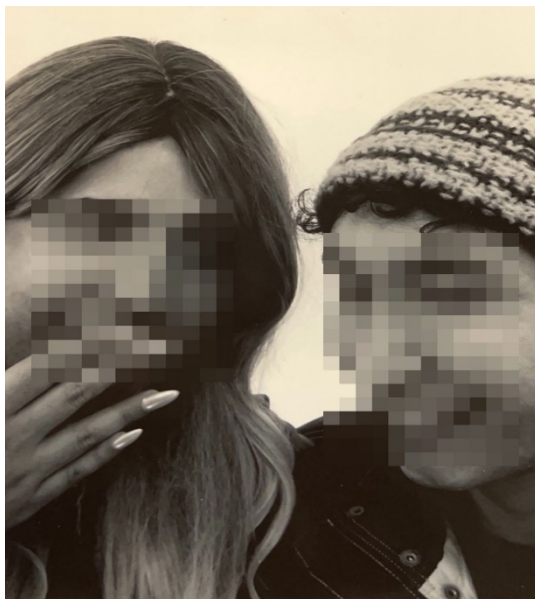
Figura 1. Imagen aportada por la persona entrevistada E.1.

Fuente: Elaboración por la persona participante.