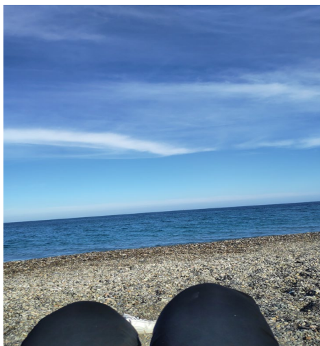
Imagen 3. Imagen aportada por la persona entrevistada E.3.

Fuente: Elaboración por la persona participante.