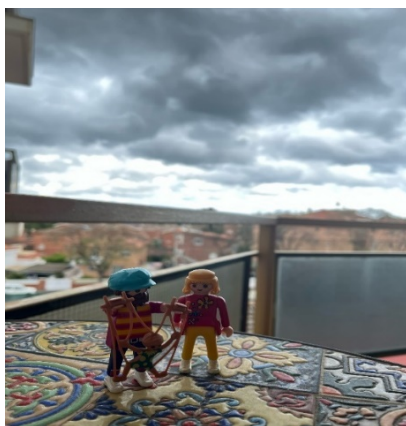
Figura 2. Imagen aportada por la persona entrevistada E.2.