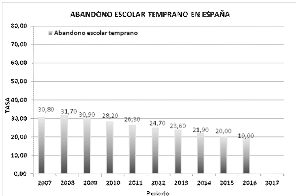
FIGURA 2. Evolución tasa de abandono escolar temprano 2007-2016

Fuente. Elaboración propia a partir de los datos de Eurostat.