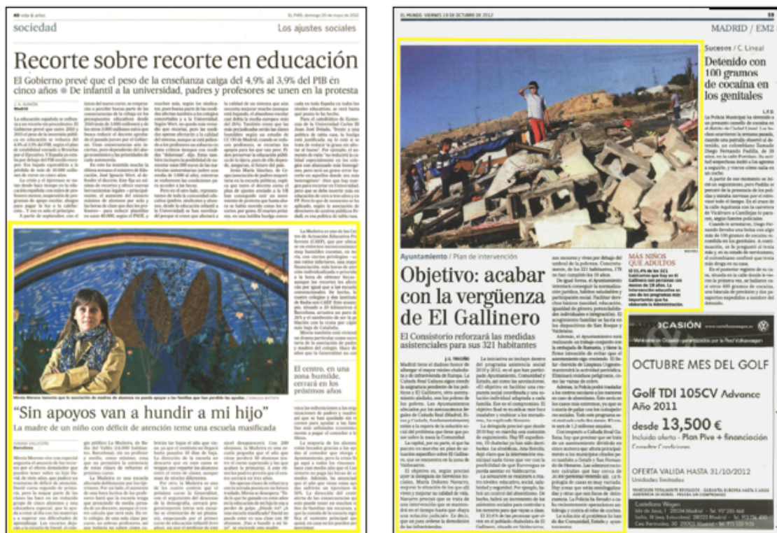
Imagen 2: Informaciones que sitúan la pobreza infantil en España.