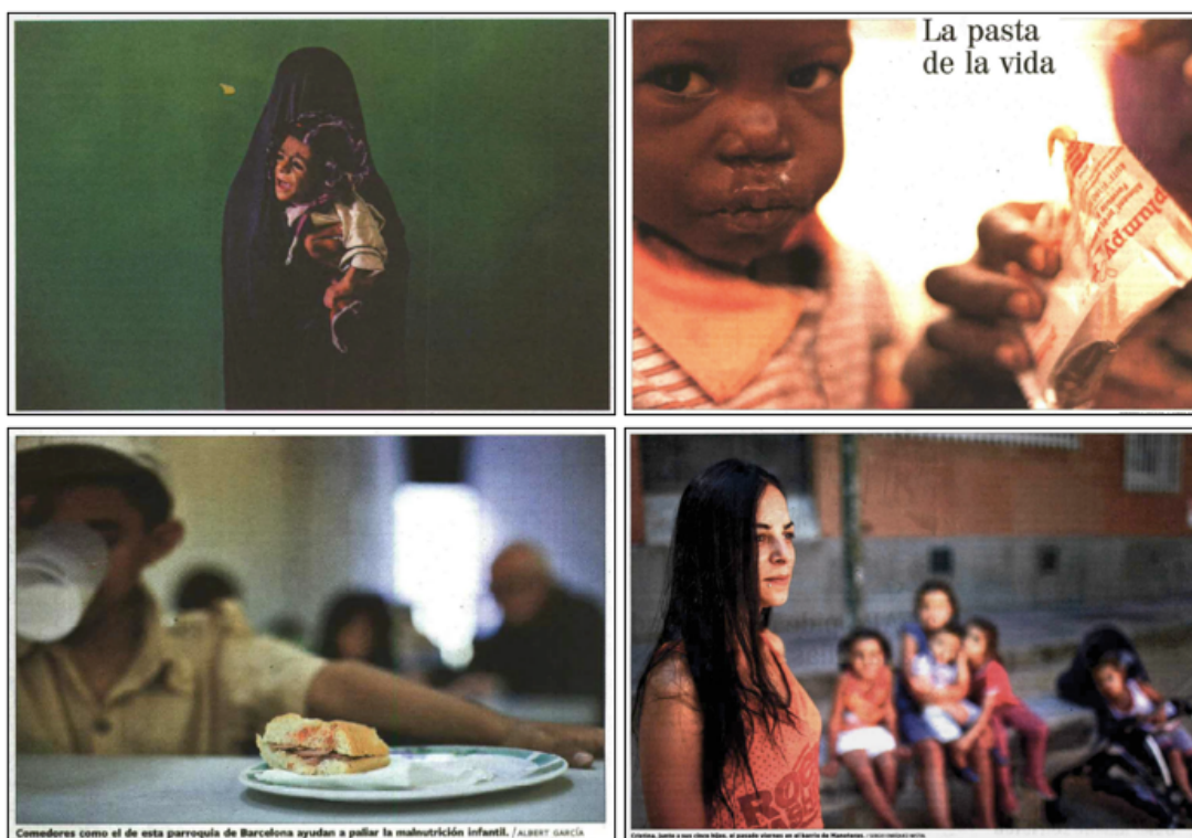
Imagen 6: Fotografías que muestran criterios discrepantes en cuanto a la protección de la identidad de la niñez.