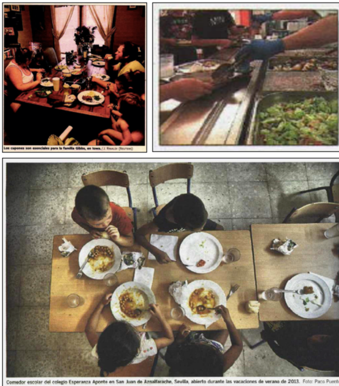
Imagen 10: Fotografías que representan escenas cotidianas en torno a la comida.