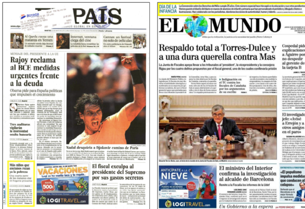
Imagen 1: Portadas con artículos que abordan la pobreza infantil como tema principal.