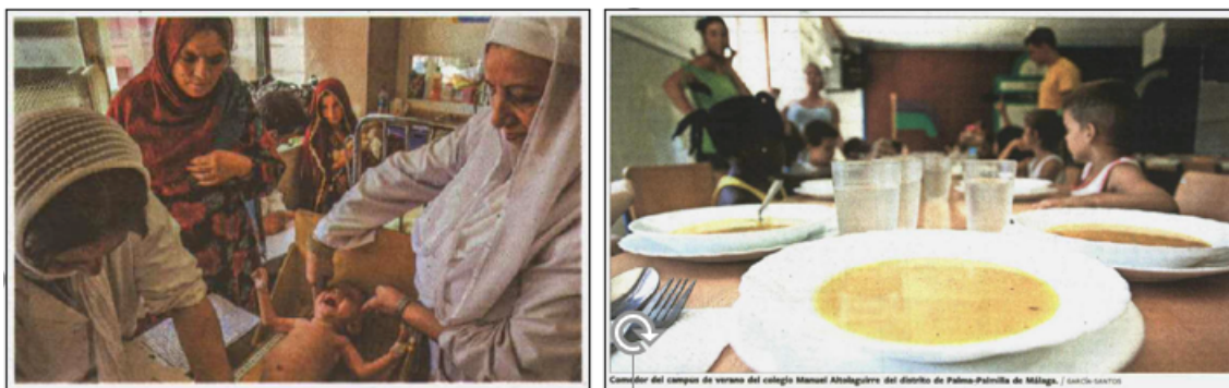
Imagen 9: Fotos que ilustran las informaciones “La hambruna devora a los niños de Afganistán” y “Apagón estadístico sobre la malnutrición”.