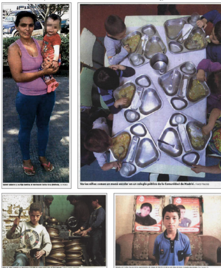
Imagen 3: Ejemplos de fotografías de diversas unidades de análisis en las que aparecen menores de diferentes orígenes.