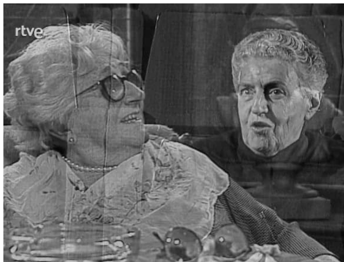
Fig. 2. Rosa Chacel y Fernanda Monasterio. Entrevista de Ramón Miravittlas a Rosa Chacel en el programa de televisión Cerca de ti , emitido el 13 de noviembre de 1993.

limitándose a puntuales apariciones conjuntas en la prensa a partir del retorno de Chacel, casi siempre relacionadas con actos de homenaje a la escritora o a otras personalidades del exilio (fig. 2).