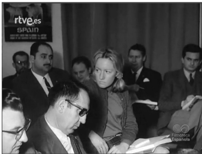
Imagen 2. NO-DO número 1364B de 24 de febrero de 1969, min. 3:42.

Igualmente, las imágenes sobre la rueda de prensa con los periodistas, pretende recalcar, no solo la presencia de corresponsales de medios de comunicación extranjeros, sino también en el interés con que los asistentes siguen la información. (Imagen 2)