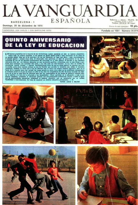
Imagen 21. La Vanguardia , 20 de noviembre de 1975.