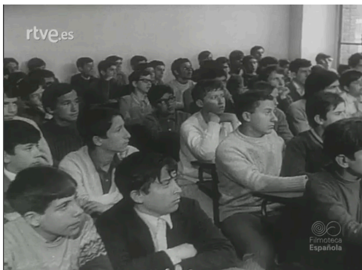
Imagen 4. NO-DO número 1414A de 9 de febrero de 1970, min. 2:46. Filmoteca Española.

Para representar la exagerada capacidad selectiva del sistema se recurre a las imágenes de una clase llena en la primaria que se va vaciando con el paso a los distintos niveles: 100 en la primaria; 27 en la secundaria y solo 3 en la Universidad. (Imágenes 5, 6 y 7)