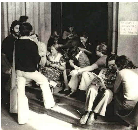
Imagen 27. Huelga de personal docente de la Universidad de Barcelona en 1976.

En el apartado de colecciones de fotografías existentes en instituciones educativas podemos hablar también de las existentes en Universidades. La imagen 27, de la huelga de personal docente de la Universidad de Barcelona en 1976, procede del archivo de la Universidad de Barcelona. 44