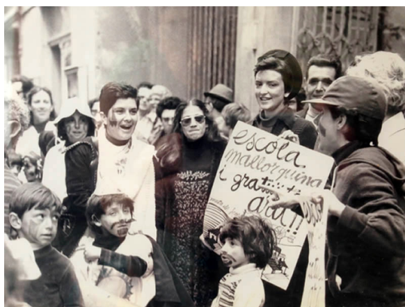
Imagen 26.

En el apartado de colecciones de fotografías existentes en instituciones educativas podemos hablar también de las existentes en Universidades. La imagen 27, de la huelga de personal docente de la Universidad de Barcelona en 1976, procede del archivo de la Universidad de Barcelona. 44