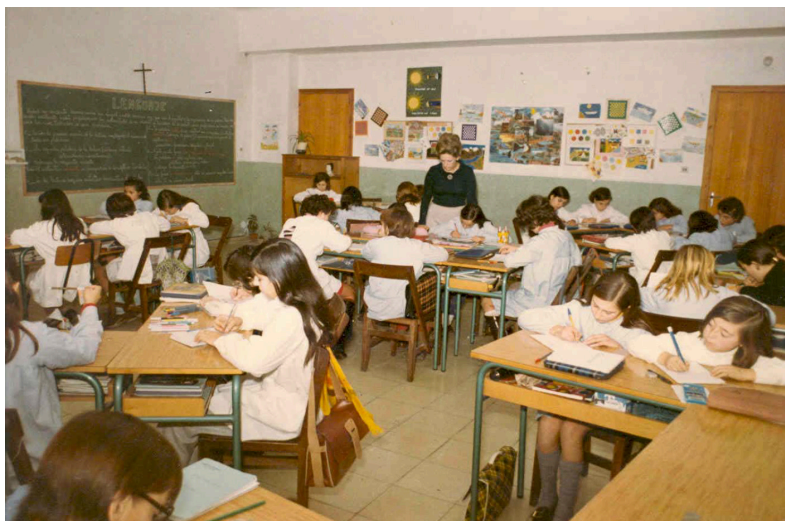
Imagen 25. Aula del Colegio Sant Josep Obrer., 1972.

En algunos casos, estas fotografías conservadas en instituciones han servido para publicar libros conmemorativos o han sido presentadas en exposiciones. 43 Solo en pocos casos estas fotografías muestran cambios en la práctica educativa provocados por la LGE. Uno de estas fotos que nos muestran cambios significativos en la organización de las aulas, es la imagen 25 con una fotografía de 1972 del Colegio Sant Josep Obrer.