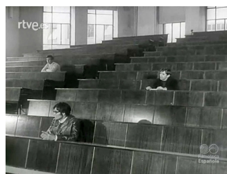
Imágenes 5-6-7. NO-DO número 1414A de 9 de febrero de 1970, de min. 2:58 a 3:08.

La parte B de este documental número 1414, describe las distintas etapas del nuevo sistema educativo que introduce la LGE. 22 Las imágenes que se presentan en este documental, aunque el texto se centre