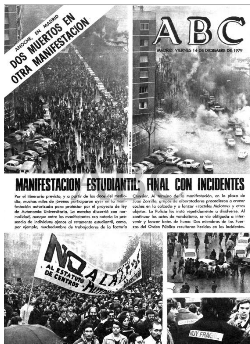
Imagen 24. ABC, 14 de diciembre de 1979.