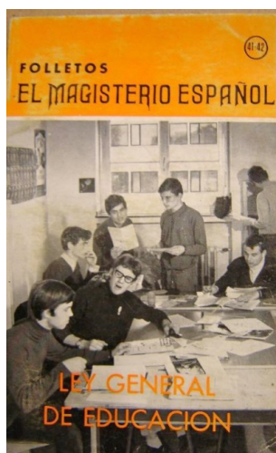
Imagen 16. Folletos El Magisterio Español . Ley General de Educación , Madrid, 1971.

Las revistas pedagógicas y profesionales de la época no incluyen habitualmente fotografías referidas a los acontecimientos de los que hablan. El texto se ilustra con fotos de agencia que no siempre representan acontecimientos concretos directamente relacionados con la información que trata el artículo. Las imágenes son más bien ilustraciones del texto y no testimonios de la realidad de la que se habla.