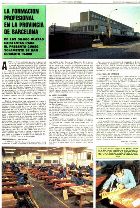
Imagen 20. La Vanguardia , 28 de diciembre de 1975.