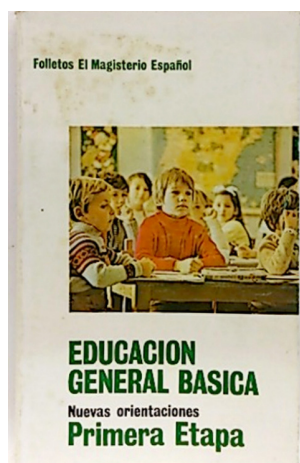
Imagen 14. Folletos El Magisterio Español . Primera Etapa, Madrid, 1971.

Los folletos publicados por la editorial El Magisterio Español , incluyendo las orientaciones para la primera y la segunda etapa de Educación General Básica, son dos testimonios de la representación gráfica de las orientaciones que quería publicitar la LGE. En los dos casos la fotografía de portada se centra en el alumno. En el segundo caso recalca, además, el trabajo autónomo individual, pero con una estructura espacial y un mobiliario que permite el trabajo en equipo. En el caso de la portada de las orientaciones de la primera etapa (imagen 14) se representa una clase mixta que por el contrario no se representa en la portada de las orientaciones de la segunda etapa (imagen 15). La portada de la publicación de la quinta edición de la Ley General de Educación, editada el 1971 por parte de la misma editorial, se centra claramente en enfatizar el trabajo autónomo y en equipo de los escolares. (Imagen 16)