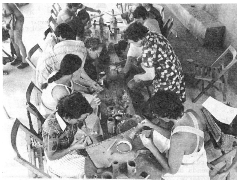
Imagen 22. Pissarra 7 (1977): 22.

Igualmente se manifestarán nuevas posiciones críticas frente a la LGE que tendrán presencia gráfica en las publicaciones periódicas y en las agencias de prensa, como las demandas de una mayor inversión pública en educación, las reclamaciones de los distintos colectivos docentes, las tensiones entre escuela pública y privada o la aparición de alternativas escolares y pedagógicas.