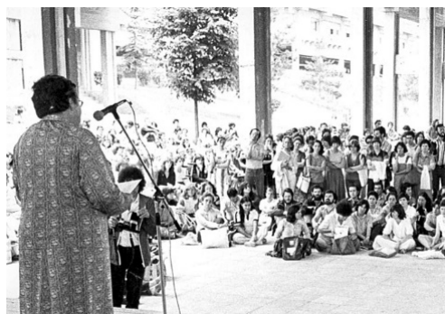
Imagen 28. Escola d'Estiu 1979, Fundació Marta Mata.

Otras colecciones de fotografías relacionadas con la educación en el período 1970-80 son las que pueden encontrarse sobre las propuestas de formación del profesorado alternativas a las Escuelas Normales que proliferaron desde las etapas finales del franquismo. Sobre este tema una colección importante es la de la institución Rosa Sensat de Barcelona. Algunos ejemplos pueden verse en publicaciones de la propia institución Rosa Sensat, o en la web de fundaciones como la Fundació Marta Mata, que ofrece imágenes como la 28, tomada durante una intervención de Marta Mata en la Escola d'Estiu de 1979. 45