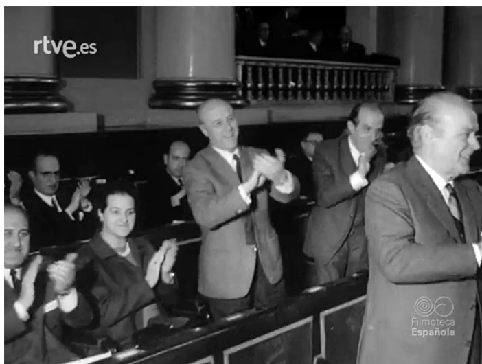
Imagen 1. NO-DO número 1364B de 24 de febrero de 1969, min. 3:18. Filmoteca Española.

Igualmente, las imágenes sobre la rueda de prensa con los periodistas, pretende recalcar, no solo la presencia de corresponsales de medios de comunicación extranjeros, sino también en el interés con que los asistentes siguen la información. (Imagen 2)