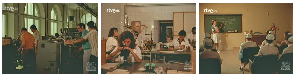
Imágenes 11-12-13. NO-DO 1 de enero de 1975, min. de 4:02 a 7:32.

Este es el tema que se plantea en el reportaje de NO-DO titulado «Oferta a la Juventud española. (La nueva Formación Profesional)» que, en el apartado de Documentales en Color, lleva fecha de 1 de enero de 1975. 25 Como en otras cuestiones, en el caso de la formación profesional el discurso icónico se centra en presentar imágenes de instalaciones modernas, laboratorios, talleres, edificios y aulas con buen equipamiento en las que se desarrolla esta publicitada formación profesional para jóvenes. Si uno de los prejuicios que se querían superar es el de que la formación profesional fuese una formación inferior y reservada a los sectores sociales de menos posibilidades económicas, un tema en el que insiste el documental, las imágenes no superan la tradicional distinción entre profesiones masculinas y femeninas, aunque aparecen algunas en las que comparten estudios los alumnos y las alumnas como ejemplos de escuela mixta, modalidad introducida a partir de la LGE. Ofrecemos seguidamente algunos ejemplos de las imágenes que aparecen en el mencionado reportaje. (Imágenes 11 a 13).