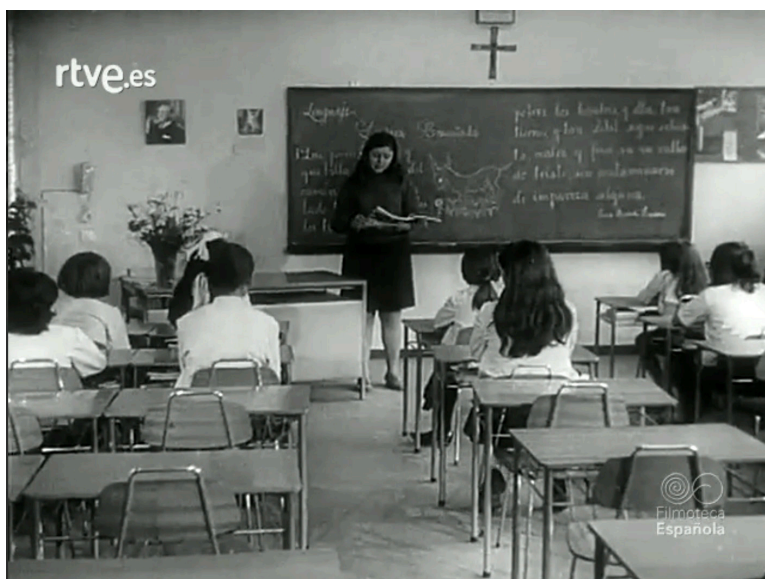
Imagen 3. NO-DO número 1414A de 9 de febrero de 1970, min. 2:43. Filmoteca Española.

Dos secuencias presentan la idea del contraste entre las aulas vacías en el medio rural con las muy saturadas en las ciudades. (Imágenes 3 y 4).