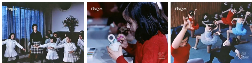
Imágenes 8-9-10. NO-DO, N 1543B, 31 de julio de 1972, min. de 5:25 a 8:37. Filmoteca Española.

del proceso de aprendizaje; la distribución del espacio escolar pierde la rigidez de las líneas de pupitres frente a la mesa del profesor, y aparecen los rincones de actividades o el suelo como espacio de actividad. Los nuevos equipamientos, como mesas y sillas que pueden ordenarse de distintas maneras, laboratorios bien equipados o nuevos audiovisuales, recalcan esta iconografía de la modernización. Otra de las constantes del discurso modernizador que se transmite con la aprobación de la LGE será la importancia de la educación artística. Con ello se pretende marcar distancias con la educación de las primeras etapas del franquismo, que daba a esta formación una escasa importancia. Las actividades artísticas, desde la perspectiva visual, son muy expresivas y rompen con la convencionalidad de otras situaciones educativas. Las siguientes imágenes son una muestra de este discurso iconográfico modernizador.