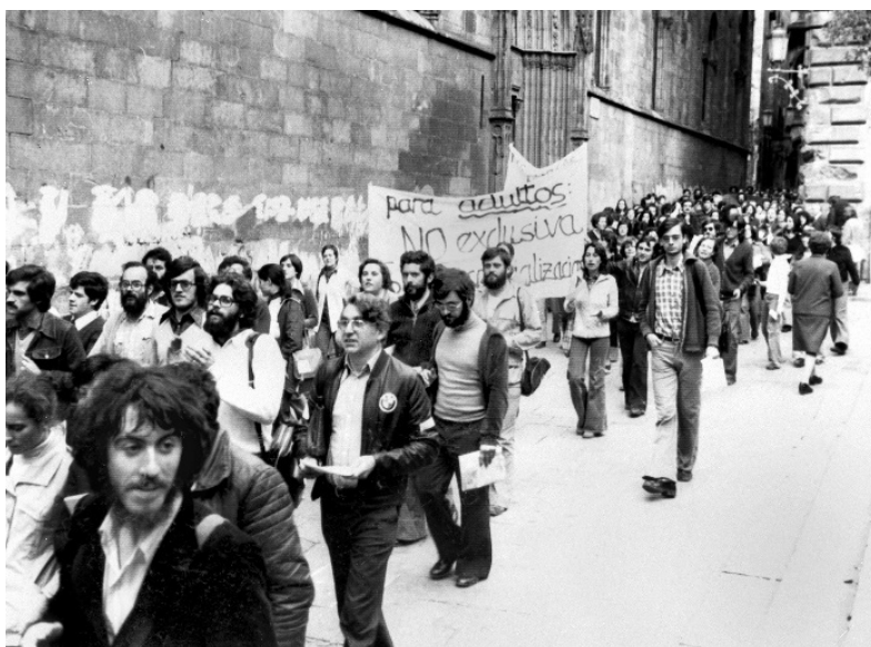
Imagen 23. Agencia EFE (729404).