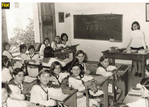
Imagen 29.

Como se ha indicado, las redes sociales son también un mostrador de imágenes que podemos relacionar con la LGE. En la imagen 29 podemos ver un ejemplo de este tipo de imágenes. En este caso en una cuenta de Facebook que lleva por nombre «Fotos Antiguas de Mallorca» y que muestra como la entrada en vigor de la LGE no provocó en principio un cambio radical de la organización de las aulas. 46