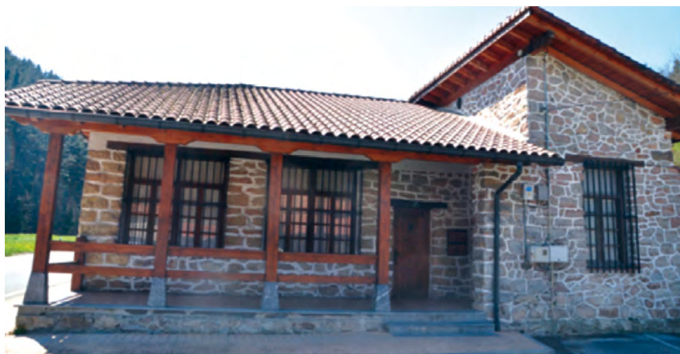
1. Argazkia. Hiruzubietako auzo-eskola mistoa, Ziortza-Bolibar. J. Garmendia

kopuruak baldintzatzen baitzuen. 84 Auzo-eskola bakoitzaren kostua, ezin da zehatz-mehatz jakin, gehienak auzotarren borondatezko ekarpenei esker eraiki baitziren. Gregorio Arrienek dio, bataz-beste, eskola mistoen kostua 17.000 pezeta izan zezakela garai hartan eta 24.000 pezeta eskola bikoitza. 85