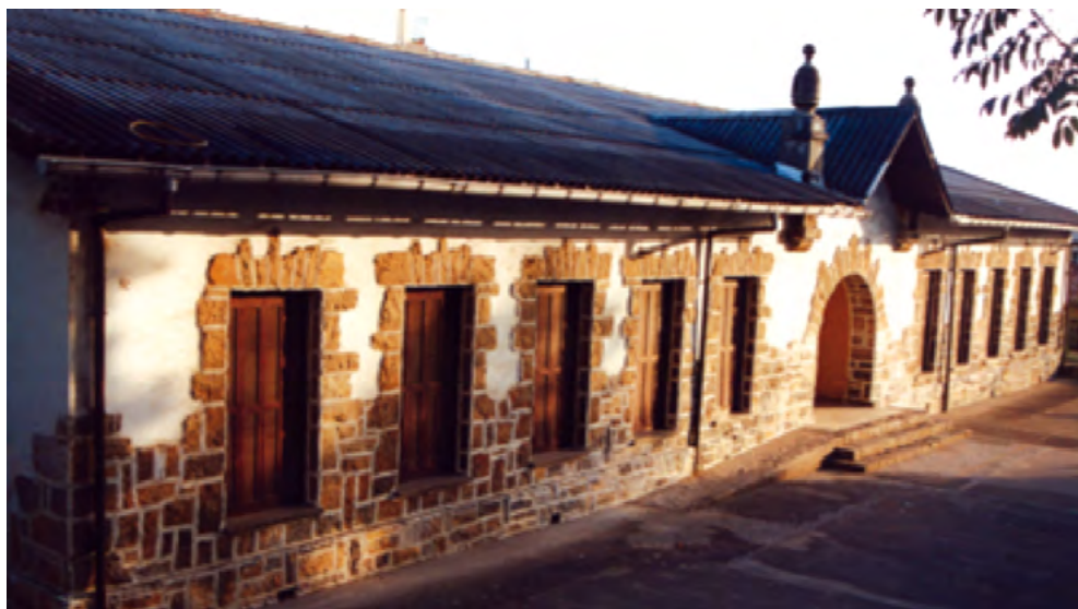
2. Argazkia. Zizurkilgo diputazioko landa-eskola bikoitza. J. Garmendia

Gipuzkoko Diputazioaren landa-eskolek Bizkaiko auzo-eskolak izan zituzten eredu, baina zenbait aldaketa eta hobekuntzekin. Gipuzkoan, Bizkaian bezala auzotarrek eta instituzioek ere parte hartu zuten: erai-kuntzaren kostuei dagokionez, Aurrezki Kutxa Probintzialak, %10 jarri zuen, Diputazioak % 25a eta zegokion udal eta auzotarrek gainerako %65a. 1936an, proiektuan zeraman atzerapena ikusiz, hasierako baldintzak aldatu ziren, horrela udalei eskatu zitzaien lursailak eskaintzea, 1.000-1.500 metro kuadro, eta lanaren kitapenerako %25 jartzea. Beste guztia Diputazioaren kontu joango litzateke. 88