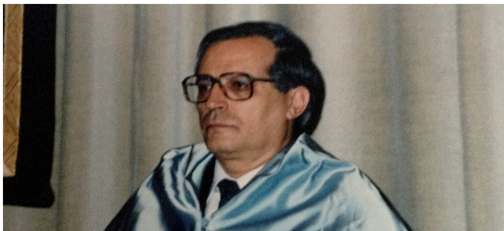
Toma de posesión como profesor titular en la ceremonia de inauguración del curso en la UNED, octubre de 1986.

Como es sabido, la disciplina aparece por vez primera en el currículo de la licenciatura de Pedagogía en 1974, y lo hace como una materia optativa bajo la denominación de Política y Legislación Educativas. A partir de esa fecha se producen múltiples cambios en los planes de estudio, adquiriendo, según las universidades, otros nombres, siendo los más comunes, además del de 1974, los de Política y Administración Educativas, Política Educativa, quizá la más común, o Política de la Educación, aunque siempre en el ámbito propio de los departamentos de Teoría e Historia de la Educa-