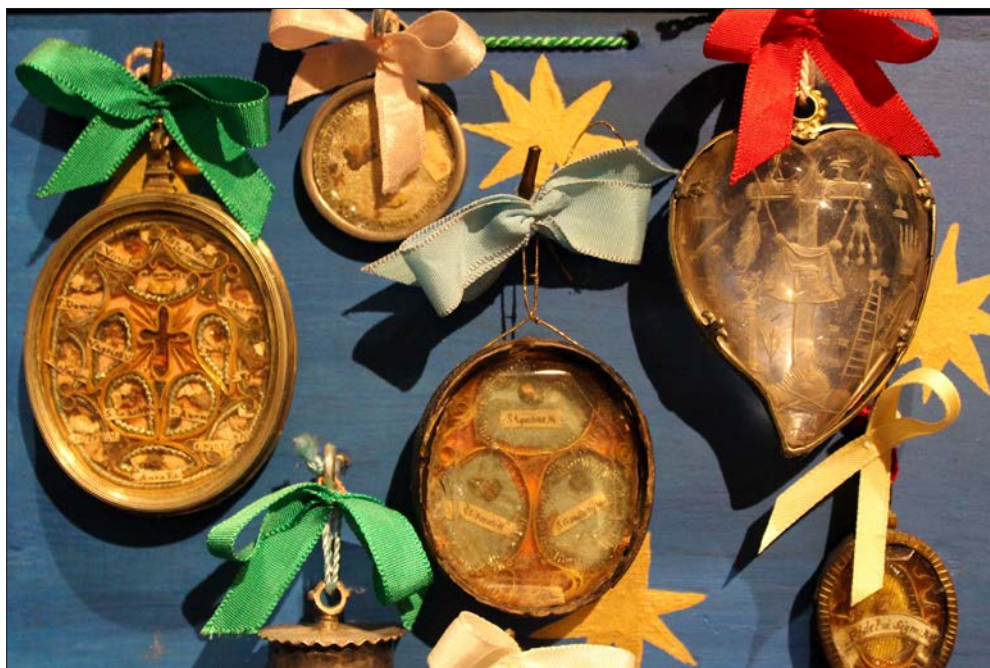
FIGURA 1. KLOSTERARBEITEN Y RELICARIOS DE LA HORNACINA DEL CORO (DETALLE). REAL MONASTERIO DE SANTA CLARA, SALAMANCA.

Al gran número y variedad de los relicarios (FIGURA 1) se une la ausencia de inventios o inventarios que relacionen las reliquias con su lugar de origen o con la historia de su ensamblaje, por lo que resta preguntarse lo que un mayor conocimiento de su imagen como objetos puede aportar. Su morfología permite identificarlos con los Klosterarbeiten europeos y novohispanos y plantear para estas piezas una producción y uso en entornos claustrales, probablemente entre los siglos XVII y XVIII. A falta de un mayor conocimiento de su origen, la comprensión de estos pequeños jardines y laberintos de papel parte de los contextos de recepción que hicieron que hoy se conserven en el coro del Real Monasterio de Santa Clara de Salamanca y de las tradiciones que fundamentan su condición como piezas de devoción conventual que «crean un espacio femenino único» 11 para la comunidad.