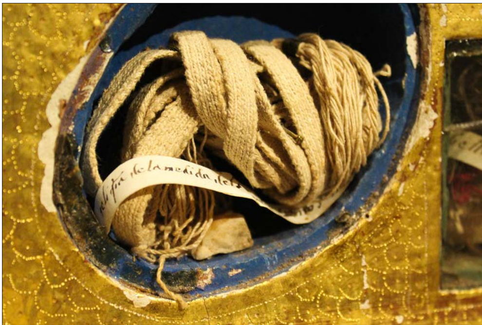
FIGURA 10. MEDIDA DEL SANTO SEPULCRO. REAL MONASTERIO DE SANTA CLARA, SALAMANCA.

Caroline Walker Bynum, «las medidas traídas de Tierra Santa eran algo más que reliquias de contacto, embebidas del poder de un original al ser presionadas sobre él [...]. La propia medición pasó a ser –y transmitir– la presencia de la persona» 63 , auspiciando así una suerte de peregrinación visual y virtual a partir de la potencia evocadora del objeto sacro. Todos estos vestigios de santidad se acompañan, así mismo, de pequeñas tiras de papel escrito con varias caligrafías que denotan la historicidad de su culto y su dilatación en el tiempo.