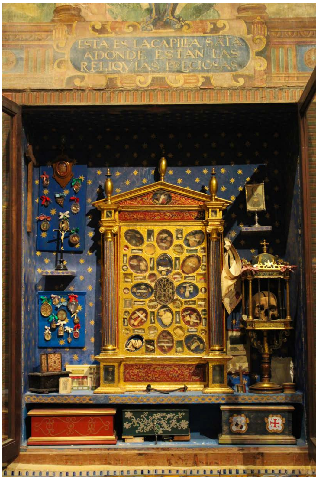
FIGURA 3. HORNACINA DEL CORO. REAL MONASTERIO DE SANTA CLARA, SALAMANCA.