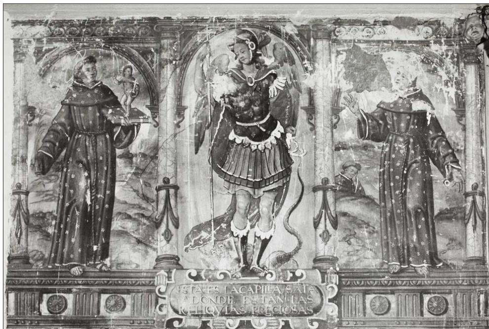
FIGURA 2. PINTURAS MURALES E INSCRIPCIÓN DE LA HORNACINA DEL CORO, FEBRERO 1974. MEMORIA DE INTERVENCIÓN DE LA RESTAURACIÓN DE LAS PINTURAS MURALES DEL CONVENTO DE SANTA CLARA (SALAMANCA). ICROA, JUAN RUIZ PARDO. Ministerio de Cultura y Deporte, Archivo del IPCE, BM 189 / 9 ( http://catalogos.mecd.es/opac/ ).

Por otra parte, el decoro en la recepción de estas piezas como reliquias en el convento salmantino se enfatiza con la elección de su ubicación. El locus de los tesauros cuenta desde antaño con una dignidad especial dentro de las topografías de las ciudades y de los complejos arquitectónicos, de modo que la preeminencia de las cámaras del tesoro, las ermitas o las hornacinas acredita el carácter precioso de lo que se guarda en ellas. Esta deferencia templaria se comparte, así mismo, con espacios conventuales, en los que «los santos y sus reliquias, junto con el ajuar litúrgico y los libros de oficios, constituían el tesoro espiritual y material más valioso» 12 .