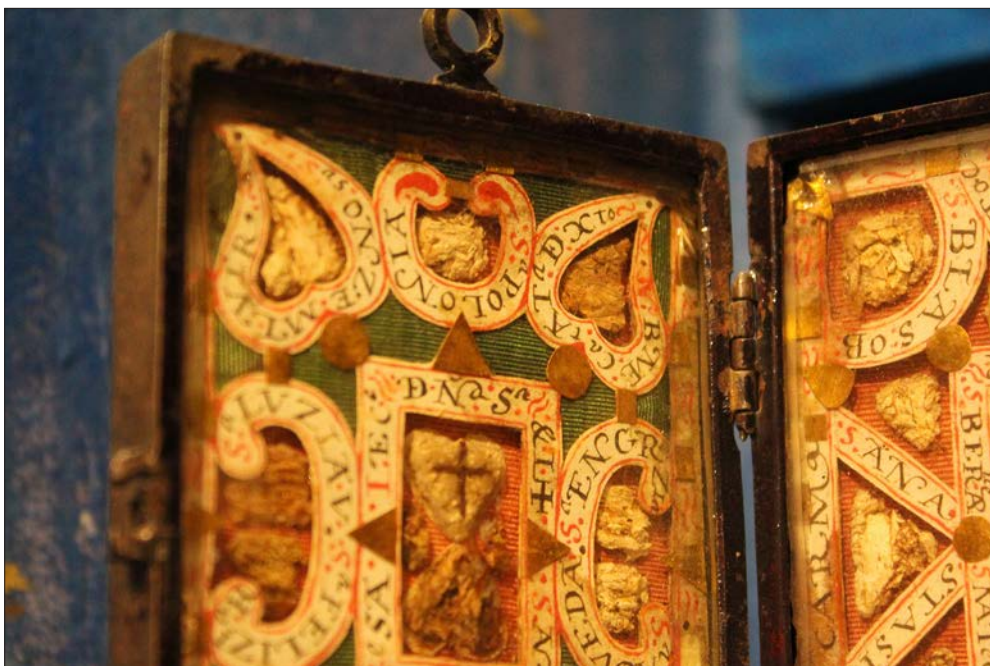
FIGURA 8. RELICARIO (DETALLE DE LAS RELIQUIAS FEMENINAS). REAL MONASTERIO DE SANTA CLARA, SALAMANCA.

El estudio de los caminos de papel que se conforman en torno a las reliquias de las santas parte del «diálogo entre lo personal y subjetivo, y lo social o el contexto que contribuye a la atmósfera o el espacio en el que uno se ve afectado por algo», navegando para ello «por un espacio fluido relacionándose con objetos e ideas y extrayendo las conexiones que les son inherentes» 50 y que, en este caso, refleja una identificación y relación cercana y cordial entre las religiosas y las figuras de las santas. Son estas unas conexiones, como ha indicado David Carrillo-Rangel, que no sólo están «definidas por la intención del artista o del usuario, sino también por la realidad social, más que por la realidad crítica, en la que se creó el objeto, y [...] el presente en el que interactúa el sujeto» 51 . Es por ello por lo que el análisis de los contextos específicos de privación sensorial, y de anhelo de contacto con lo divino, las prácticas devocionales y la experiencia visionaria desarrolladas a partir de este relicario son fundamentales en la formación de la atmósfera en la que se produce un affectus , psicológico, físico y social y que se materializa en las formas elegidas para presentar las reliquias femeninas 52 .