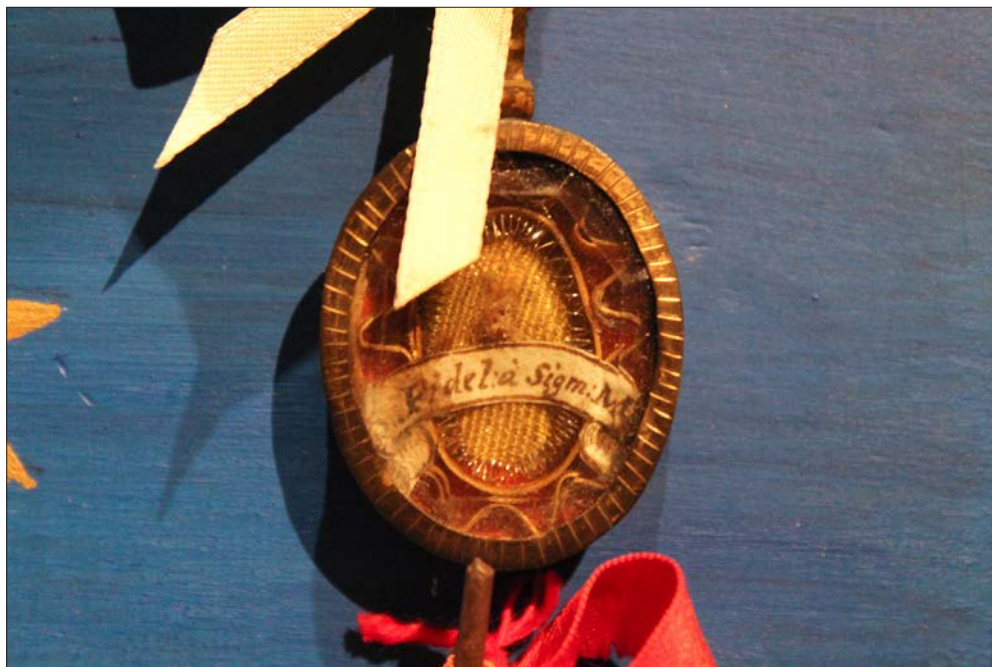
FIGURA 5. RELICARIO DE PAPEL ROULÉ Y TELA CON RELIQUIA DEL CAPUCHINO SAN FIDEL DE SIGMARINGA. REAL MONASTERIO DE SANTA CLARA, SALAMANCA.

sino que instituyen comportamientos legítimos para las religiosas 40 , «de forma que, evitando la ociosidad, enemiga del alma, no apaguen el espíritu de la santa oración y devoción» 41 . Las expectativas conductuales respecto del trabajo de las monjas sitúan la labor manual como una actividad que «se entendía al servicio de la oración, no sólo porque ocupaba los huecos temporales dejados por ésta, sino porque la favorecía en el momento mismo de su puesta en práctica» 42 .