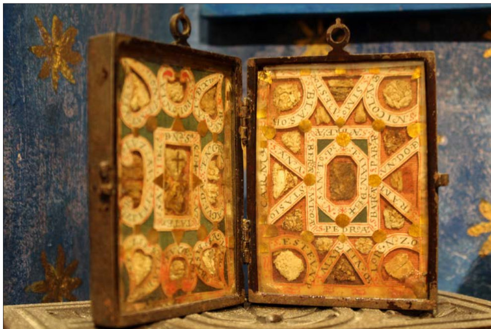
FIGURA 7. RELICARIO. REAL MONASTERIO DE SANTA CLARA, SALAMANCA.

posición, del modelo y de la forma para transformar el papel escrito «en caminos visuales íntimos y táctiles activados a través de la oración» 48 .