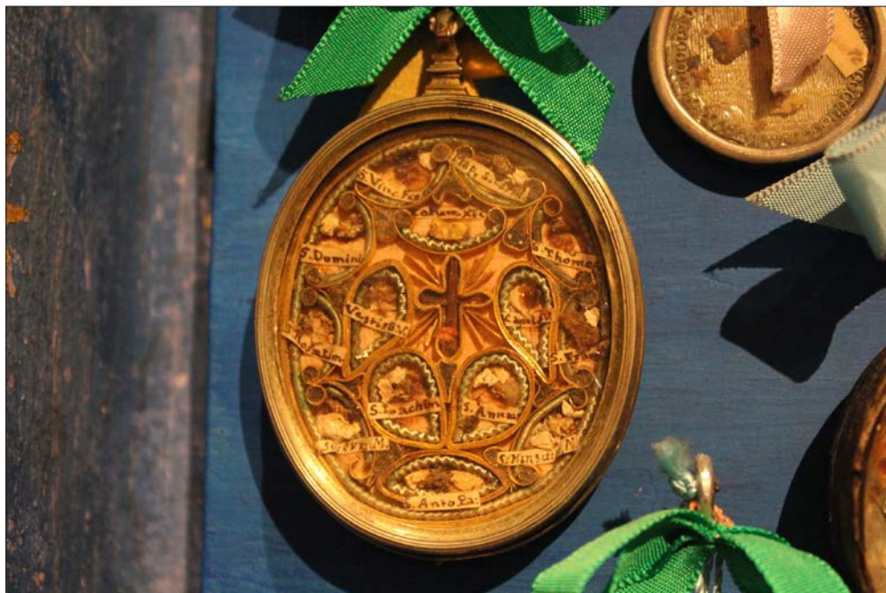
FIGURA 4. RELICARIO DE PAPEL ROULÈ CON LIGNUM CRUCIS. REAL MONASTERIO DE SANTA CLARA, SALAMANCA.

Santa Clara, un relicario cuyo estado de conservación y complejidad lo singulariza de los restantes ejemplos (FIGURA 4).