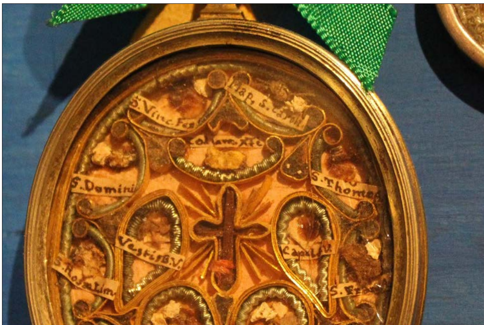
FIGURA 6. RELICARIO DE PAPEL ROULÉ CON LIGNUM CRUCIS (DETALLE). REAL MONASTERIO DE SANTA CLARA, SALAMANCA.