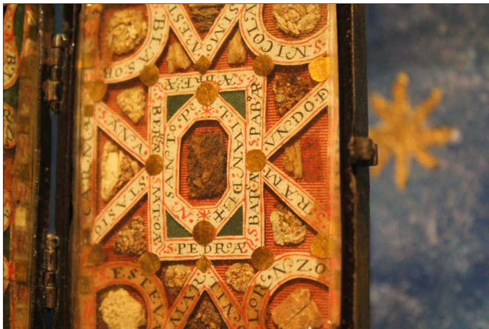
FIGURA 9. RELICARIO (DETALLE DE LAS RELIQUIAS MASCULINAS). REAL MONASTERIO DE SANTA CLARA, SALAMANCA.

En la hoja que resta del relicario se disponen las reliquias masculinas de forma semejante a las de las santas, aunque organizadas con caminos rectos (FIGURA 9). Son diecisiete los restos correspondientes a apóstoles y santos frailes, tales como Simón Estoc, Raimundo de Peñaforc o Estevan Protomártir. El centro se destina igualmente a un fragmento de mayor tamaño, identificada como de Nuestro Santo Padre F. Juan de la + . Esta circunstancia, unida a la presencia de la santa de Ávila en un lugar preeminente del lado izquierdo del relicario, invita a plantear un origen para el conjunto alejado de los claustros franciscanos y de vinculación carmelitana. A falta de más información sobre el origen de este contenedor sacro, resta interrogar al contexto propicio para los intercambios materiales de piezas de devoción.