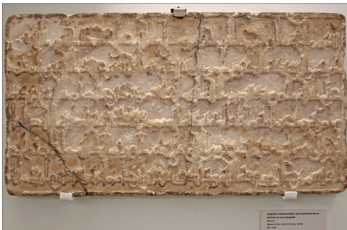
FIGURA 1. LÁPIDA DE RUMAYKIYYA, 1085. Museo Arqueológico de Sevilla CE252.

su propio título indica, es una continuación de la obra biográfica Tā'rīj 'ulamā' al-Andalus ( Historia de los ulemas de al-Andalus ) de Ibn al-Faraḍī (962-1012), centrada en las biografías de los sabios de al-Andalus hasta el año 1139.