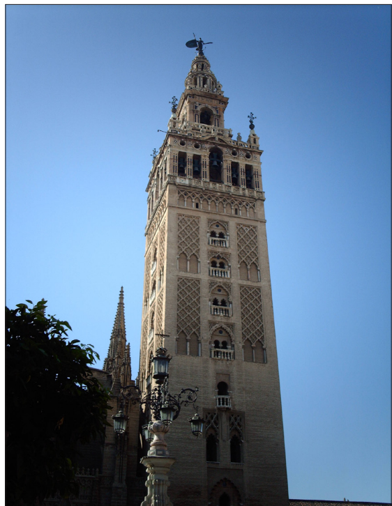
FIGURA 3. VISTA EXTERIOR DEL ANTIGUO SAWMA'À (ACTUAL TORRE-CAMPANARIO) DE LA MEZQUITA ALJAMA ALMOHADE DE SEVILLA, 1184-1196, CATEDRAL DE SEVILLA.