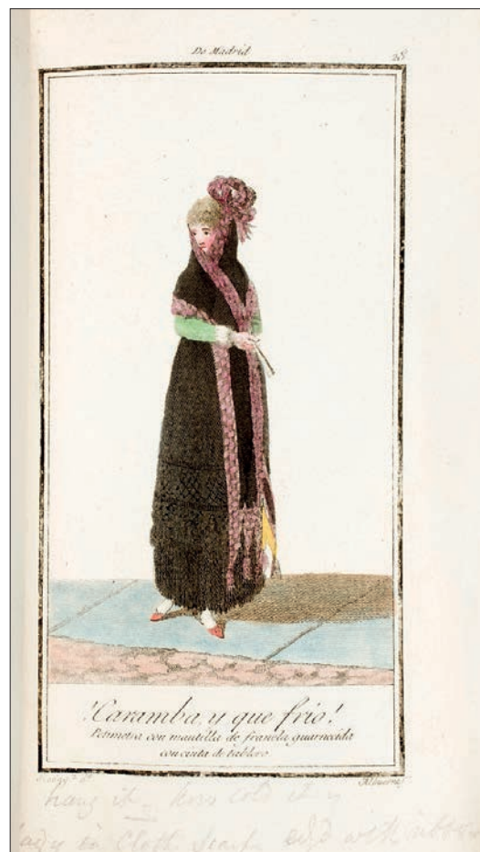
FIGURA 3. PETIMETRA CON MANTILLA DE FRANELA GUARNECIDA CON CINTA DE TABLERO, DE MADRID, 1801, AGUAFUERTE Y BURIL SOBRE PAPEL VERJURADO. MUSEO NACIONAL DEL PRADO.

Así, el figurín llamado Petimetra , La princesa de Luzán (figura 2), 58 es una copia de la estampa titulada Petimetra con mantilla de franela guarnecida con cinta de tablero, de Madrid (figura 3). La única diferencia es que el figurinista llevó a cabo una simplificación de los elementos que componían el vestido de la petimetra y de la propia escena. Lo mismo sucede con el figurín Caballero de baile , 59 que reproduce la estampa A palacio, Petimetre de serio; Goya de calle (figura 4) es copia a su vez de Petimetre con capa (figura 5); Menestral o manolo 60 es copia de Es lunes, no trabajo. Menestral, o El torero (figura 6) 61 reproduce No me alborote Vmd. la sangre, Majo de Sevilla (figura 7).