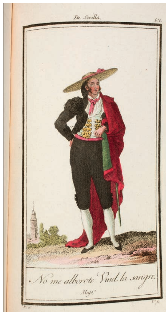
FIGURA 7. MAJO DE SEVILLA, 1801, AGUAFUERTE Y BURIL SOBRE PAPEL VERJURADO. MUSEO NACIONAL DEL PRADO.

la princesa o Doña Pepita (figura 8), es copia de la estampa número 6, Maja / Elegante (figura 9); Matón, torero o majo 64 reproduce la estampa número 11, Andaluz ; o el figurín Doña Pepita o la Princesa. Gran maja de serio , reproduce el grabado número 12, Petimetra con manto en la Semana Santa . Por tanto, exceptuando el caso del Andaluz , el resto de trajes copiados son madrileños, en consonancia con la temática de la zarzuela.