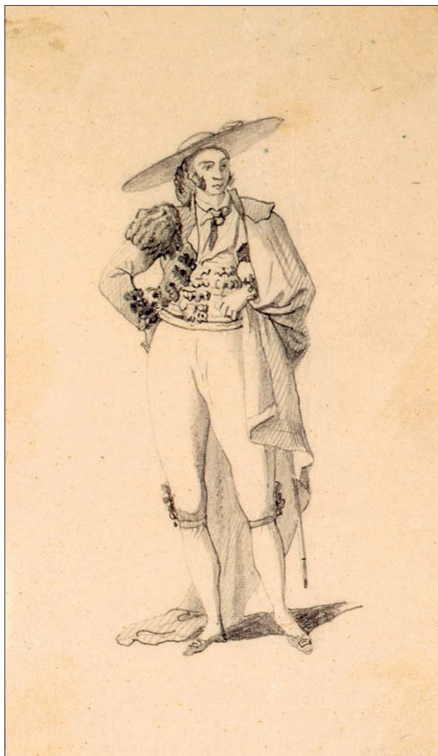
FIGURA 6. MENESTRAL, O EL TORERO, 1864, LÁPIZ SOBRE PAPEL.