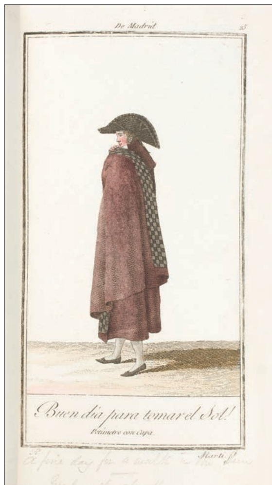
FIGURA 5. PETIMETRE CON CAPA, DE MADRID, 1801, AGUAFUERTE Y BURIL SOBRE PAPEL VERJURADO. MUSEO NACIONAL DEL PRADO.