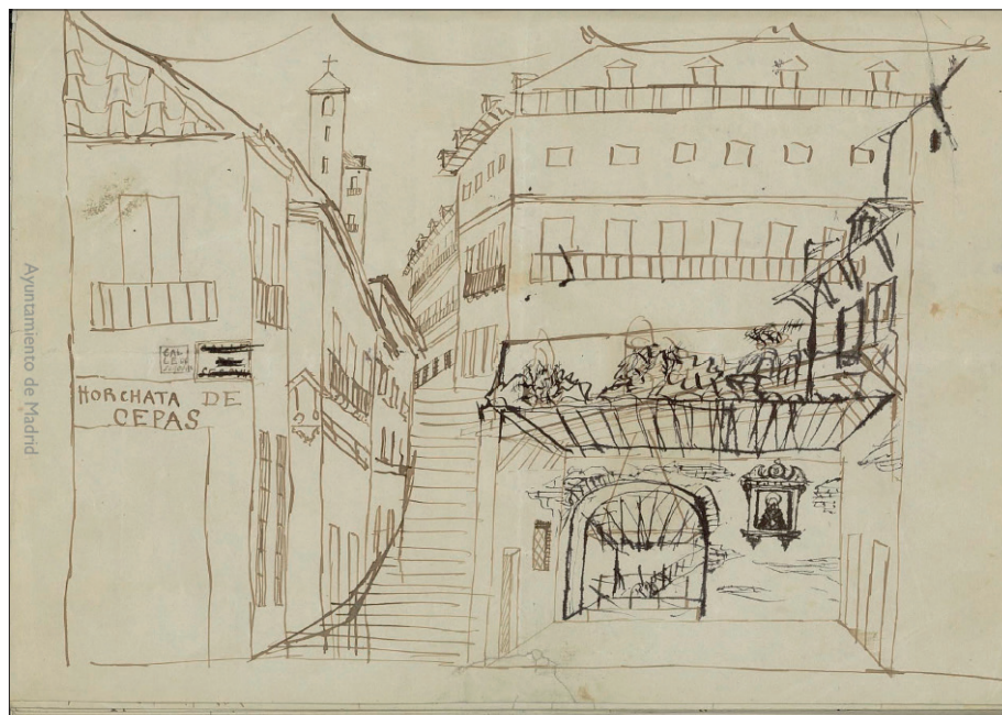
FIGURA 11. DISEÑO PARA EL ESCENARIO DEL SEGUNDO ACTO DE PAN Y TOROS , 1864, MANUSCRITO DEL LIBRETO ORIGINAL DE JOSÉ PICÓN. BIBLIOTECA HISTÓRICA MUNICIPAL DE MADRID. LICENCIA CREATIVE COMMONS.

Tanto la descripción en el texto escrito como la representación a través del diseño permiten establecer paralelismos con la pintura de género en boga a mediados del siglo XIX, en la que habitualmente las escenas eran ambientadas en calles de Madrid, con castizos establecimientos identificados con carteles en sus fachadas, como se aprecia en obras de Eugenio Lucas Velázquez o Ángel Lizcano Monedero. Los diseños de escenarios para zarzuelas y sainetes durante el siglo XIX reflejaron a la perfección el costumbrismo triunfante en la pintura de género española, apreciándose esas transferencias entre pintura, diseño y literatura a las que hacía referencia al inicio de este artículo. 66