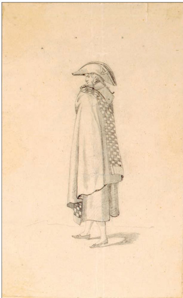
FIGURA 4. GOYA DE CALLE, 1864, LÁPIZ SOBRE PAPEL.