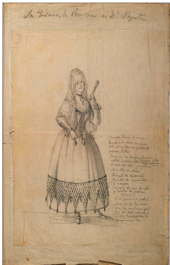
FIGURA 8. TIRANA, LA PRINCESA O DOÑA PEPITA, 1864, LÁPIZ SOBRE PAPEL.