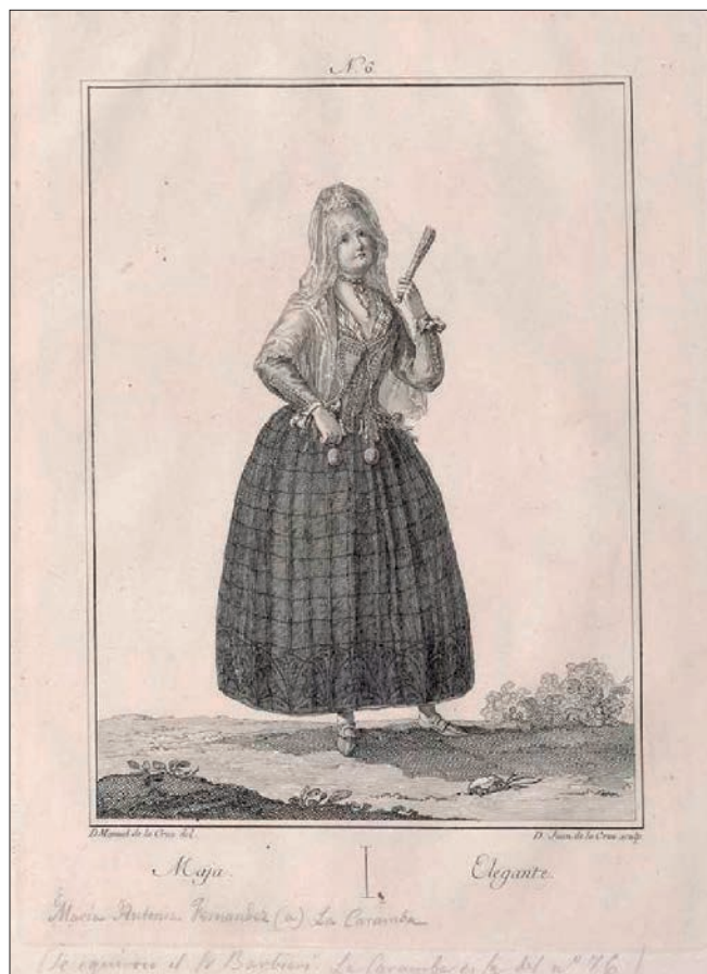
FIGURA 9. MAJA/ELEGANTE, 1777, AGUAFUERTE Y BURIL SOBRE PAPEL AVITELADO. BIBLIOTECA NACIONAL DE ESPAÑA.

precisión los trajes que finalmente fueron elaborados. Se trata de una pequeña carte de visite en la que se muestra a dos artistas vestidas de majas, por delante de lo que parece una escenografía. El atuendo que portan es muy similar al del figurín para manola, con la diferencia de que las actrices llevan manga larga cuando el dibujo dejaba los brazos al descubierto, lo que revela un cierto nivel de adaptación de los diseños originales.