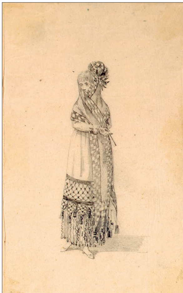
FIGURA 2. PETIMETRA. LA PRINCESA DE LUZÁN, 1864, LÁPIZ SOBRE PAPEL.