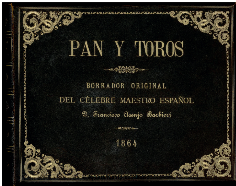
FIGURA 1. PAN Y TOROS, PARTITURA ORIGINAL DE FRANCISCO ASENJO BARBIERI, 1864, BIBLIOTECA HISTÓRICA MUNICIPAL DE MADRID, LICENCIA CREATIVE COMMONS.

Finalmente, los figurines pasaron de la Biblioteca al Museo de Historia de Madrid, donde se conservan en la actualidad. 36