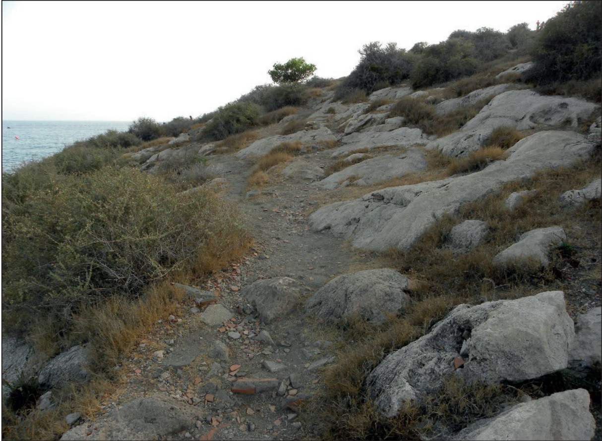
FIGURA NÚMERO 13.- AFORTUNADAMENTE MUCHOS DE LOS RESTOS CERÁMICOS EN SUPERFICIE PASAN DESAPERCIBIDOS POR SU DESCONOCIMIENTO GENÉRICO JUNTO A SU RELATIVA OCULTACIÓN DEBIDO A LA FUERTE PRESENCIA DEL ROQUEDO Y DE UNA VEGETACIÓN XERÓFILA FRONDOSA DE PORTE ARBUSTIVO.

de coordinación entre las distintas administraciones públicas, con determinadas competencias compartidas o simultáneas en su tratamiento y gestión.