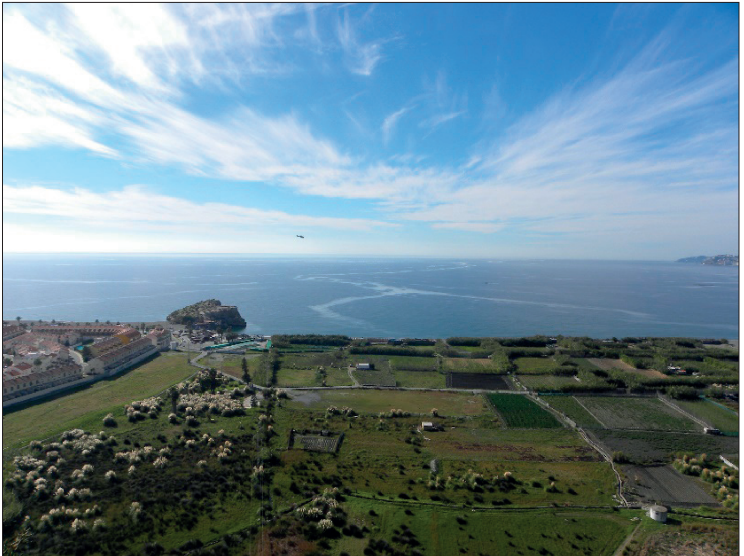
FIGURA NÚMERO 1.- EL PEÑÓN Y LA VEGA A LA ALTURA DEL TÉRMINO MUNICIPAL DE SALOBREÑA, CAPTADA DESDE LAS INMEDIACIONES DE SU CASTILLO. Autor: José Ramón Sánchez Holgado.

El peñón de Salobreña puede ostentar el privilegio de poseer los vestigios conocidos de presencia humana, posiblemente de los más antiguos de la costa granadina, una vez abandonados los asentamientos conocidos como «Cultura de las Cuevas» (GÓMEZ BECERRA, 1998), que para esta costa se localizan principalmente en las Cuevas del Capitán, de los Murciélagos y de las Campanas (Todas ellas del periodo Neolítico). Durante el inicio de los asentamientos a nivel de costa y con una lógica intencionalidad en la búsqueda de zonas llanas y más productivas en recursos, también destacan el yacimiento arqueológico de la playa de La Rijana, marcada por su proximidad a la Cueva de las Campanas y los incipientes asentamientos de Almuñécar y Salobreña, entre otros.