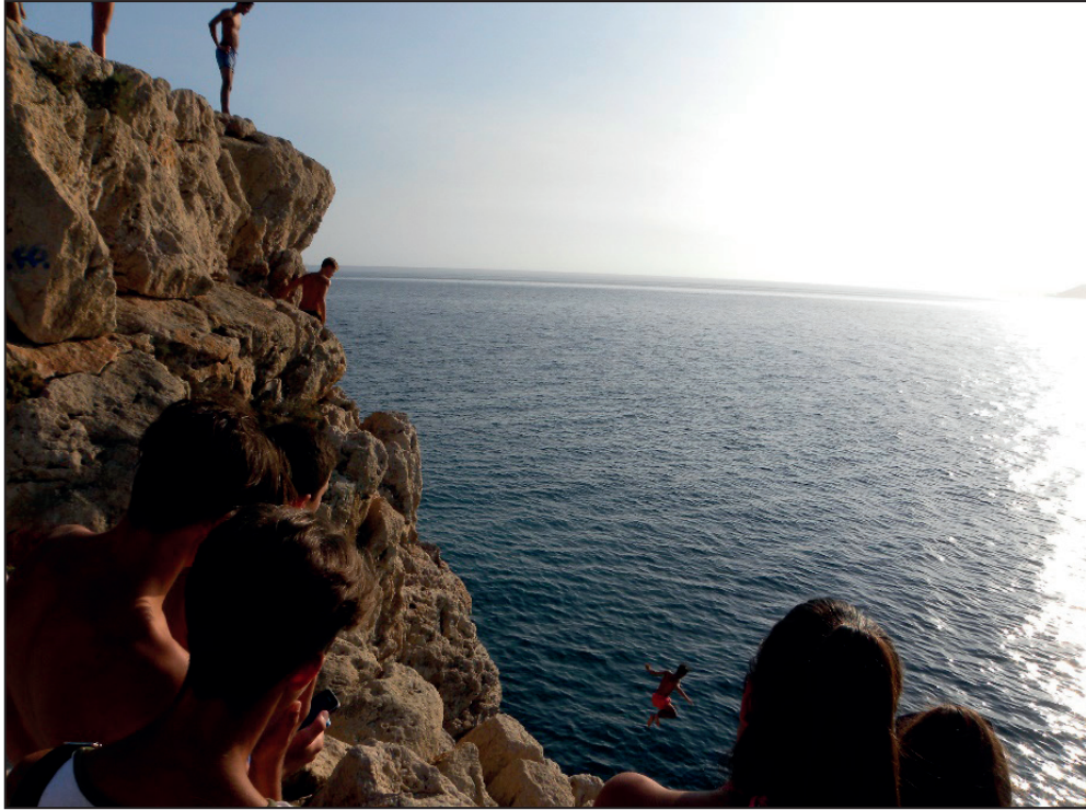
FIGURA NÚMERO 15.- DECENAS DE JÓVENES JALEAN LOS SALTOS EXTREMOS Y DE ALTO RIESGO, QUE EFECTÚAN NUMEROSOS ADOLESCENTES DESDE LOS SALIENTES DEL PRONUNCIADO ACANTILADO DEL PEÑÓN. Autor: José Ramón Sánchez Holgado.