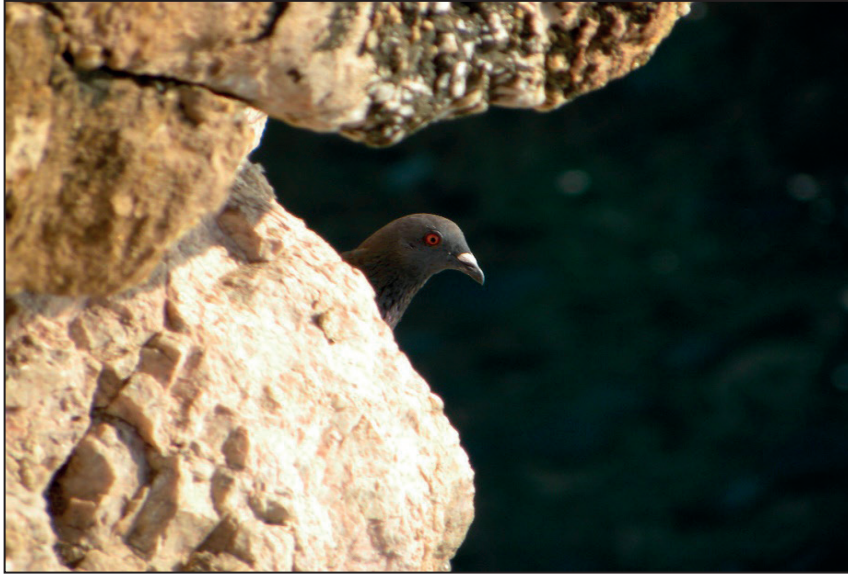
FIGURA NÚMERO 17.- NUMEROSAS ESPECIES UTILIZAN LAS OQUEDADES DEL ROQUEDO DONDE SE FAVORECE A LA NIDIFICACIÓN.