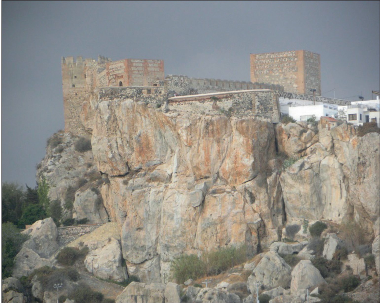
FIGURA NÚMERO 22.- EL CASTILLO DE SALOBREÑA, CAPTADA DESDE EL PEÑÓN. Autor: José Ramón Sánchez Holgado.