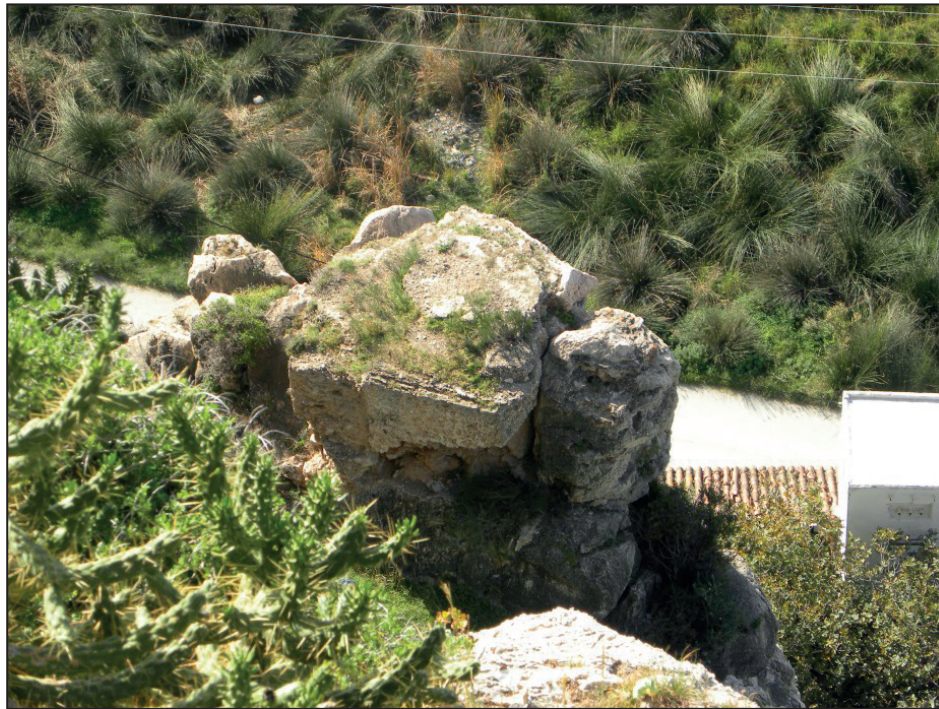
FIGURA NÚMERO 21.- RESTOS DE UNA ANTIGUA TORRE, DE AL MENOS DOS EXISTENTES, QUE CUSTODIABA LA LLEGADA DE EMBARCACIONES Y EL ACCESO AL CAMINO DEL CASTILLO. Autor: José Ramón Sánchez Holgado.

DEL MORO», QUE PERMITÍA EL ACCESO DESDE EL EMBARCADERO DEL GAMBULLÓN HASTA EL CASTILLO DE SALOBREÑA, CAPTADA DESDE EL PEÑÓN. Fuente: José María García-Consuegra Flores (2015): «Salobreña y la