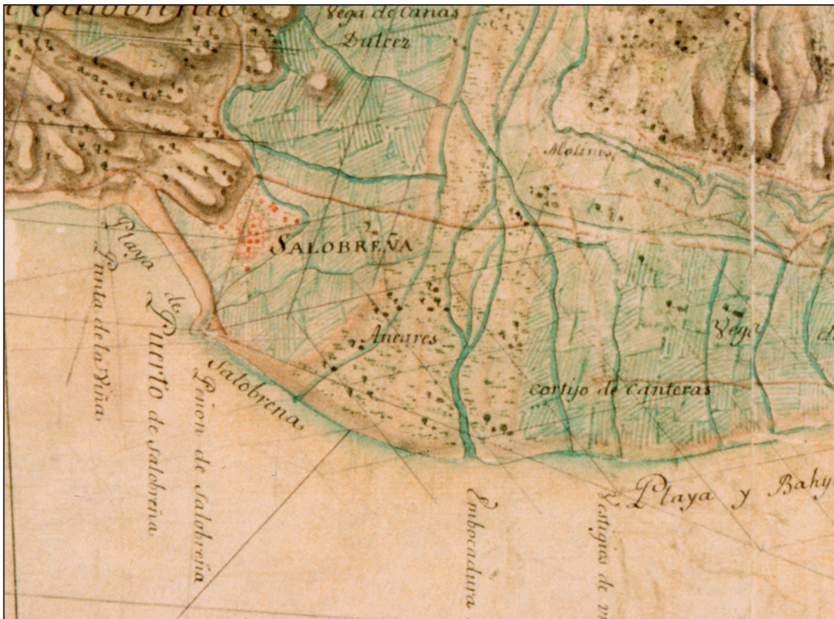
FIGURA NÚMERO 9.- FRAGMENTO DEL «MAPA DE LA COSTA DEL REYNO DE GRANADA DIVIDIDO EN SUS PARTIDOS DE ALMUÑÉCAR Y DE MOTRIL QUE COMPREHENDEN DESDE LA TORRE DE CERRO GORDO HASTA EL CAUTOR. ESCALA: 2 LEGUAS COMUNES DE UNA HORA DE CAMINO Y 2 LEGUAS COMUNES ESPAÑOLAS». POSIBLE FECHA DE DISEÑO: SIGLOS XVII-XVIII. 23

para el Rey moro de Granada. En este año, y ya por el mes de Agosto, deseando Boabdil recobrar algún puerto de los del Mediterráneo para poder recoger los socorros que esperaba de África, salió de Granada en son de guerra, cayó sobre la descuidada guarnición de Alhendín, e hizo suya aquella fortaleza y otros castillos que perdieran en el año anterior (y que conservó por poquísimo tiempo), y marchó decidido sobre Salobreña, confiando en la traición que le ofrecían los moros mudéjares que allí vivían y en la casual ausencia de su alcaide. Los mudéjares, acordándose de lo que habían sido y olvidándose del juramento de sumisión que habían prestado, facilitaron al Rey moro y a su ejército la entrada en la población, y ya sin obstáculo alguno pusieron cerco, y cerco