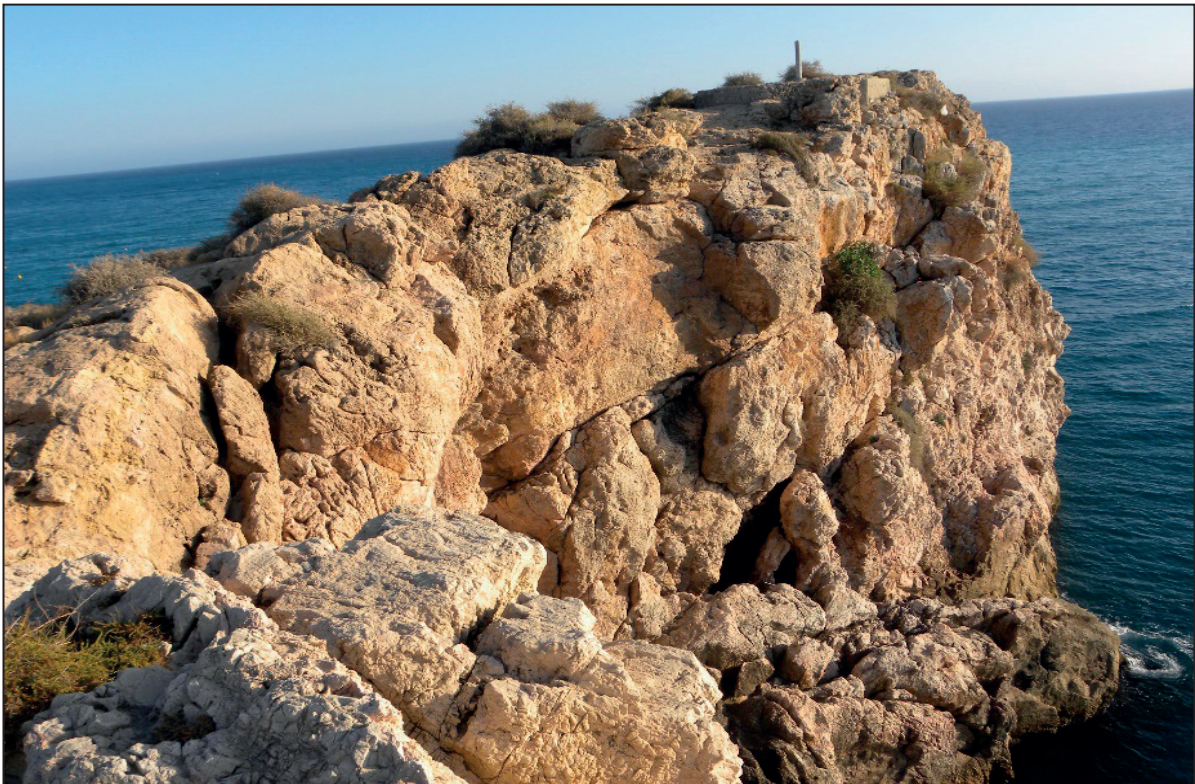
FIGURA NÚMERO 11.- ACANTILADO ORIENTADO AL O DEL PEÑÓN DE SALOBREÑA. Autor: José Ramón Sánchez Holgado.

Otras personas eligen su ascenso hasta el punto más elevado, al objeto de disfrutar de un fantástico paisaje costero junto a una extraordinaria panorámica de altura que le proporciona respecto al territorio más inmediato, especialmente en las últimas horas del día, siendo bien conocidas sus magníficas puestas de sol. Y finalmente otros aprovechan los salientes de las rocas, como el emplazamiento perfecto donde instalar sus cañas y artilugios de pesca, para emprender esta actividad deportiva, conocedores de la abundancia y de extraordinaria calidad gastronómica de los peces serránidos o también conocidos como peces de rocas.