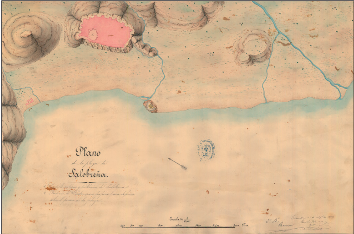
FIGURA NÚMERO 10.- PLANO DE LA PLAYA DE SALOBREÑA / EMILIO HERRERA Y OGEDA. E 1:6.000, AÑO 1857. 24

violentísimo, a la fortaleza, que no tenía por entonces la defensa de su seguro guardador y que comenzaba a sufrir los horrores del hambre y de la sed, aislada por completo del resto de los moradores de la villa. Grandes esfuerzos se hicieron para que los cristianos de las inmediaciones pudieran socorrer con presteza a los que sufrían encerrados y sitiados en la fortaleza de Salobreña. Pero todo fue en vano. Era tan estrecho y tan numeroso y compacto el cerco de los moros que le fue imposible socorrerles.