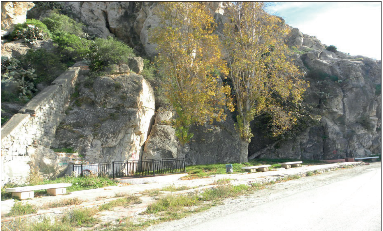
FIGURA NÚMERO 19.- POSIBLE LOCALIZACIÓN DEL EMBARCADERO DEL GAMBULLÓN, UTILIZADO POR LAS EMBARCACIONES DE LA ÉPOCA, PARA LA APROXIMACIÓN AL CASTILLO DE SALOBREÑA. Autor: José Ramón Sánchez Holgado.

A continuación se añaden cuatro fotografías que permiten asentar algunas de las propuestas recogidas anteriormente y que confirman la posibilidad de elaboración de una oferta cultural de temática histórico defensiva de la costa, posiblemente más completa y atractiva donde además de la visita al castillo de la localidad, se incluiría la alternativa de continuidad con la materia informando de la prolongación primeramente al antiguo Embarcadero del Gambullón, desde donde se divisa con facili-