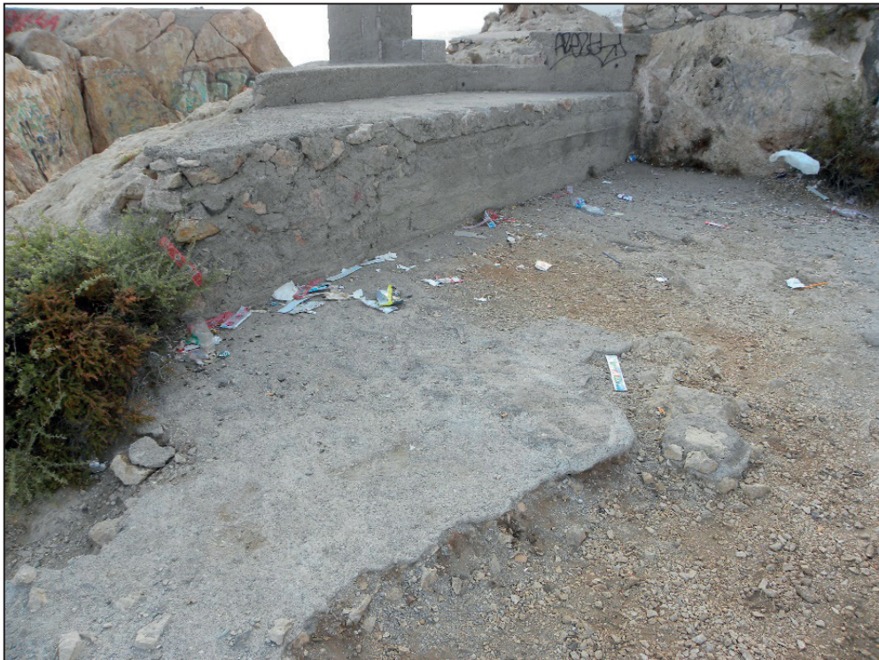
FIGURA NÚMERO 16.- LOS RESIDUOS ORGÁNICOS SE ACUMULAN, OFRECIENDO UNA IMAGEN POCO DESEADA PARA ALCANZAR UN TURISMO DE CALIDAD.