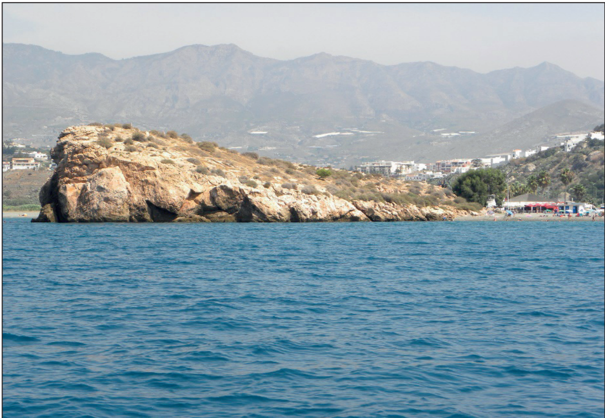
FIGURA NÚMERO 12.- VERTIENTE ORIENTADA AL E DEL PEÑÓN DE SALOBREÑA. Autor: José Ramón Sánchez Holgado.

Para desarrollar cualquier proyecto o intervención sobre el peñón de Salobreña, sería necesario disponer, a priori, de la colaboración mediante las autorizaciones preceptivas, de al menos el Ministerio Agricultura, Alimentación y Medio Ambiente, a través de la Dirección General de Sostenibilidad de la Costa y del Mar; de la Consejería de Cultura, de la Comunidad Autónoma de Andalucía y del propio Ayuntamiento de Salobreña. La situación actual del peñón se podría definir en una hipotética «inactividad indefinida», motivado en parte por la complejidad que supone el desarrollo de cualquier iniciativa, surgiendo de la imperiosa necesidad