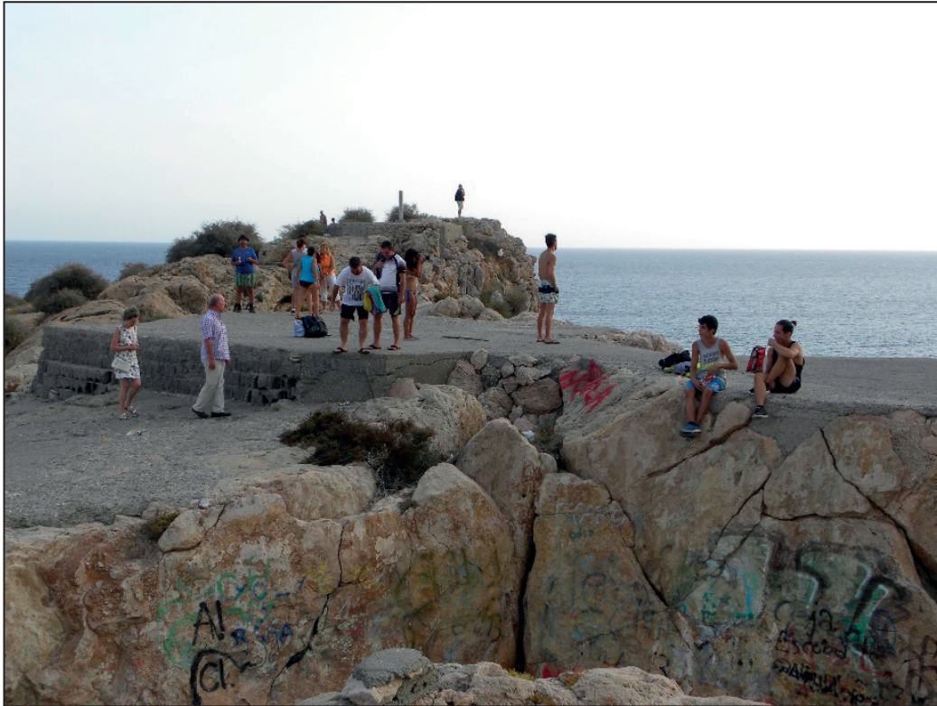
FIGURA NÚMERO 14.- LA FUERTE PRESIÓN HUMANA A QUE SE SOMETE EL PEÑÓN, ESPECIALMENTE DURANTE LA TEMPORADA VERANIEGA, PUEDE ORIGINAR DAÑOS IRREVERSIBLES. Autor: José Ramón Sánchez Holgado.

En la actualidad, ante la dificultad de restringir el paso y al no disponer de control alguno de las personas que acceden, ni de las actividades que se desarrollan en su interior, el posible deterioro que sigue sufriendo el peñón de Salobreña resulta progresivo y que de no prever una intervención inmediata, puede que al menos, los daños a los abundantes restos cerámicos que todavía se conservan en superficie, alcancen un resultado definitivo poco favorable.