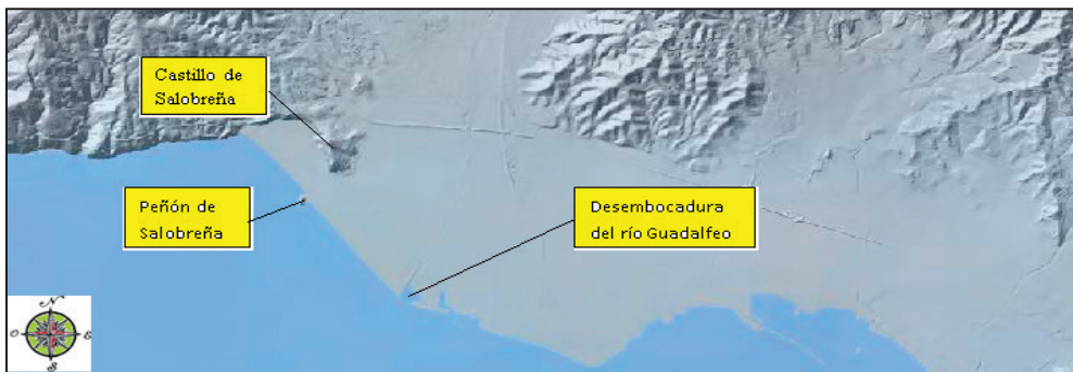
FIGURA NÚMERO 6.- DESARROLLO DEL DELTA FAVORECIDO POR LA ACCIÓN CONTINUA EN EL DEPÓSITO DE SEDIMENTOS, CON OCASIÓN DE LA INCISIÓN Y ARRASTRE CONSTANTE DEL RÍO GUADALFEO JUNTO A LA ACCIÓN TEMPORAL DE LAS IMPORTANTES RAMBLAS DE MOLVÍZAR AL NO Y DE LAS BRUJAS, ÁLAMOS, PUNTALÓN Y VILLANUEVA AL NE.