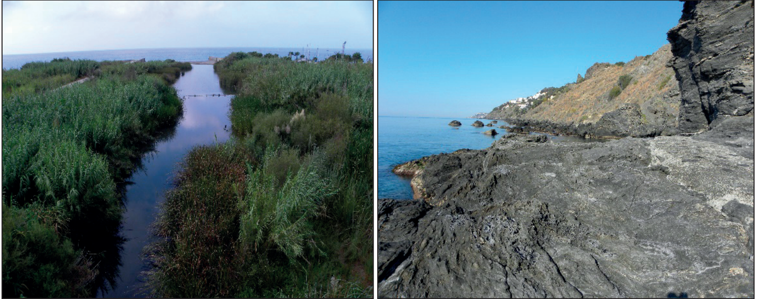
FIGURAS números 4 y 5.- DESEMBOCADURA DEL RÍO GUADALFEO. SU CAUCE SE ENCUENTRA REGULADO DESDE LA INAUGURACIÓN DURANTE EL AÑO 2004 DE LA PRESA ARQUEADA DEL EMBALSE DE RULES. EN LA IMAGEN DE LA DERECHA, ACANTILADOS DEL TESORILLO-SALOBREÑA.