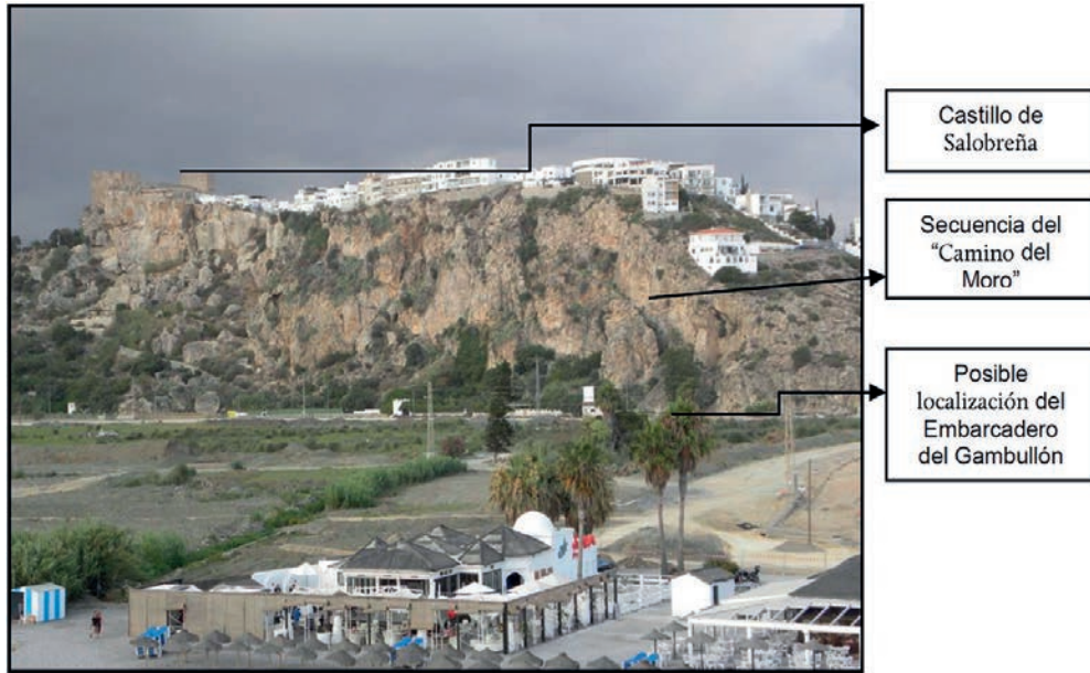
FIGURA NÚMERO 20.- SECUENCIA SEGUIDA A TRAVÉS DEL POPULARMENTE CONOCIDO COMO «CAMINO