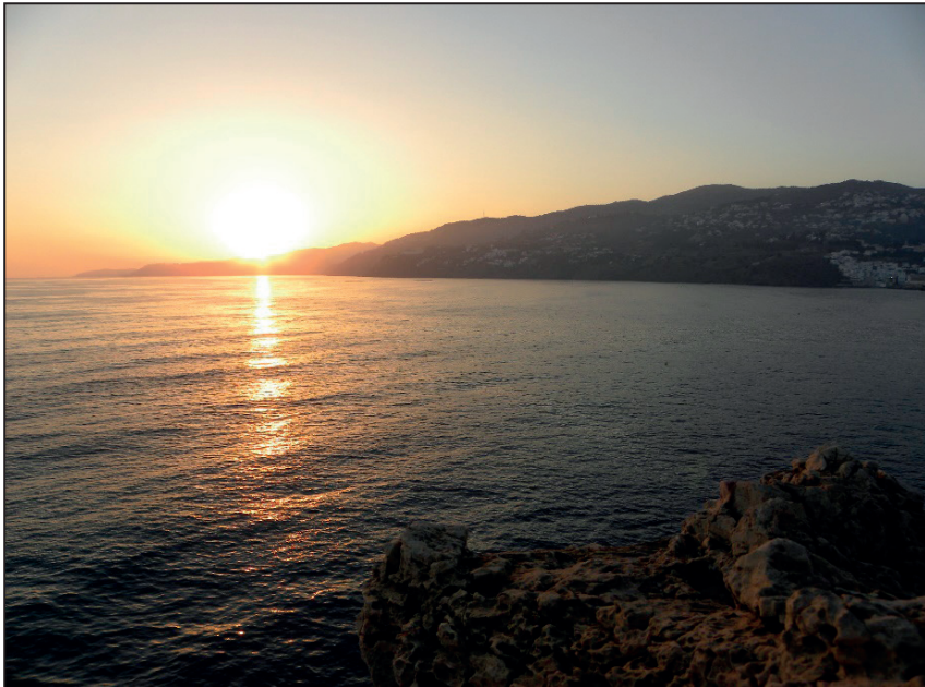
FIGURA NÚMERO 18.- PICTÓRICA PUESTA DE SOL DESDE EL PEÑÓN DE SALOBREÑA. Autor: José Ramón Sánchez Holgado.

Con el fin de realizar un estudio lo más exhaustivo posible como estrategia turística de futuro y haciendo uso de la herramienta de investigación que supone el empleo de una matriz DAFO, se realizará un análisis interno que comprenderá el desarrollo de las variables debilidades y fortalezas junto a otro externo con las variables amenazas y oportunidades.