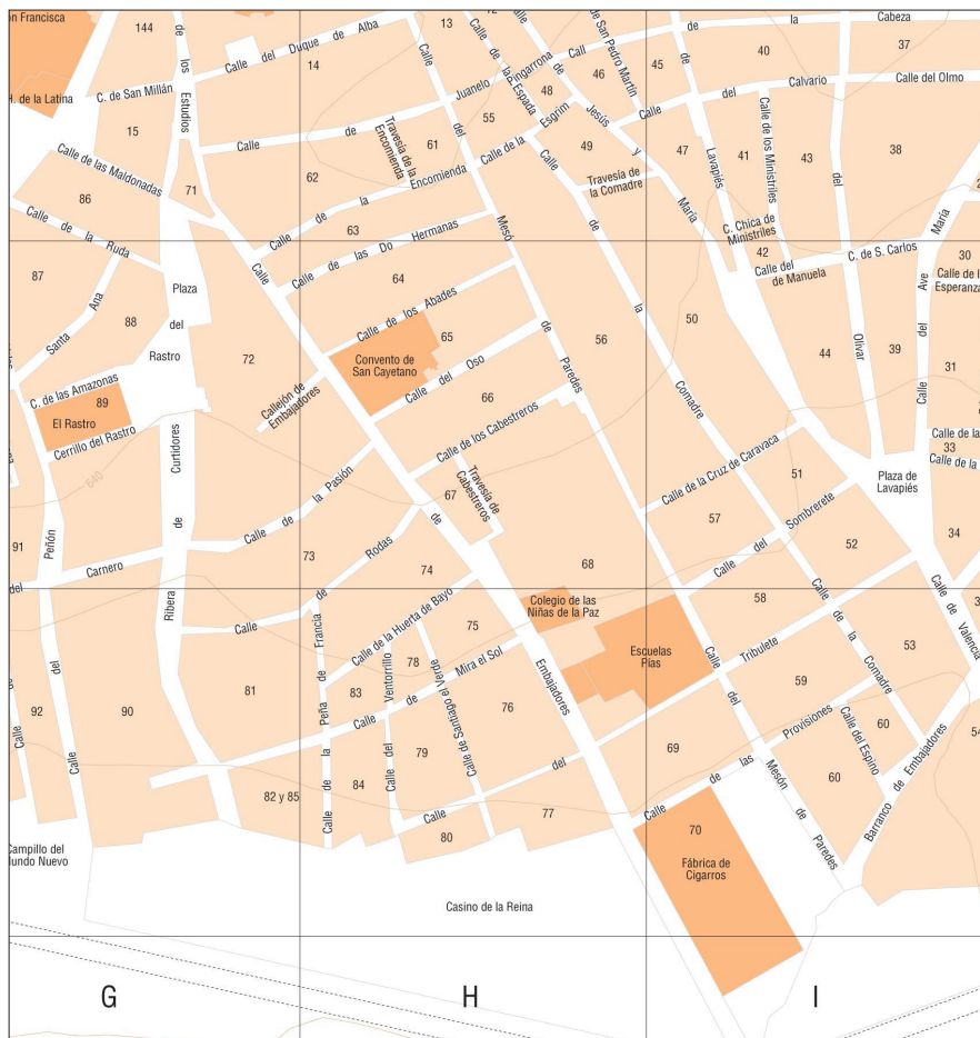
FIGURA 3. LA FÁBRICA DE TABACOS Y LOS BARRIOS ALEDAÑOS EN 1850.

Pero las trabajadoras no sólo residían en el barrio, sino que se insertaban en él a través de las redes de solidaridad y ayuda mutua tejidas en el espacio urbano. Desde la crianza de los hijos hasta el cuidado de los enfermos, pasando por las redes informales de microcrédito, la vida de las trabajadoras dependía de las relaciones de reciprocidad forjadas en el barrio 36 . Estas redes se trababan en los espacios de sociabilidad al aire libre, como la fuentequilla de la calle de Toledo, los lavaderos del Manzanares, el mercado de la plazuela de la Cebada, los merenderos