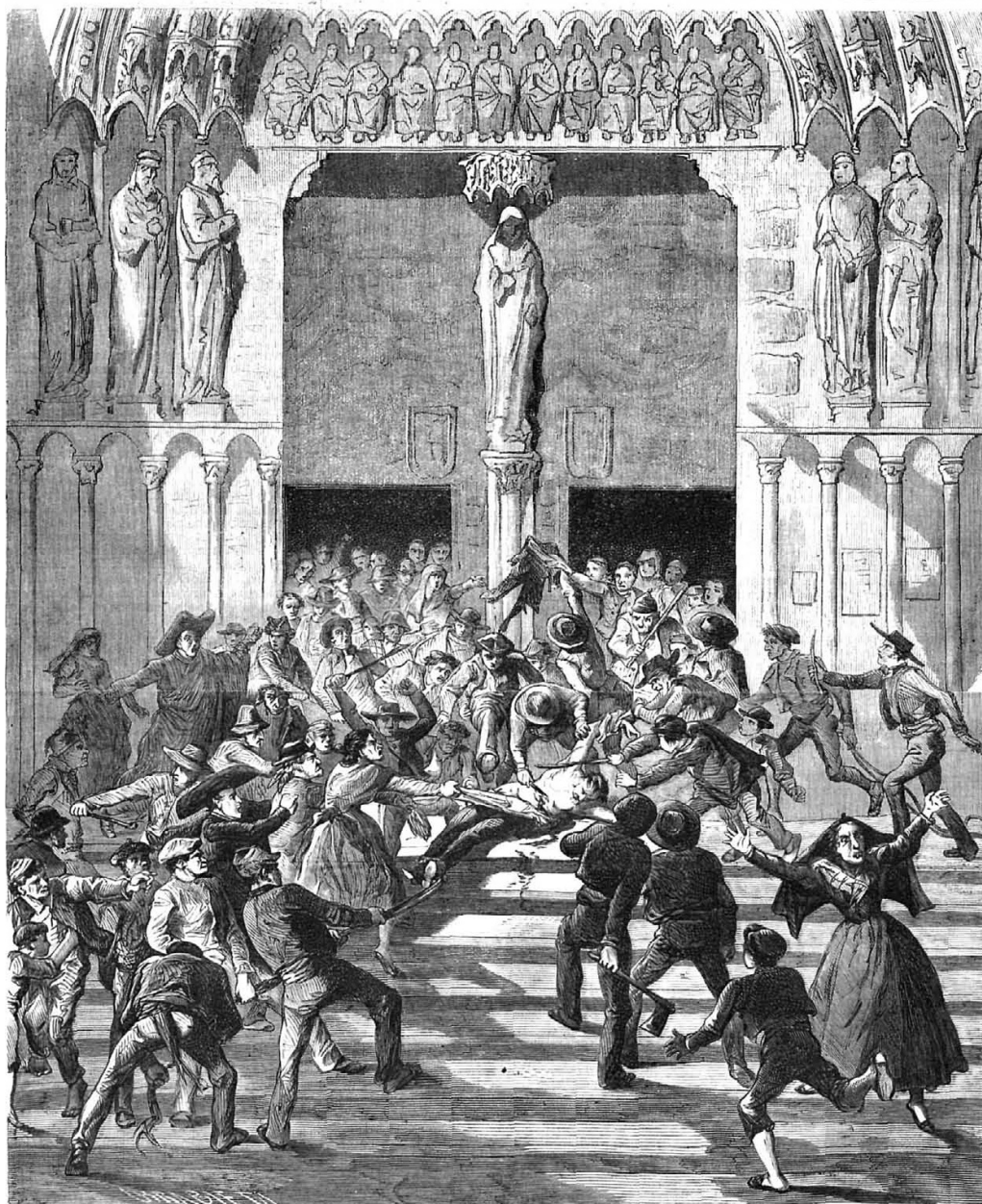
ESCENA DEL DRAMA DE LA CATEDRAL DE BURGOS.

EL ASESINATO DEL GOBERNADOR GUTIERREZ DE CASTRO EN LA CATEDRAL DE BURGOS, 25 DE ENERO 1869. Fuente: URRABIETA, Vicente: «Escena del drama en la catedral de Burgos», El Museo universal , 25/02/1869, p. 4