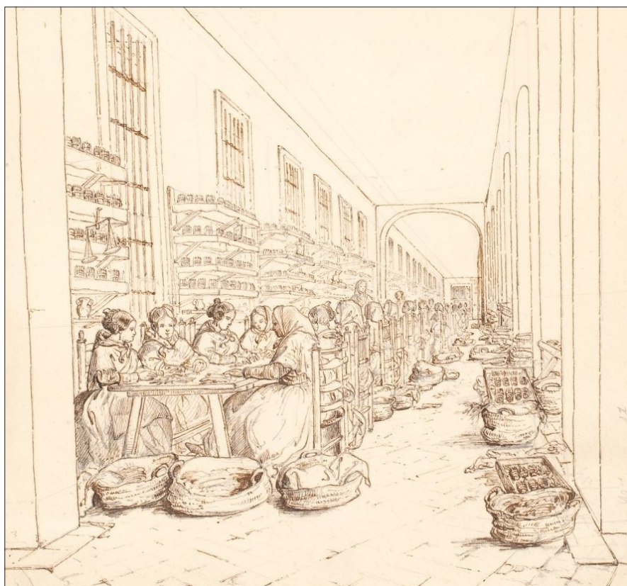
FIGURA 2. CIGARRERAS TRABAJANDO EN UNO DE LOS TALLERES DE LA FÁBRICA DE TABACOS DE MADRID. Fuente: Cecilio Pizarro, 1853. Museo del Prado

cunas o cajones que mecían con un pie mientras trabajaban 21 . Las madres de lactantes disponían de dos pausas de media hora para alimentarlos en el patio 22 . La dificultad de compatibilizar la jornada laboral con los cuidados provocó que en 1840 se estableciese una sala de lactancia, que permitía que las mujeres amamantasen a sus hijos en un entorno más adecuado. Poco después, debido al éxito de la iniciativa, se abrieron en la fábrica una escuela de párvulos y dos escuelas primarias, para niñas y niños 23 . Estas medidas fueron pioneras en España, pero su coste recaía sobre las trabajadoras. Cada madre debía pagar ocho cuartos por escolarizar a sus hijos, mientras que el conjunto de las trabajadoras aportaba seis cuartos por rancho en cada data 24 .