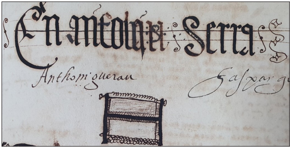
FIGURA 2. DIBUJO PARLANTE DE ANTONI SERRA.