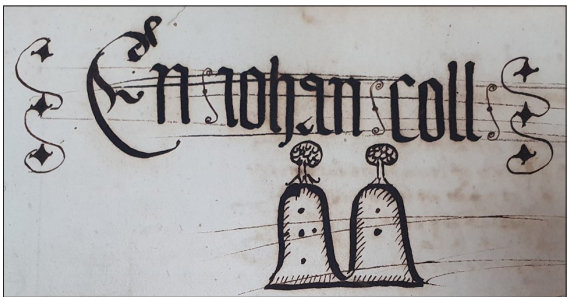
FIGURA 4. DIBUJO PARLANTE DE JOAN COLL.