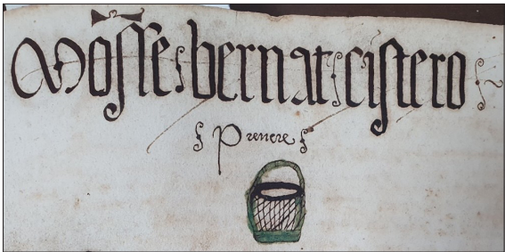
FIGURA 3. DIBUJO PARLANTE DE BERNAT CISTERÓ.