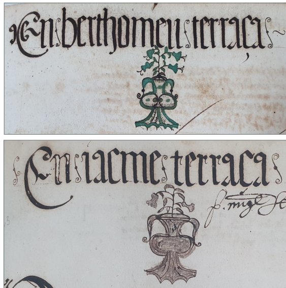
FIGURA 6. DIBUJOS PARLANTES DE BARTOMEU Y JAUME TERRASSA.