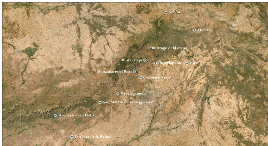
FIGURA 2. ITINERARIO DE LA EXPEDICIÓN ORGANIZADA POR EL REY DE CASTILLA PARA LA BÚSQUEDA DE MINAS EN EL SISTEMA CENTRAL. Base cartográfica Instamaps. Instituto Cartográfico y Geológico de Cataluña (ICGC)

de este espacio pudo influir tanto su cercanía al ámbito de desenvolvimiento de la corte itinerante, cuyos movimientos se limitaban cada vez más al espacio comprendido entre Toledo y Valladolid, como el carácter relativamente intransitado de algunos de estos lugares de montaña ahora explorados.