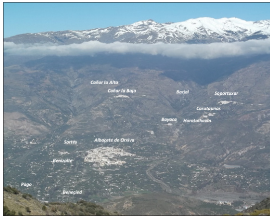
FIGURA 2: ALQUERÍAS DE LA ṬĀ'A DE ÓRGIVA A FINALES DEL SIGLO XV.

Por los servicios prestados a la Corona de Castilla durante la guerra de conquista del emirato nazarí de Granada y en posteriores campañas militares en Italia, los Reyes Católicos otorgaron este distrito en señorío a don Gonzalo Fernández de Córdoba, el Gran Capitán, y a sus sucesores. En la carta de merced dada el 26 de septiembre de 1499 se citan « la villa del Baçet de Orgiva, Sortis, Benialzalt, Pago y Besenied », ubicadas en la zona meridional de la ṭā'a , y los lugares y alquerías de « Bayaca, Cartunas, Xabotaya, Barjal y Quier », situadas en la zona montañosa del distrito 13 . En documentos del período morisco granadino, esos espacios poblados indicados en la donación se presentan dispuestos en torno a ambas orillas de la arteria fluvial principal del distrito, el río Chico. Durante este período se denominarán « Albaçete de Orgiva, Sortes, Beniçalte, Pago, Beneçied, Bayaca, Carataunas, Soportuxar, Barxal y Cañar ». Además, se constatan otras dos alquerías no mencionadas en esa merced y nombradas « Cañar la Baja » o