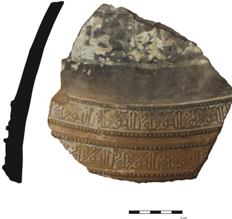
FIGURA 7. FRAGMENTO DE TINAJA ESTAMPILLADA DE LA NUEVA CASA ABADÍA. DIBUJO: AUTORES.