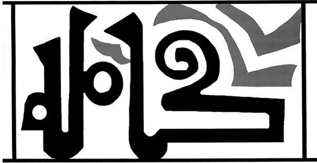
FIGURA 12. RECONSTRUCCIÓN DE LA ESTAMPILLA CON KĀMILA DE LA TINAJA DE EL PALAU. Dibujo: Carmen Barceló

Los objetos con estampillas en los que se usa este calificativo son abundantes; recordaremos los de Córdoba 64 , un trozo de tinaja encontrado en Buñol (SIAM), el borde de un brocal de pozo aparecido en excavaciones de 2015 en Cuatrovitas (Sevilla) 65 , un fragmento descubierto en Quesada (Jaén) 66 o un trozo amorfo de Almería 67 . La pieza descubierta durante excavaciones en el castillo de Buñol 68 muestra esta misma palabra y también con una letra mīm en el centro de la banda epigráfica, aunque el resto de los trazos no sea coincidente con los signos del sello que nos ocupa.