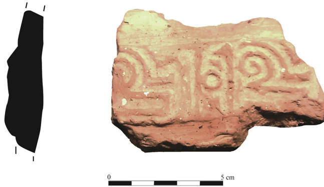
FIGURA 11. FRAGMENTO DE TINAJA DEL YACIMIENTO DE EL PALAU.

Está decorado con estampilla; conserva parte de una cinta con restos incompletos de dos improntas consecutivas, realizadas con un único sello que llevaba tallado el adjetivo kāmila 'completa'. Es posible que hubiera en la misma pieza, que pudo ser una tinaja o también un brocal de pozo, una banda paralela en la que se repetiría el término baraka 'gracia divina' y juntas formarían la conocida expresión árabe baraka kāmila , presente en todo tipo de objetos desde épocas mucho más antiguas.