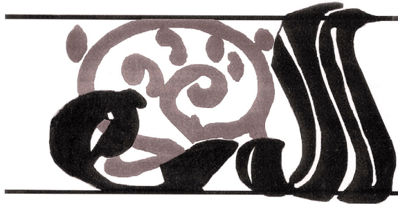
FIGURA 6. JARRITA DE LA CALLE MAYOR 26. MOTIVO EPIGRÁFICO AL-MANN EN LA FRANJA INFERIOR. Dibujo: Carmen Barceló

En origen, repetía seis veces al-mann 'el don', tres a cada lado de las asas; actualmente solo se conservan cuatro. Esta palabra no había sido recogida hasta fechas recientes en ningún repertorio de las expresiones que se leen sobre la cerámica andalusí 41 , por lo que se podría pensar que se trata simplemente de una mala grafía del muy repetido término al-yumn 'la fortuna', con omisión de un signo. Pero dicha palabra está también en otras piezas, lo que apoyaría que aceptemos la propuesta de interpretar los trazos como al-mann . Se ve en el cuello de una jarra esgrafiada encontrada en la calle San Nicolás de Murcia 42 . En las excavaciones de 2009 realizadas en el solar de l'Almoina de Valencia se halló una jarrita esgrafiada en cuyo cuello figura repetido al-mann (SIAM I/160) 43 .