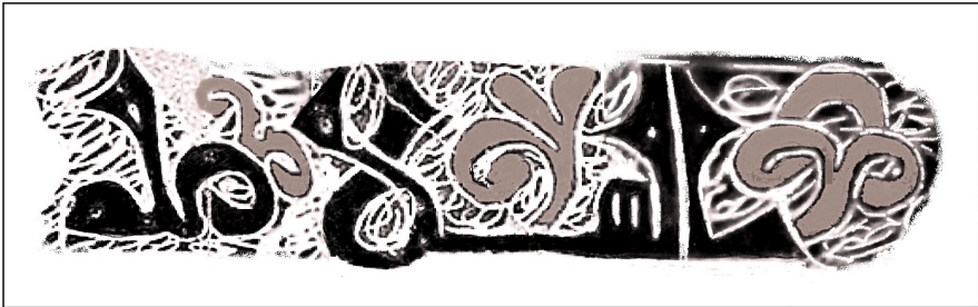
FIGURA 2. JARRITA DE LA NUEVA CASA ABADÍA. FRANJA EPIGRÁFICA EXTERIOR CON AL-SALĀMA . Dibujo: Carmen Barceló

La franja epigráfica exterior se sitúa en una banda que corre alrededor de la boca de la vasija; las letras son negras y dicen dos veces al-salāma 'el bienestar' (Figura 2). El estilo de letra cúfica corresponde a un tipo que empieza a verse a mediados del siglo XII bajo dominio almohade; presenta sus rasgos característicos: en los ápices de la parte superior de las letras altas, del nexa lām-alif y de la tā' marbūta hay un engrosamiento triangular, con el centro hueco. Entre el final de la palabra repetida y el principio de la otra tiene los adornos vegetales particulares de este periodo. El mismo término árabe, con una epigrafía cúfica coetánea, se ve en la jarrita con dos asas, pintada y esgrafiada, que apareció en las excavaciones de l'Almoina de Valencia, donde estuvo ubicado el alcázar de los gobernadores (SIAM 1/713) 30 . La misma palabra al-salāma , pero en grafía cursiva, se ve en un fragmento de panza de jarrita hallado en la ciudad de Murcia 31 .