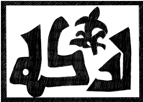
FIGURA 8. INSCRIPCIÓN VIDRIADA CON BARAKA EN LA TINAJA DE LA NUEVA CASA ABADÍA. Dibujo: Carmen Barceló

El siguiente fragmento cerámico corresponde a una tinaja que proviene de la excavación de la nueva Casa Abadía, al igual que la pieza 2.1. antes comentada. Dimensiones: altura conservada de 15 cm; ancho conservado de 17,5 cm (Figura 7).