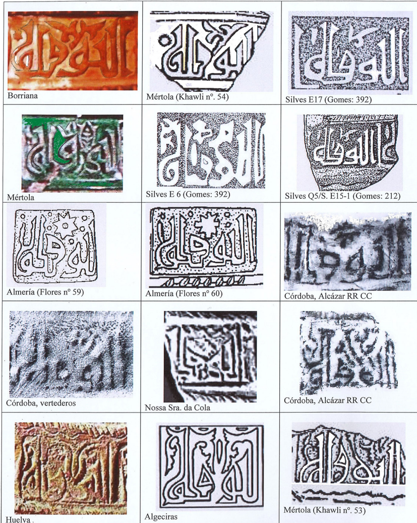
FIGURA 10. EL MOTIVO AL-TAWFIQ EN TINAJAS ESTAMPILLADAS. Elaboración: Ana Labarta

diseño era dejar espacio al cuerpo inferior de wāw , que en otros modelos quedaba oculto por el marco 55 .