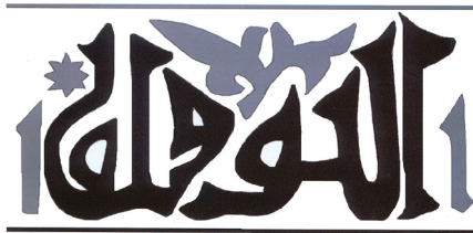
FIGURA 9. ESTAMPILLA CON AL-TAWFĪQ DE LA TINAJA DE LA NUEVA CASA ABADÍA. Dibujo: Carmen Barceló

En el diseño del cuño de Borriana es de reseñar que el signo de la letra yā' tiene igual altura que los dos trazos del artículo inicial, lo que constituye una anomalía en este tipo de escritura pero que observamos se produce de manera sistemática en esta palabra en todos los ejemplares de estampilla conocidos que la contienen, lo que implica un modelo inicial de prestigio con estas características (Figura 9).