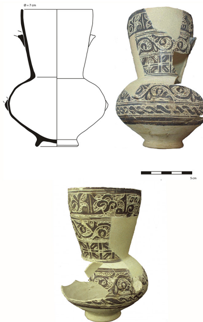
FIGURA 1. JARRITA ESGRAFIADA DE LA NUEVA CASA ABADÍA.

Tiene cuerpo de tendencia globular, pie anular pequeño y dos asitas afrontadas. El borde sigue la dirección de la pared, con labio apuntado y cuello alto troncocónico invertido. Se ha elaborado con pasta clara de tonalidad ocre-blancuzca. Dimensiones: diámetro del borde de 7 cm, diámetro de la base de 4 cm, altura de 14,2 cm.