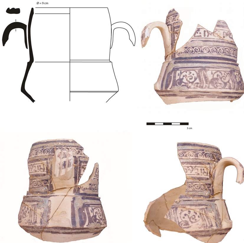
FIGURA 4. JARRITA DE LA CALLE MAYOR 26.

que comienzan y acaban en las dos asas; están enmarcadas por bandas de roleos esgrafiados y verdugones de vedrío azul turquesa (Figura 5). Por ahora no hemos sabido descifrarla.