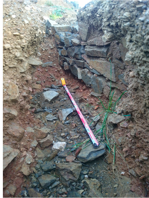
FIGURA 7. MURO PERIMETRAL DE VIVIENDA RECIENTEMENTE DESCUBIERTO BAJO LAS CÁRCAVAS.

Desde luego, el fuerte aumento demográfico iniciado ya desde época almohade producirá cambios significativos en la capacidad productiva de muchas zonas