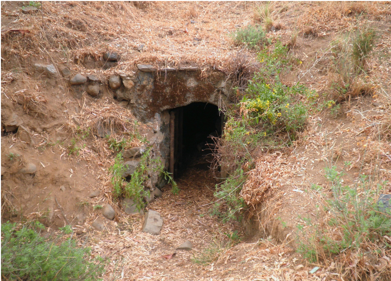
FIGURA 8. DETALLE DE LA MINA DE DRENAJE SITUADA BAJO EL DESPOBLADO.

La superficie irrigada se encuentra regulada por dos albercas rectangulares de gran tamaño, cuyas dimensiones distan mucho de las que hemos documentado