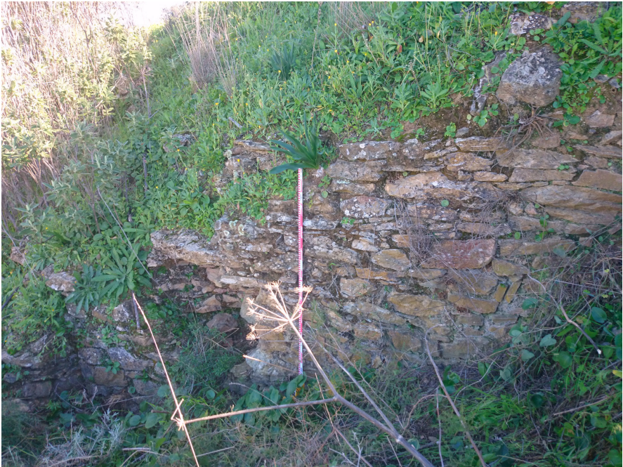
FIGURA 3. RECINTO AMURALLADO DEL CERRO DEL ALJIBE, ALZADO Y ARRANQUE DE TORRE.