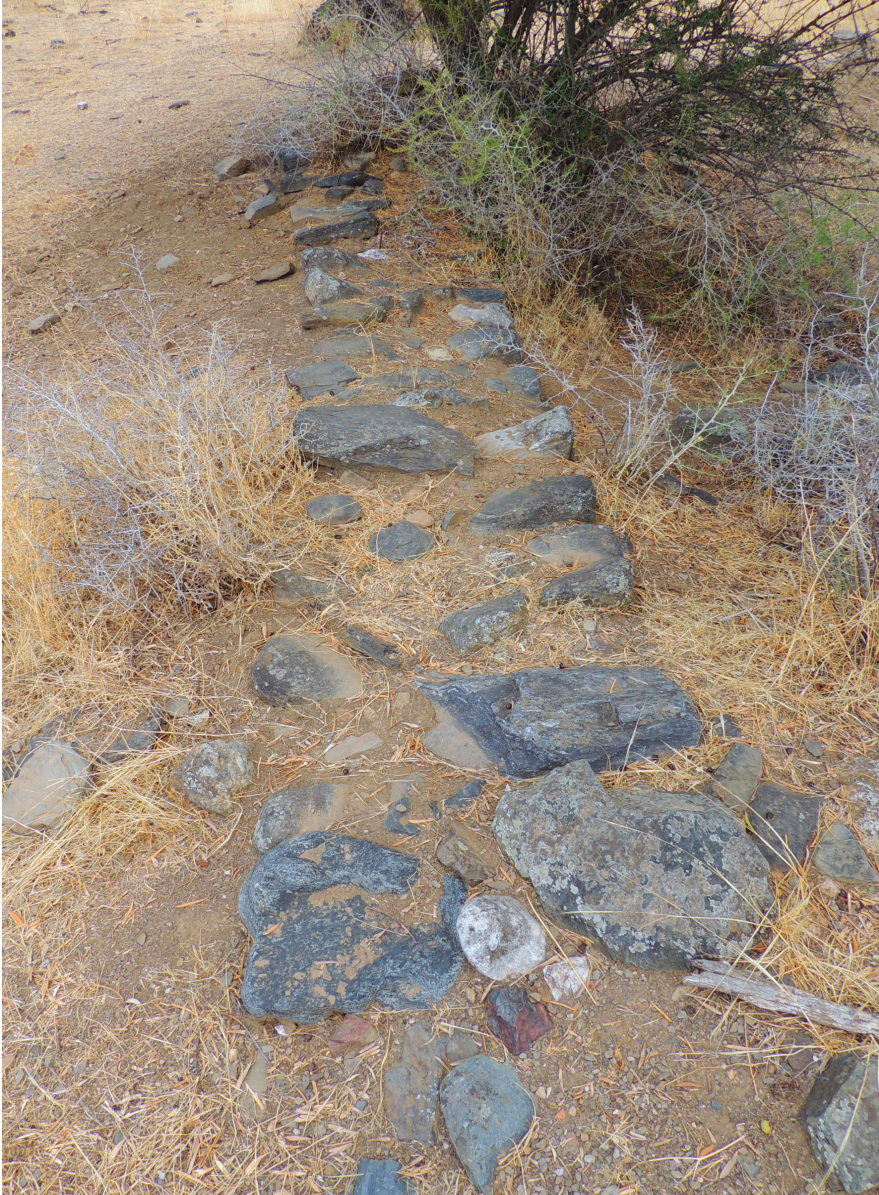
FIGURA 4. HILADA A RAS DE SUELO DE ESTRUCTURA INMEDIATA Y VINCULADA A LA POSIBLE TORRE.

no parece claro que el despoblado estuviera amurallado, en tanto que la estructura carece de consistencia, tampoco se distinguen zapatas o ángulos rectos que cierren, ni siquiera guarda correspondencia en el extremo opuesto. No obstante se necesitaría un análisis estratigráfico para concretar su funcionalidad; pues la