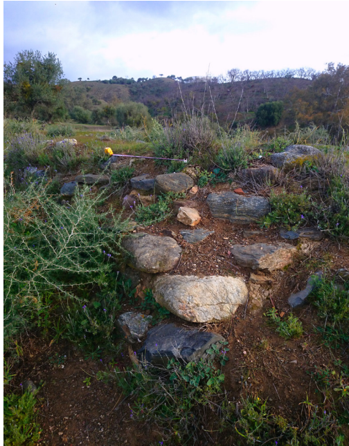
FIGURA 5. CIMENTACIÓN DE POSIBLE TORRE DEFENSIVA.