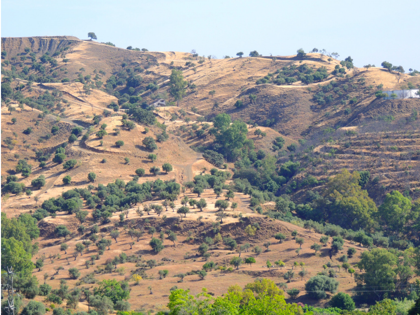
FIGURA 6. PANORÁMICA DEL ESPACIO HABITADO, IMAGEN AÉREA CAPTADA MEDIANTE DRONE.

cierre, que guarda simetría con respecto a la estructura antes descrita, pudiendo existir comunicación interna entre ambas unidades de habitación.