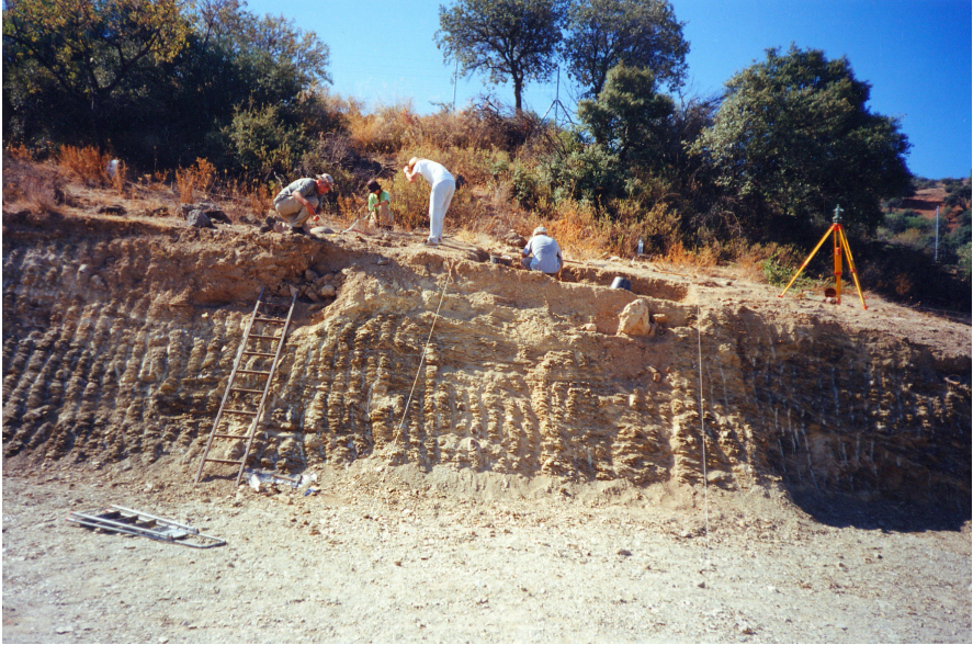
FIGURA 2. EXCAVACIÓN DE ESTRUCTURAS MEGALÍTICAS SITUADAS BAJO LA NECRÓPOLIS BAJOMEDIEVAL DE LOS VILLARES DE ALGANE.