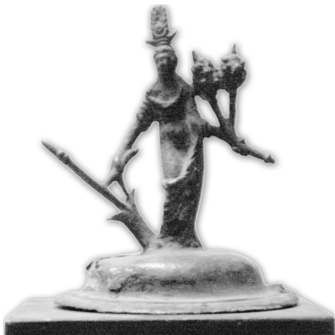
Fig.15. Tapa bronce Fortuna Pompeya o Herculano M.A.N.

Con la misma utilidad que la anterior figura podemos destacar la Fig. 17. Se trata del Arca Ferrata o Aerata , de Turiaso, Tarazona, ubicada en el Museo Provincial de Zaragoza. Este arcón de madera fue recubierto por una placa de bronce y después fueron añadidas diferentes placas, con las representaciones figurativas, en hierro con relleno en plomo. Este objeto fue encontrado en una piscina que se utilizaba para algún culto relacionado con las aguas. Al mismo tiempo se piensa que su función sería guardar dinero u objetos valiosos, al igual que la tapa anteriormente citada. De las tres representaciones principales, la relativa a Fortuna está situada en la parte central 26 .