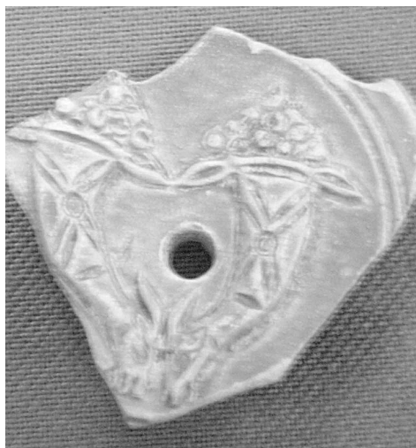
Fig. 12. Lucerna Cornucopias y Amaltea Cartagena.