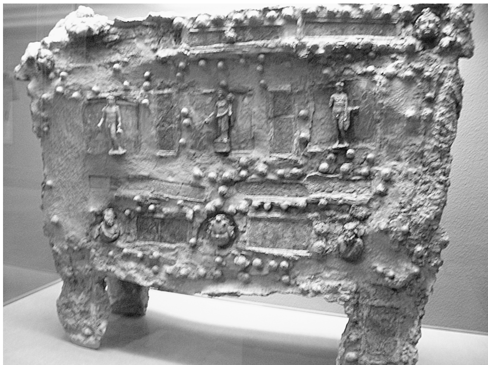
Fig.17 Arca Ferrata Tarazona. Museo Provincial Zaragoza.

oro, llevan la talla de la diosa Fortuna con sus atributos principales, es decir, el cuerno de la Abundancia y el timón. En algunos de ellos, el relieve de la diosa se sitúa en una piedra preciosa (como diamante o gema), la cual va engastada en una pieza de oro.