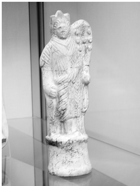
Fig.01. Terracota Fortuna Colonia.

Tenemos, dentro de las fuentes escritas, información relativa al rito de iniciación del culto místico de Isis. Apuleyo, en sus Metamorfosis o Asno de Oro (Libro XI, 23), habla por boca de su protagonista Lucio y nos relata como éste se inicia en el culto de la diosa. Pero en su obra se confunden ambas divinidades, Isis e Isis-Fortuna, y no llegamos a tener claro si el protagonista se pone al servicio de una o de otra. Esta iniciación se lleva a cabo mediante ritos de purificación por inmersiones y aspersiones de agua, seguidas de un riguroso ayuno. Posteriormente Lucio entrará al servicio de la divinidad, ritos secretos que no se puede relatar. Y es que el agua es un agente protector contra encantamientos, símbolo de la renovación de la vida, germen creador y forma parte de la iniciación de los ritos místicos. El bautismo o inmersión en agua representa regresar a ese estado de preexistencia, implica la muerte y la resurrección, pero dentro de una vida nueva, purificada. Este baño otorga una vida nueva, con nuevas fuerzas y vitalidad renovada y superior. Esta nueva fortaleza es espiritual, ya que el neófito ha podido vencer a la muerte y renace con vida nueva, abriendo una puerta hacia la inmortalidad 20 .