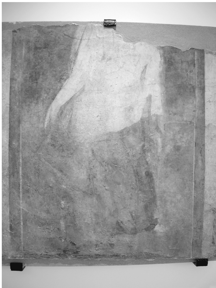
Fig.08. Fresco Fortuna Bilbilis (Caesaraugusta).

Este momento resulta ser el de mayor auge y popularización de nuestra divinidad por todo el territorio imperial. Fortuna se constituye como la gran protectora de las «clases medias», de pobres y esclavos, pero también de las clases aristocráticas, y es reproducida en todos los objetos cotidianos, en vajillas, estatuillas de culto o exvotos. Fortuna representaba para estos sectores más desfavorecidos de la población una oportunidad para mejorar socialmente y esperar «el golpe de suerte». El genio o fuerza del que es promotor la deidad guarda una protección a corto plazo que hace al dedicante portador de una posible felicidad inmediata. A través de pequeños exvotos o figurillas de culto, junto con aras votivas, el propietario busca un beneficio y el éxito de las acciones emprendidas a corto plazo.