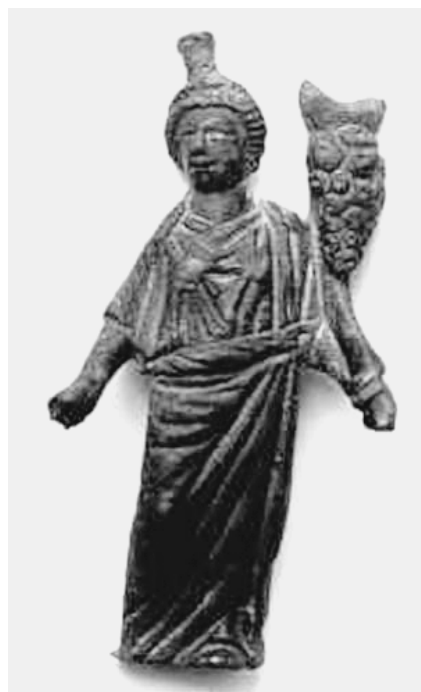
Fig.07. Bronce Isis-Fortuna Bosnia. Dalmacia.