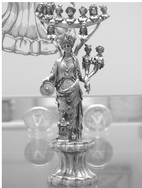
Fig.09. Plata-Oro Fortuna-Tutela Roma.