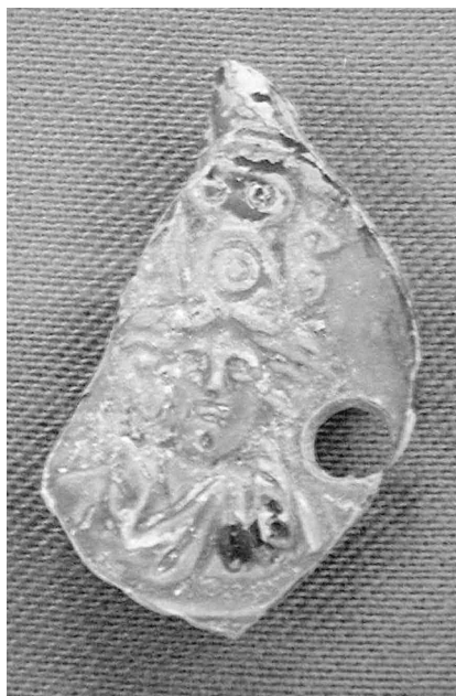
Fig. 13. Lucerna Isis-Fortuna Catagena.