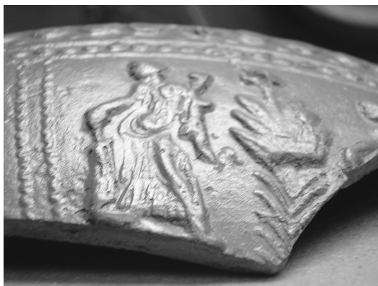
Fig. 14. Terra Sigillata Fortuna La Rioja. Museo Provincial Zaragoza.

En la parte inferior del disco figura de la cabra Amaltea, de cuyo cuerno sale un gran cuerno de la abundancia. Esta escena es repetida de forma simétrica. El diseño de la decoración de esta lucerna requiere por parte del taller cierta inquietud cultural. Este tipo de motivo no es muy repetido aunque encontramos otro ejemplo, esta vez se trata de una lucerna completa, en la ciudad de Córdoba, que se encuentra en el Museo Arqueológico de la misma ciudad 24 .