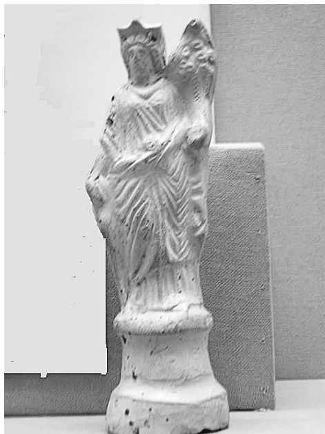
Fig.02. Terracota Fortuna Frankurt.