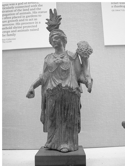
Fig.04. Bronze Minerva-Isis-Fortuna Roma.