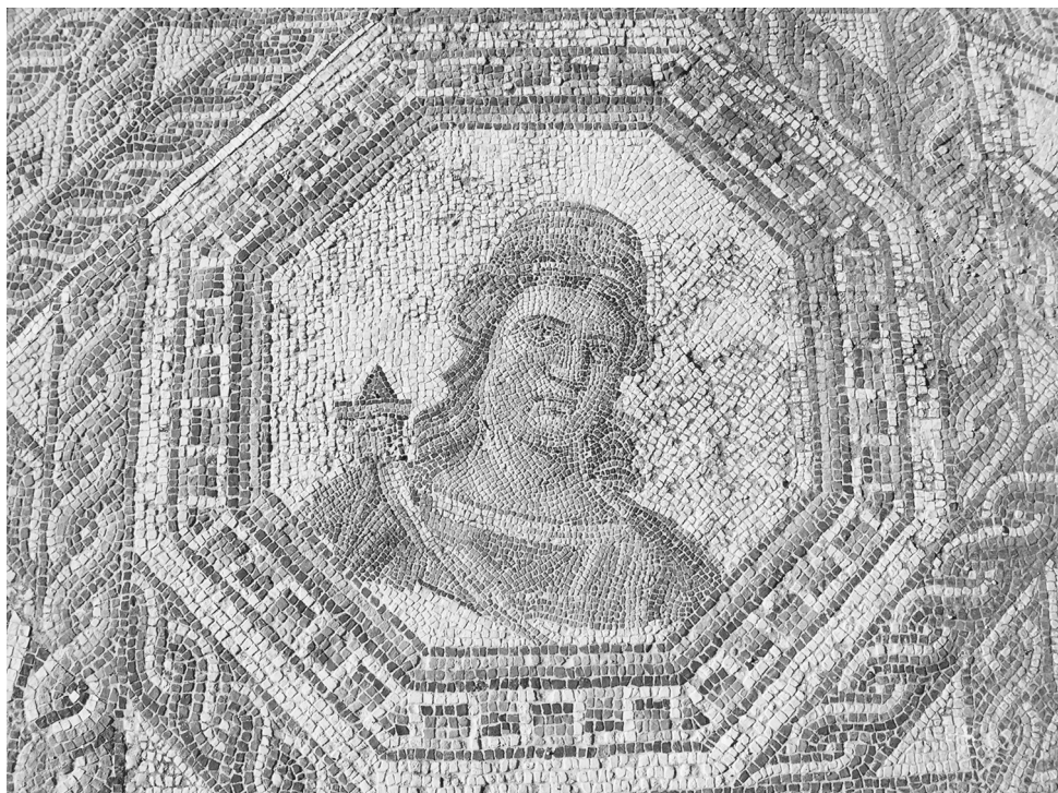
Fig.18. Mosaico. Villa Buñel Quesada (Jaén).

atributos habituales, Cornucopia y Timón) junto al dios Apolo. A simple vista estas representaciones son difícilmente identificables debido a su tamaño. Además de adorno, este tipo de elementos decorativos servían de amuletos o fetiches, que ayudan a su portador. En este caso, Fortuna y Apolo unirán sus fuerzas para favorecer al dueño del amuleto.