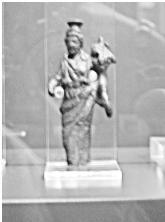
Fig. 16 Posible aplique bronce Fortuna Cartagena. Museo Murcia.

De la pieza expuesta en la Fig. 16, que se encuentra en el Museo Arqueológico de Murcia, procedente de Cartagena, tendríamos que destacar el agujero circular inscrito en su lado izquierdo, entre la cornucopia y su túnica. Al mismo tiempo podemos señalar el descuidado acabado de la parte posterior de la figura. Dicho lo cual, podíamos deducir que se trata, igual que en el caso de las figuras del Arca de Tarazona, de un posible aplique para algún objeto. Figura y objeto quedarían unidos mediante apliques metálicos como en el caso anteriormente estudiado 27 .