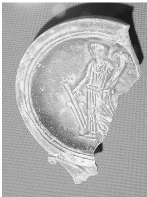
Fig. 11. Lucerna Fortuna Mérida M.A.R.

Lo mismo podríamos decir de los fragmentos de lucernas (Fig. 12 y13) encontradas en Cartagena, situadas en el Museo Arqueológico de la misma ciudad. En el primer caso nos encontramos ante dos representaciones enfrentadas.