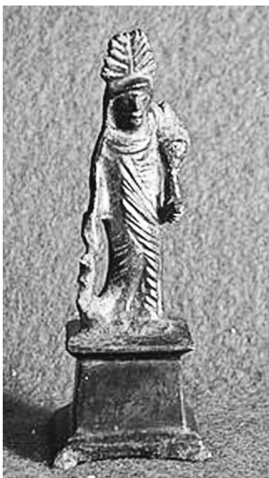
Fig.06. Bronce Isis-Fortuna.

Por encima de los dioses había una fuerza superior, un dominio al que no podían escapar, ésta era el Destino o la Fortuna. Así pues, el fatum romano u orden preestablecido que garantizaba Júpiter, y que gobernaba tanto a dioses como a hombres, debía someterse en numerosas ocasiones al capricho de la Señora del Destino o Fortuna que derogaba esas leyes que imprimen la razón o fatum , y participaba de aspectos mágicos y supersticiosos 21 . Dión de Prusa dentro de sus Discursos , tres de ellos dedicados a Fortuna, nos hace partícipes de esta idea ligando a Fortuna con la Fuerza Suprema a la que se le atribuyen los éxitos y fracasos de la vida del ser humano.