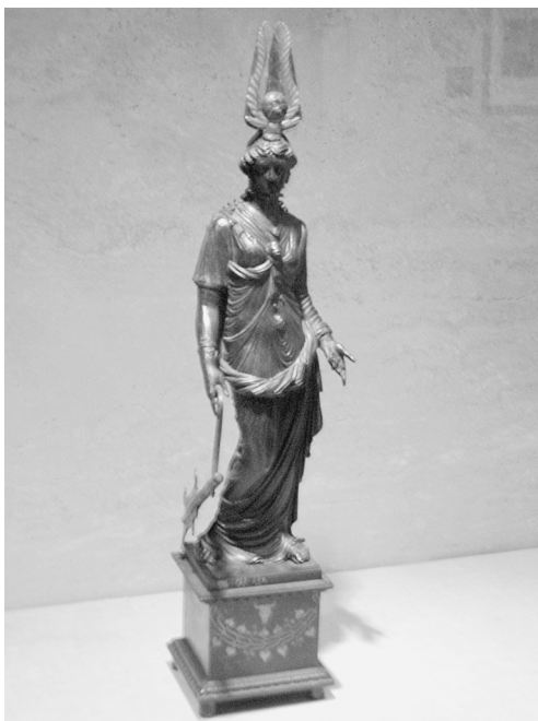
Fig.03. Bronze Isis-Fortuna Herculano.