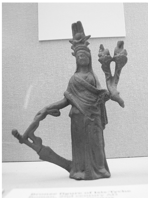
Fig.05. Bronze Isis-Fortuna Roma.