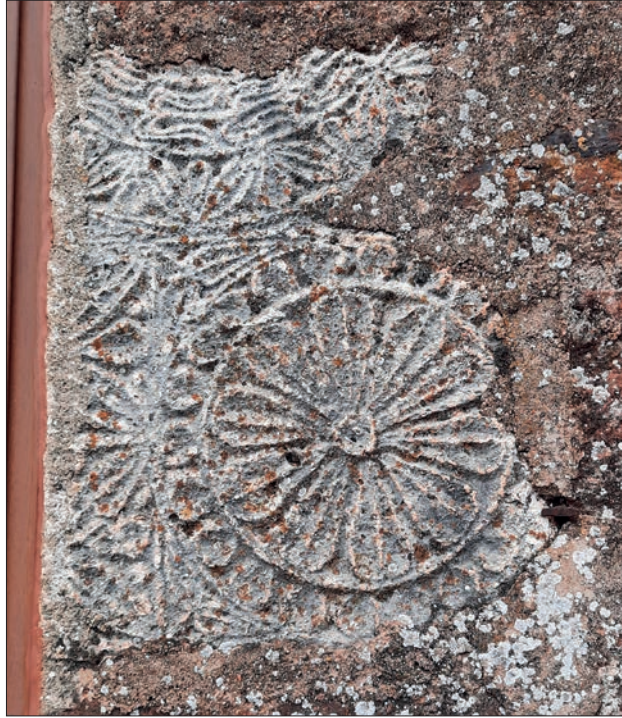
FIGURA 3. FRAGMENTO DE ESTELA ANEPIGRÁFICA. FACHADA DE UN DOMICILIO PARTICULAR DE REVILLA DEL CAMPO. Autor: Bruno P. Carcedo de Andrés

Destacan sobremanera los restos de lo que se adivina un exuberante programa iconográfico. Siempre en su disposición actual, en la parte superior se advierten dos cenefas que por su forma debieran estar rodeando algún elemento ornamental circular, quizás una rosácea o un disco de radios curvos. La exterior, de una anchura de 8,0 cm presenta una decoración basada en motivos vegetales, grupos de tres hojas, la central vertical y las laterales cada una apuntando hacia su lado, que se corresponde con el motivo 3A clasificado por Abásolo 6 . La interior, de una anchura asimismo de 8,0 cm, presenta un motivo vegetal diferente que semeja una rama con brotes o zarcillos y que tendría un paralelismo con el motivo que parecen contener las cenefas laterales, cortadas longitudinalmente al modificar la pieza, que se advierten en un ejemplar procedente de Iglesia Pinta ( ERLara 23).