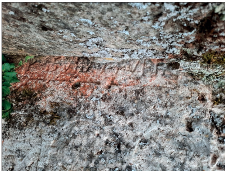
FIGURA 2. FRAGMENTO DE ESTELA CON DECORACIÓN. IGLESIA DE REVILLA DEL CAMPO. DETALLE DE LA INSCRIPCIÓN. Autor: Bruno P. Carcedo de Andrés

Finalmente, algo más separado, parece plasmarse al menos un carácter más, del que se distingue bien un asta vertical. Más complicado es estimar si este trazo o asta está sola y se trata de un carácter I o por el contrario, de nuevo, se trata de una letra T, F, P u otra. La parte superior tiene una ligera prolongación hacia la derecha, si bien es difícil de decir si es fortuita o no, puesto que enseguida queda oculta de nuevo bajo material constructivo. Más interesante es un leve trazo horizontal hacia la derecha, casi a la altura de la mitad del asta, que sugeriría que podría tratarse de un carácter F. Sin embargo, la altura a la que brota, se antoja excesiva y demasiado cercana al supuesto brazo superior. Más aún, en la parte inferior surge una especie de panza similar a la de la B pero abierta, que parece casual, pero cuya aparente claridad, plantea dudas sobre los otros presuntos trazos del carácter.