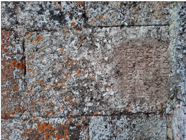
FIGURA 5. FRAGMENTO DE ESTELA SIN DECORACIÓN. IGLESIA DE REVILLA DEL CAMPO. LIMPIADA. Autor: Bruno P. Carcedo de Andrés

centrales, que vista la forma de la N, parecería indicar la presencia de dos caracteres N o de un único carácter M, posibilidad ésta con más sentido y más razonable.