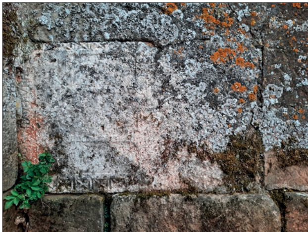
FIGURA 1. FRAGMENTO DE ESTELA CON DECORACIÓN. IGLESIA DE REVILLA DEL CAMPO.

por abrasión, extendiéndose unos 10,0 cm en esa dirección, de forma que no es posible determinar si, efectivamente, se trata de un indicio del travesaño de la A con continuidad en el rasguño, o un deterioro que recorriendo una parte del texto, llega hasta cortar ese trazo ascendente oblicuo dando la apariencia de parte de la letra A.