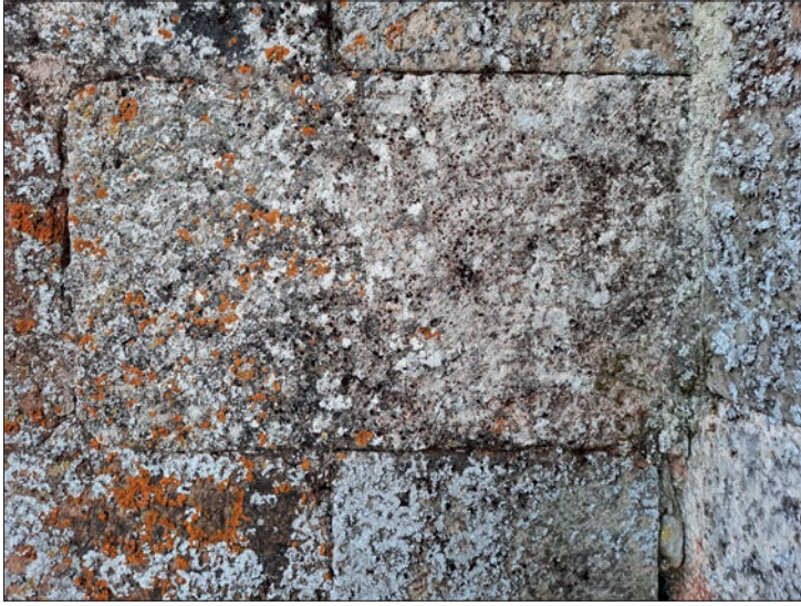
FIGURA 4. FRAGMENTO DE ESTELA SIN DECORACIÓN. IGLESIA DE REVILLA DEL CAMPO. Autor: Bruno P. Carcedo de Andrés

Conserva texto dispuesto en al menos cinco líneas, en caracteres de tipo capital cuadrado con tendencia rústica en algunos de ellos. La hechura es buena, al menos parcialmente y tienen una altura que varía entre 3,5 cm y 4,5 cm. El texto se encuentra dispuesto en un campo epigráfico rebajado de 32,5 cm de anchura