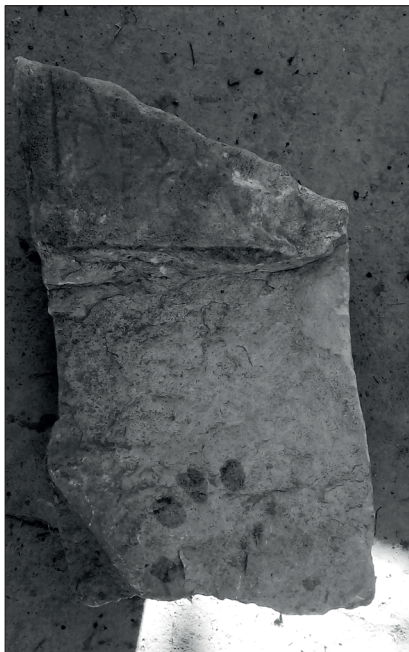
FIGURA 3. INSCRIPCIÓN DE AMBATA DES(S)ICA. Autor: (B. P. Carcedo de Andrés).