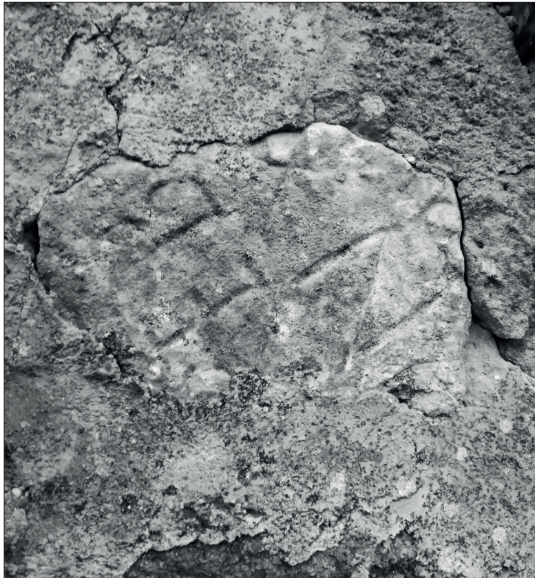
FIG. 2. INSCRIPCIÓN DE REB[---]. (Autor: B. P. Carcedo de Andrés).

La estela conserva restos de texto distribuido en al menos dos líneas, en caracteres de tipo capital cuadrado. Como rasgos de los caracteres a señalar, la E de L.1 es estrecha y la B no parece cerrarse. Dimensiones, L.1 5,0 cm y L.2 5,5 cm. Tras L.2 quizás sería posible advertir algunos trazos o marcas que, prácticamente coincidentes con la línea de rotura inferior, resultan de imposible determinación e interpretación, y pueden ser simplemente el resultado de alguna acción mecánica sobre la pieza, sobre todo teniendo en cuenta que su dirección no termina de casar bien con la tipología de los caracteres de esta inscripción. No hay, al menos en el texto conservado, constancia de nexos o interpunción y dadas las reducidas dimensiones del fragmento, no ha pervivido resto alguno de programa decorativo, en el caso de que pudiera haberlo habido.