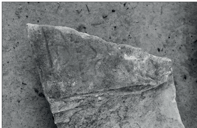
FIGURA 4. INSCRIPCIÓN DE AMBATA DES(S)ICA. DETALLE. (Autor: B. P. Carcedo de Andrés)

A pesar del daño sufrido y del notorio deterioro que la afecta, es posible apreciar restos de texto, muy erosionado y casi borrado, dispuesto en al menos tres líneas. Los caracteres son de tipo capital cuadrado y de unas dimensiones de L.1 4,0 cm y L.2 y L.3, 3,5 cm. La extensi3n de texto que ha quedado en el fragmento, no permite inferir la presencia de nexos, que de existir, habrían de darse en las derivaciones y flexiones de los antropónimos plasmadas en el volumen de la pieza perdido. Tampoco hay presencia de interpunciones, que de forma análoga, de existir habrían estado en el campo epigráfico desaparecido y circunscritos a L.3