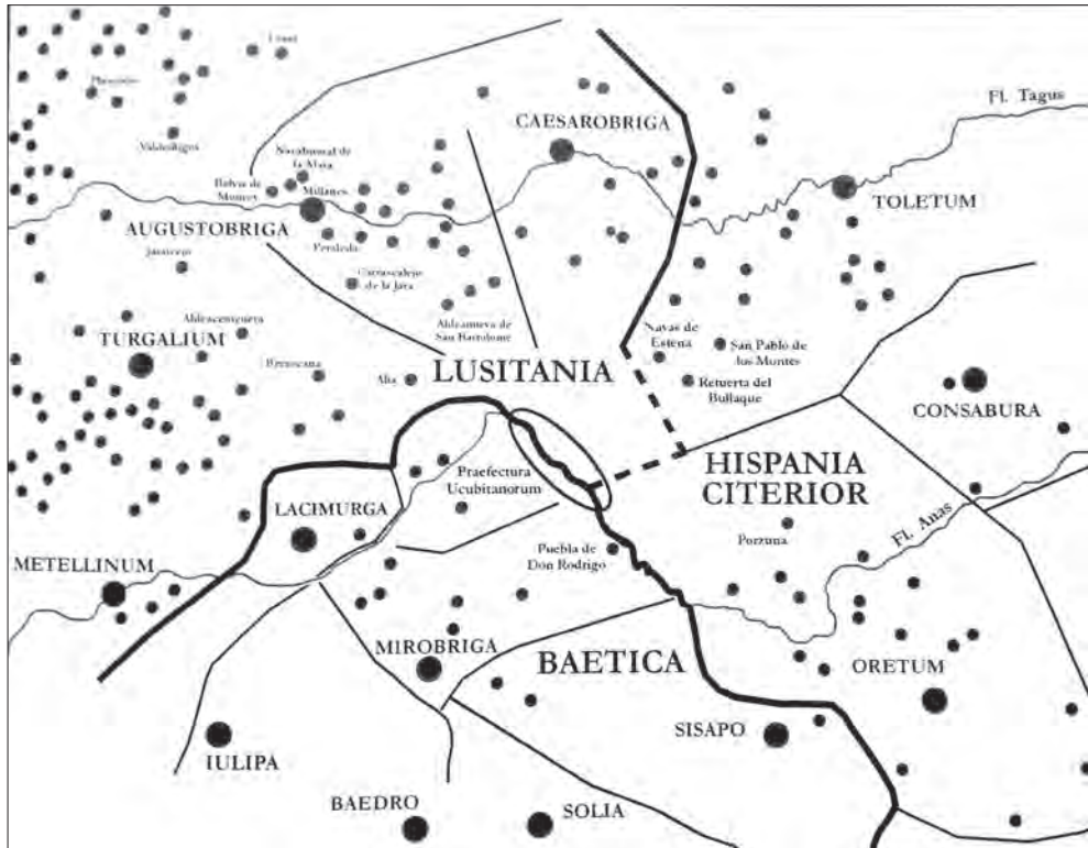
FIGURA. 10. MAPA DE J.M. ABASCAL, 2013 EN DONDE SE VEN LOS HALLAZGOS EPIGRÁFICOS DE LA ZONA.

lógicamente, más justificado el haberla incorporado en el conventus Cordubensis . Creo que la confusión por ser una ciudad procesariana, llevó a Plinio a crearla en la Baeturia celtica/conventus Hispalensis cuando en realidad se emplazaba en la Baeturia turdulorum/conventus Cordubensis . Esta confusión, de la que ya hablé, conlleva su erróneo emplazamiento administrativo. Trae una complicación, ya que F. Beltrán Lloris 93 indicó que los fallos de incorporación de determinadas ciudades que pertenecían al conventus Hispalensis en la Baeturia celtica podían justificar la idea de que Plinio manejase una lista conventual, aunque las complicaciones que conlleva Laci(ni)murga llevan a manifestar que, en este caso, no debió de ser así.