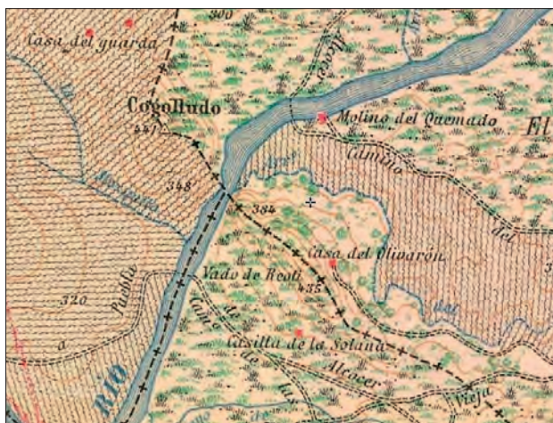
FIGURA. 9. IMTN50-1º EDICIÓN (1968). Iberpix.

se encuentran en Casas de Don Pedro dos menciones de origen que evidencian el punto de unión que fue esta zona: por un lado, una inscripción 85 que nos habla de Cosconia Materna, de origen bética y origen Mirobrigen[si] s. En la zona también se halla un epígrafe que alude a Macer Obisodico 86 , de origen citerior y origen Toleta(nus) . En esta zona también entran en juego los hitos que indicaban las prefecturas de Augusta Emerita y de Claritas Iulia Ucubi , junto a la compleja inscripción catastral ( forma ) mencionada anteriormente, cuestiones en las que no me puedo detener aquí 87 .