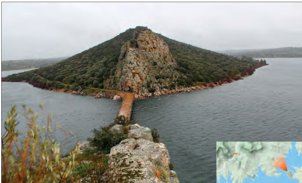
FIGURA 4. VISTA EN DIRECCIÓN SUR DESDE LO ALTO DE CERRO DE COGOLLUDO. AUNQUE DEBIÓ DE SER, IGUALMENTE EN LA ANTIGÜEDAD, ZONA DE HUMEDALES, ESTA VISIÓN SE DA POR EL EMBALSE DE ORELLANA Y SIERRA DE PELA.

Estos datos filológicos hay que ponerlos en contexto. Este topónimo apunta directamente a un origen turdetano. Si tenemos en cuenta la probada colonización tartésico-turdetana que se dio en el valle del Ana en torno al siglo VI a.C. y que, producto de ello, les llevó a fundar ciudades desde la desembocadura ( Baesuris ,