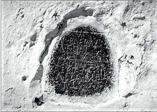
FIGURA. 8. IMAGEN DE LA INSCRIPCIÓN EE IX, 140. (Archivo digital de Hispania Epigráfica Online).

siquiera es segura. A. Canto, la única que da la lectura correcta como lag- , y no lac- , antes de ERBC había propuesto en HEp la posibilidad de Lag(obrigensis) , que tampoco parece que sea factible 80 . Posible es considerar un cambio de sorda / sonora (k/g), aunque parece difícil, ya que es curioso que, a pesar de la variabilidad del topónimo, todos los manuscritos, inscripciones y formas posibles conserven la raíz Lac- y no Lag- . Es difícil asumir como cierta la idea que se recoge de aquellos que asumen que hubo dos ciudades si miramos la epigrafía, porque la hipotética Laci(ni)murga de promoción cesariana no habría dejado registro epigráfico alguno más que una dudosa mención de origen, mientras que la Laci(ni)murga sin estatuto privilegiado hasta época flavia, expresa epigrafía geográfica desde principios del siglo I y se cita su topónimo, no en una sino en cuatro ocasiones.