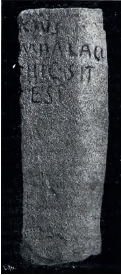
FIGURA 7. CIL II,2/7, 826 DE F. FITA (1912).

célticas, sería plausible pensar que habría servido de persuasión para incluirla en la lista de las célticas, a pesar de que su nombre no es céltico. Podría, incluso, haberse generado una confusión con la ciudad que porta los mismos cognomina , Osset , que está junto a Hispalis y pertenecía al mismo conventus iuridicus que las ciudades de la Baeturia celtica .