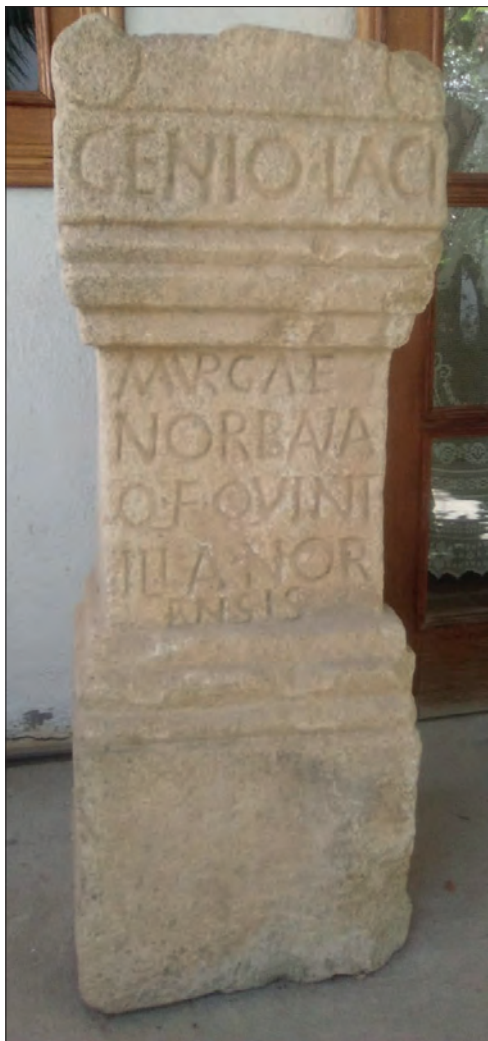
FIGURA 3. PEDESTAL DEL GENIO LACIMURGENSE.

y que pueden hacer alusión al mismo núcleo: Laci(ni)murga . Esa es la única opción que, a día de hoy, se puede aceptar.