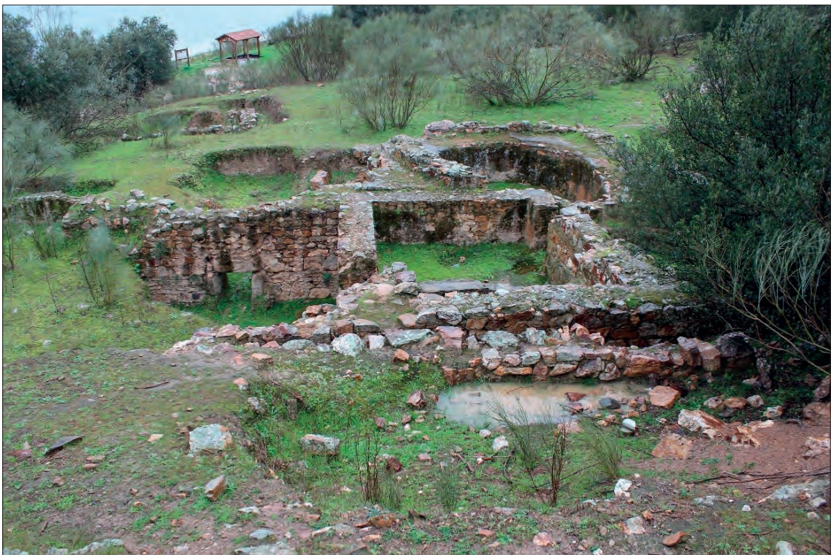
FIGURA 6. ESTRUCTURAS VISIBLES EN CERRO DE COGOLLUDO EN MARZO DEL 2016.