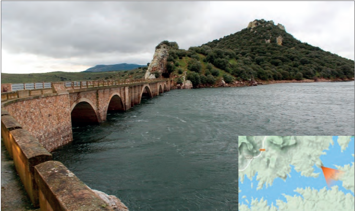
FIGURA 5. VISTA DE CERRO DE COGOLLUDO DESDE LA ORILLA IZQUIERDA DEL ANA. (Foto del autor).