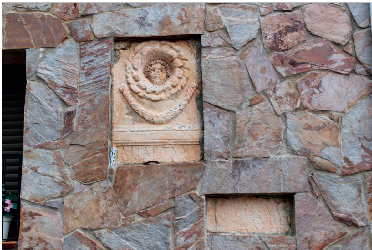
FIGURA 1: FRAGMENTOS DE LA ESTELA N.º 1.

El interés suscitado por la epigrafía latina procedente de la Colonia Clunia Sulpicia nos ha llevado a estudiar de nuevo algunas de las inscripciones latinas conservadas en Huerta de Rey, pueblo de la provincia de Burgos situado a tan solo ocho kilómetros al nordeste del yacimiento romano. Hasta allí se han ido llevando, desde época no bien precisada, no sólo piezas arquitectónicas, sino también inscripciones latinas. Un capitel corintio, por ejemplo, puede observarse aún empotrado en la fachada de la vivienda situada en la calle Dondovilla n.º 4 3 . Respecto a las inscripciones, DE PALOL – VILELLA publicaron ya varias 4 , pero una revisión detenida de las mismas nos ha impulsado a volver a editar dos de ellas 5 .