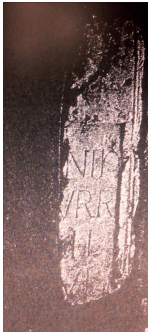
FIGURA 6: FRAGMENTO B DE LA ESTELA N° 2.

Por la foto podemos decir que tenía cabecera semicircular, decoración geométrica en la parte superior consistente en una rosácea; y una doble moldura rodeaba