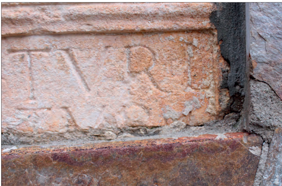
FIGURA 5: DETALLE DE LA E MINUTA DE LÍNEA 1.

mero juego visual, y tiene un punto superior agregado en época moderna. Los espacios interlineales son regulares, de 1,3 cm. Conserva líneas de guía. Los signos de interpunción tienen forma de molinillo con tres álabes.