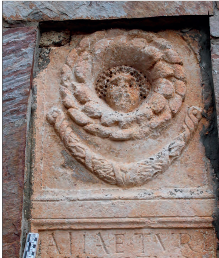
FIGURA 2: DETALLE DE LA CABECERA DE LA ESTELA N° 1.