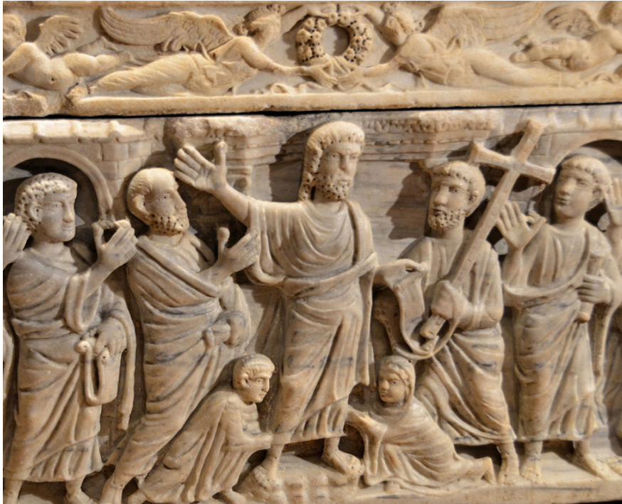
FIGURA 5.- SARCÓFAGO CON LA TRADITIO LEGIS . Catedral de Saint-Sauveur.

más adelante. La iconografía de Cristo en los sarcófagos con la Traditio Legis es muy diferente de la del Buen Pastor. El tema del Buen Pastor, imberbe y con el pelo rizado, vestido con traje corto, gozó de gran aceptación en la iconografía de Cristo, pero distinta de la seguida en el plato de Cástulo. Baste recordar los sarcófagos del Museo de Letrán 8 o el de la catedral de Tolentino, sarcófago de Flavio Julio Catervio 9 . Una pieza excepcional por su calidad artística es el Buen Pastor, imberbe y con pelo rizado, del Museo de Los Conservadores de Roma 10 . En la catacumba de Pedro y Marcelino de Roma, Cristo barbado está ya nimbado, sentado entre Pedro y Pablo, éstos sin nimbos, y barbados como siempre 11 .