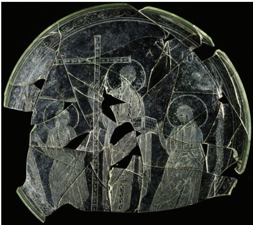
FIGURA 2.- PLATO DE CÁSTULO. Museo Arqueológico de Linares.

Cristo ocupa el centro, sosteniendo en alto la cruz. Está de pie. Es imberbe y con el pelo rizado, con la ley escrita en un rollo abierto. El tema de la escena y la iconografía de los personajes que le acompañan –Pedro y Pablo– es de gran novedad en la pieza de Cástulo, y está al final de una larga historia de Cristo en diferentes escenas y de una variada iconografía de los tres personajes, los tres nimbados (Fig. 2).