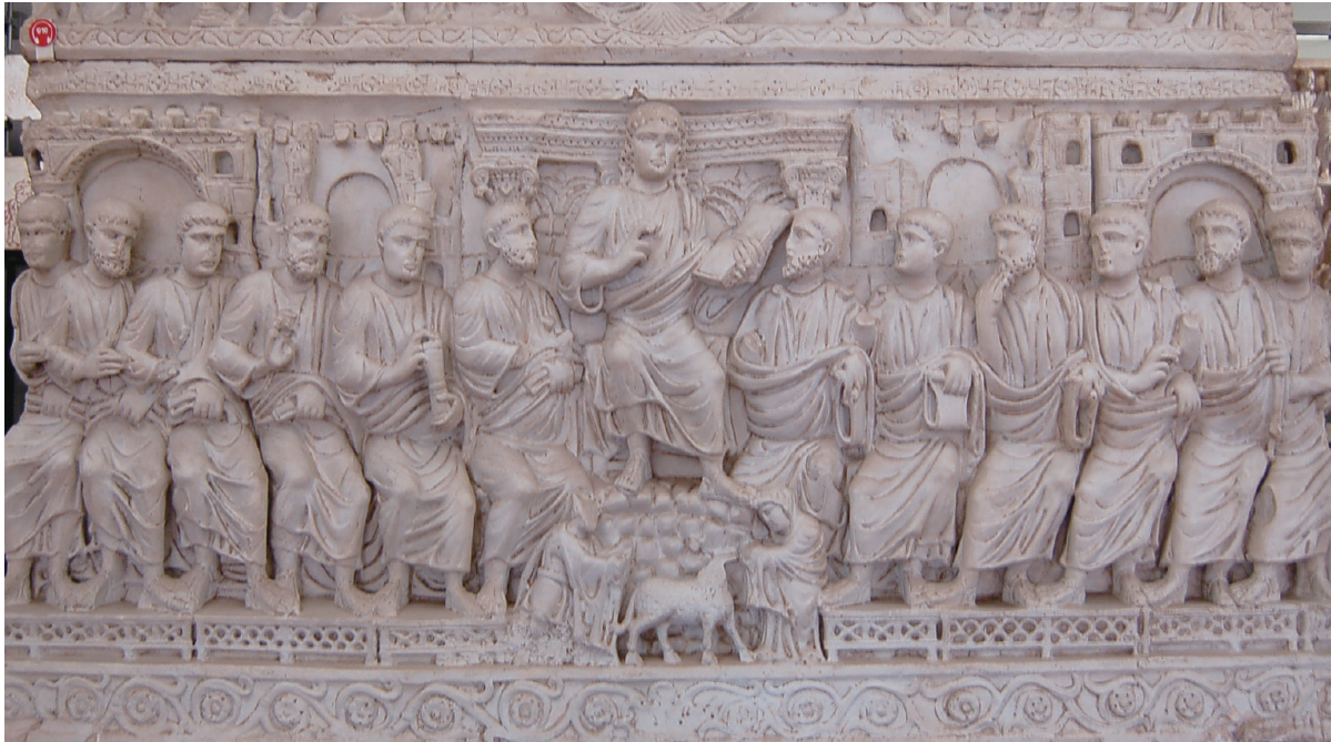
FIGURA 8.- SARCÓFAGO CON LA TRADITIO LEGIS . Basílica de S. Ambrosio. Milán.

pelo corto y barba, al igual que los cuatro mártires colocados en la parte inferior entre el cordero, de comienzos del s. V 18 .