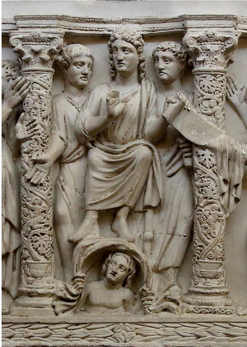
FIGURA 3.- SARCÓFAGO CON LA TRADITIO LEGIS . Museo de Letrán. Roma.

13.10; 14.9; 16.15 s.; Lc. 8.17; 12.1; 24.44-49, etc.). Pablo recuerda la verdad recibida y transmitida (Flp. 4.9). Recomienda conservarla (1 Tim. 4.11; 16; 2 Tim. 1.13 s.; 2.14; 4.2; Tit. 2.1; 38). Lógicamente, Cristo tenía que entregar la Ley a Pedro, quien es la roca sobre la que Cristo edifica su Iglesia (Mt. 16.11-18). Cristo da a Pedro las llaves del Reino de los Cielos, con posibilidad de atar y desatar (Mt. 16.19).