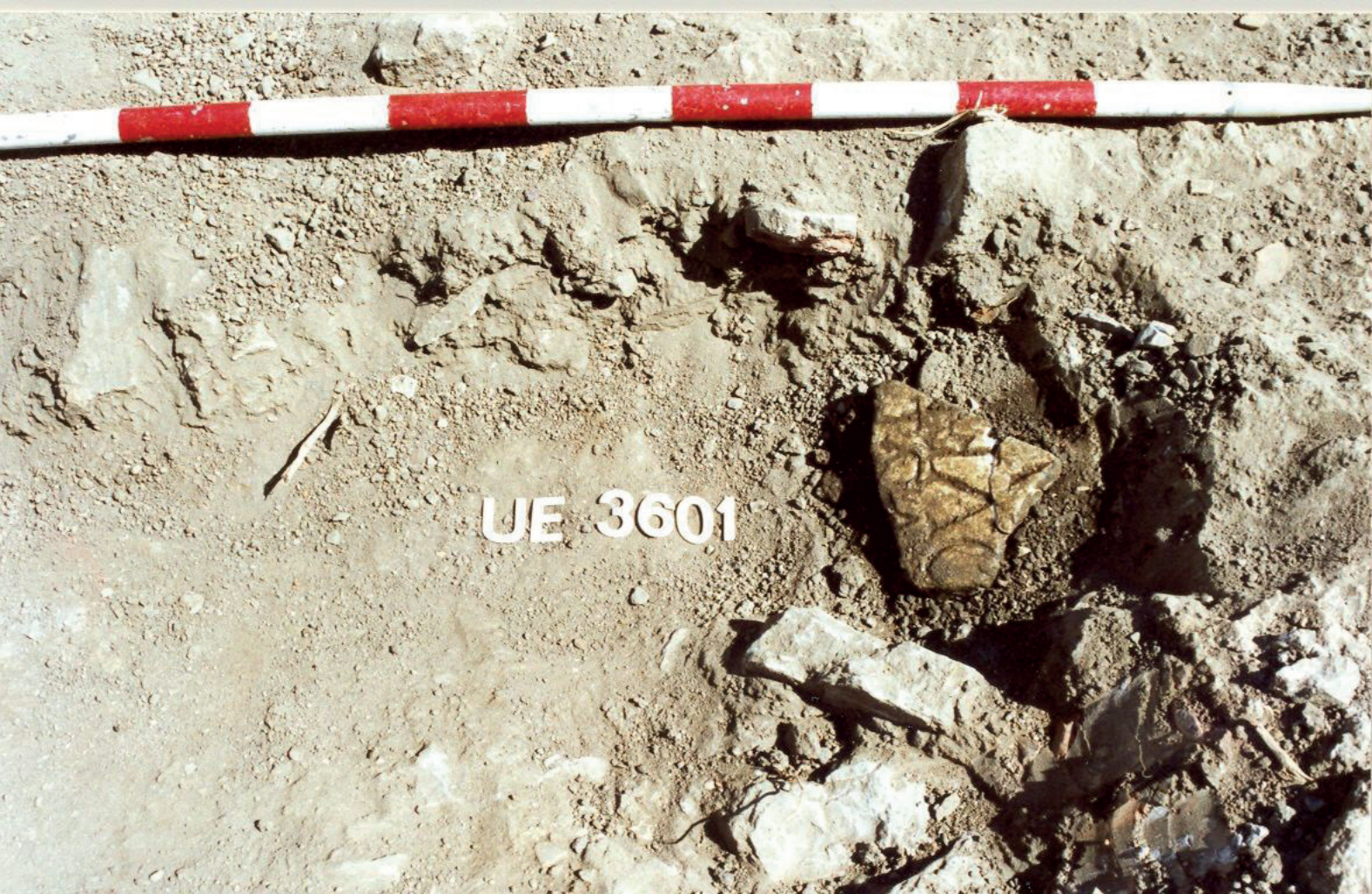
FIGURA 1. HALLAZGO DEL EPÍGRAFE

CON MOTIVO DE UNA INTERVENCIÓN arqueológica de urgencia en la c/ San Nicolás n.º 3-5 de Algeciras 3 llevada a cabo de junio a octubre de 2001, fueron hallados en la zona sur del yacimiento (U.E. 6701 y 3601 respectivamente) (v. FIG. 1) dos pequeños fragmentos de mármol con inscripción latina, que no permiten —a juzgar por el escaso texto conservado— aventurar ninguna hipótesis sobre la naturaleza de los mismos. Su hallazgo es, sin embargo, notable por tratarse de los primeros epígrafes hallados en Algeciras en una excavación sistemática, y por tratarse de una zona destinada a actividades de carácter industrial. Pasamos a describirlos