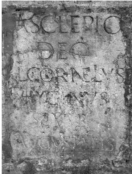
Fig. 3. Pedestal dedicado a Esculapio por el sevir augustal L. Cornelius Hyginus.

culapio en las proximidades del foro puede responder a la existencia de un santuario consagrado a esta divinidad, según una hipótesis recientemente planteada 55 .