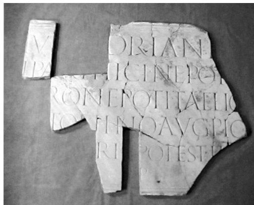
Fig. 5. Inscripción honorífica dedicada al emperador Antonio Pío

mera de ellas corresponde a un texto editado por el maestro a quien homenajeamos en estas páginas, que figura en la cara posterior de un pedestal dedicado a Aureliano 74 , donde se conserva medio borrada una dedicatoria a Heliogábalo que, según la restitución propuesta, puede fecharse en el año 218. Sigue un pequeño fragmento de atribución dudosa que podría estar dedicado a Severo Alejandro (222-235) 75 . Otros dos monumentos están dedicados a sendos familiares de este emperador: uno a Iulia Mamaea , su madre, cuyo nombre fue objeto de damnatio , que puede fecharse en los años 222-235; y otro a Gnaea Seia Herennia Sallustia Orba Barbina Orbiana , su esposa, que puede fecharse en los años 225-227 76 . Ambas son las primeras dedicatorias imperiales que mencionan la doble comunidad en el siglo III.