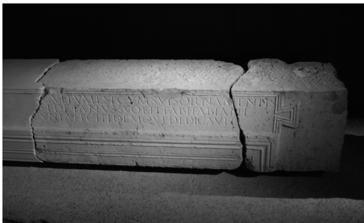
Fig. 4. Dintel fracturado, tal vez perteneciente al aedes Augusti.

autores se trataría de un templo consagrado a las Ninfas y los dedicantes serían un personaje de procedencia edetana llamado L. Fabius (...) y su hijo L. Fabius Fabianus , quienes lo habrían construido en una muestra de munificencia posiblemente dirigida a su promoción social en Valentia . Aunque la propuesta resulta sugerente, la extensión de la parte restituida del texto es claramente excesiva y la atribución a las Ninfas no encuentra justificación. La datación del monumento en época flavia encaja bien con el momento de construcción del fórum de la ciudad.