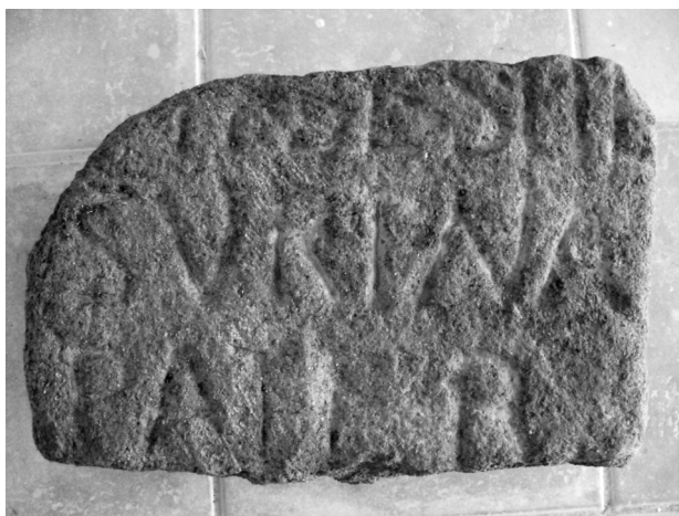
Fig. 2: Detalle del texto del epitafio hallado en Don Benito.