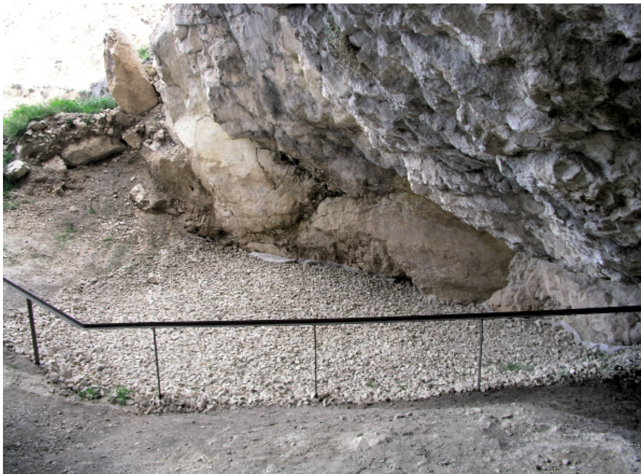
▲ FIGURA 10. Vista de la zona oeste del yacimiento tras finalizar los trabajos de desescombro y su posterior puesta en valor para ser visitado por todos los ciudadanos que lo deseen.

abandono de la estación, al estar en un plano ligeramente inclinado, se había llenado de polvo y tierra. Al limpiarlo, nos dimos cuenta de la existencia de algunas líneas incisas que procedimos a limpiar inmediatamente. Después de muchos años en los que todos los investigadores que nos habían precedido en la investigación del yacimiento habían asegurado que no había arte rupestre parietal en la Cueva de Ambrosio, por fin apareció. Diferenciamos dos paneles. El más exterior es el I y el que se encuentra más hacia el interior del abrigo es el II. No nos extenderemos en este apartado ya que se objeto de otra contribución en este mismo volumen.