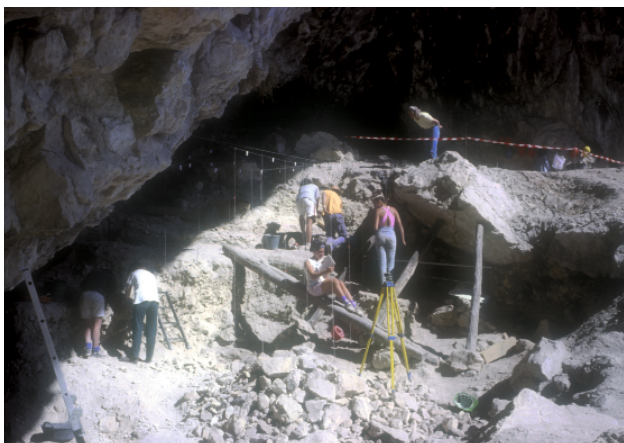
▲ FIGURA 6. Vista de los trabajos de excavación en la campaña del año 1990.

el extraer una columna estratigráfica de la parte inferior (subniveles V a X) de la denominada microestratigrafía para proceder a su estudio.