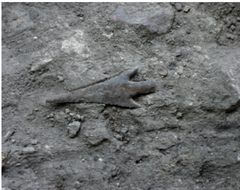
◀ FIGURA 9. Detalle de una de las magníficas puntas de aletas y pedúnculo hallada en la capa 7bis de la microestratigrafía.

cazadores-recolectores, sin despreciar por ello la que nos podrá brindar acerca de los grupos sedentarios.