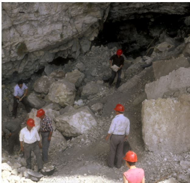
▲ FIGURA 2. En el año 1982 se iniciaron las labores de adecuamiento del yacimiento con el fin de localizar los posibles sedimentos intactos que quedaran en el mismo.

fuentes de materia prima, estudio de gran importancia para el Proyecto de Investigación ya que nos permitiría descubrir si existían sílex alóctonos a la zona de influencia.