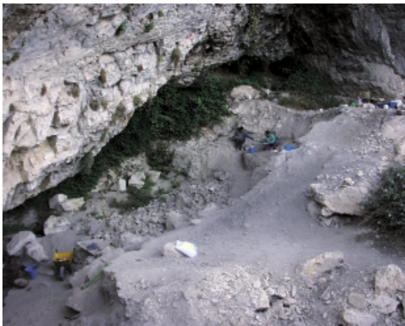
◀ FIGURA 7. Vista del caos de bloques y sedimento revuelto antes de inicio de la campaña de limpieza llevada a cabo en el año 2002.

económicas de los grupos antrópicos que habitarían este excepcional yacimiento.