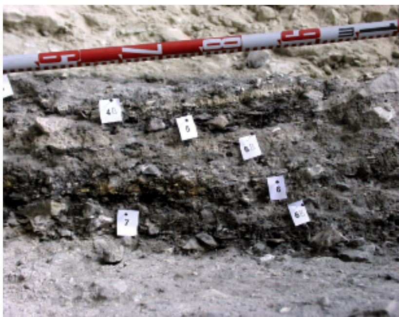
◀ FIGURA 8. Detalle de alguno de los niveles de la denominada Microestratigrafía, que en definitiva es una ocupación intensiva de una determinada zona por parte de los solutrenses superiores evolucionados.

Sin duda alguna la duración del encendido del fuego, elemento fundamental en la vida del ser humano, nos dará una aproximación bastante precisa de la longitud de las ocupaciones o asentamientos humanos de los grupos de