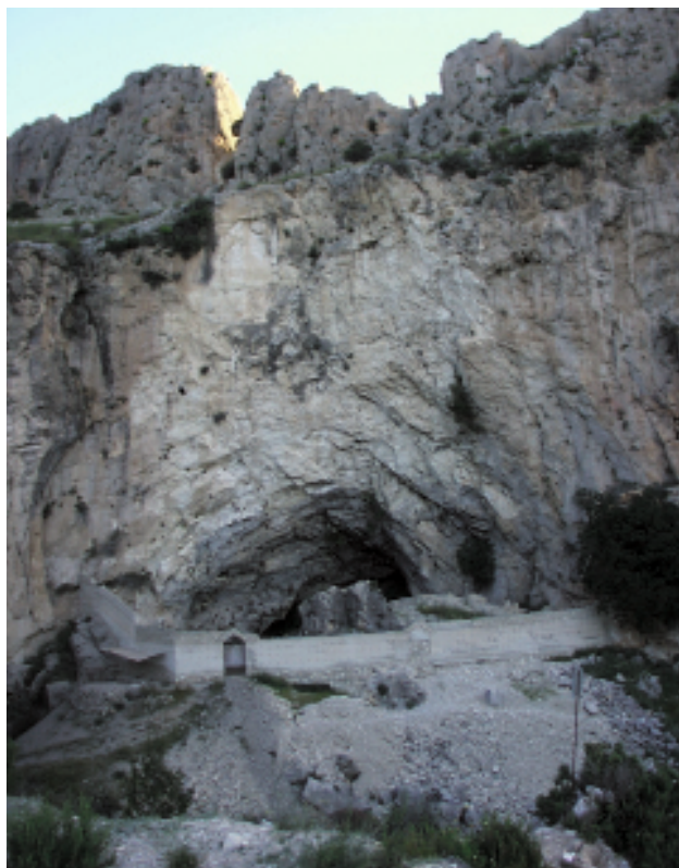
▲ FIGURA 1. Vista de conjunto de abrigo de La Cueva de Ambrosio con el muro de hormigón del cerramiento construido a mediados de los años 80.

sor M. Botella, se encontró un compresor-retocador (Fig. 5) de piedra caliza, con un grabado de un protomos de caballo en trazo profundo. Se realizaron numerosas fotografías del estado del abrigo antes del inicio de la excavación y limpieza y al finalizar la campaña. Cuando estábamos a punto de cerrar la excavación nos dimos cuenta que el abrigo quedaba prácticamente limpio y era una "tentación" para los clandestinos, por lo que decidimos invertir una parte del presupuesto en mejorar el cerramiento del yacimiento.