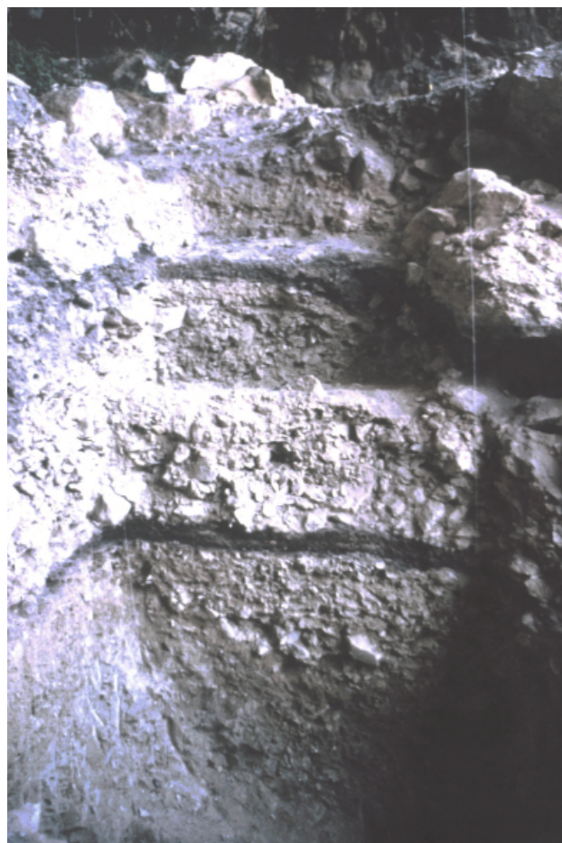
▲ FIGURA 4. Corte estratigráfico al finalizar la campaña de 1986 en donde, además de los niveles identificados anteriormente, incorporamos un tercer horizonte ocupacional que se corresponde con el Solutrense superior evolucionado. Bajo el gran bloque de la derecha, posteriormente identificamos los niveles correspondientes a lo que denominamos la microestratigrafía.