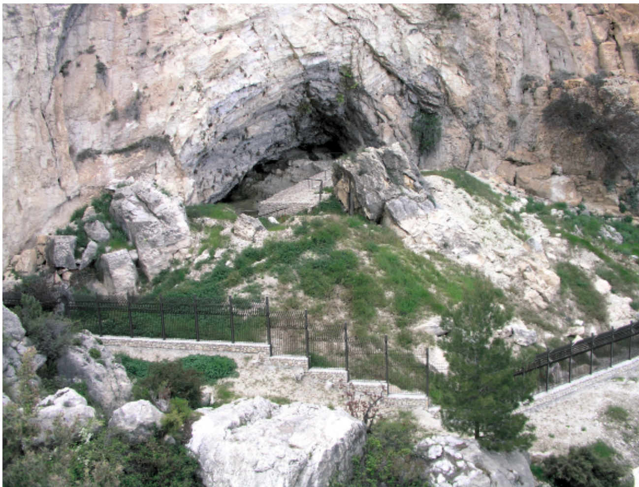
▲ FIGURA 11. Aspecto del yacimiento al finalizar los trabajos de desescombro y la retirada del muro de hormigón que cerraba la estación.

la superficie excavable que quedaba en el yacimiento, localizar —si era posible— los cortes dejados durante las campañas de excavaciones de los investigadores que nos precedieron el estudio de La Cueva de Ambrosio, y establecer el «suelo» sobre el que se colocaría el enlosado de protección.