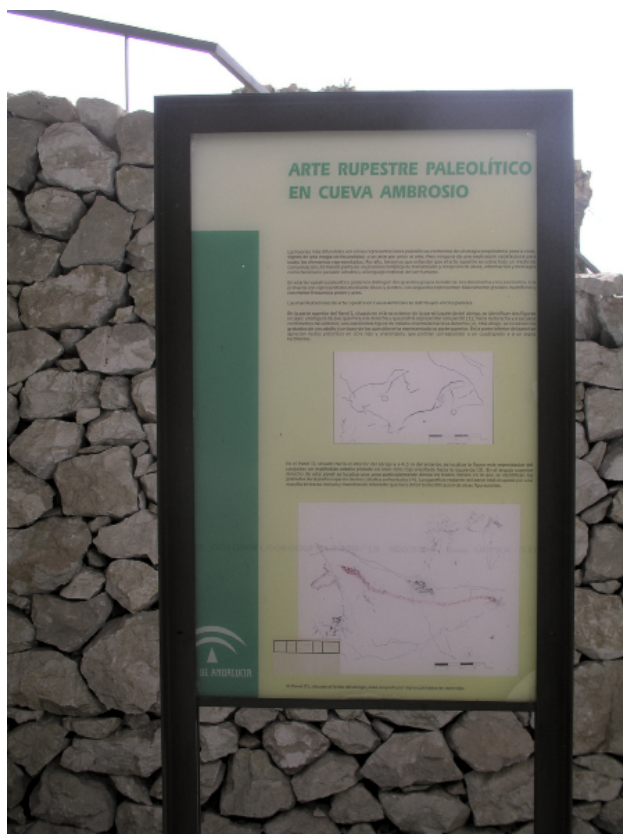
▲ FIGURA 12. Panel explicativo del conjunto de manifestaciones artísticas colocado en el yacimiento como parte de la musealización del mismo.

tendía es realizar una documentación fotográfica completa en diferentes soportes y tipos de película, y vídeo para poder seguir trabajando sobre las mismas.