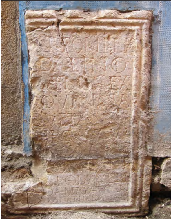
FIGURA 1. PEDESTAL EN PIEDRA DE SANTA TECLA DONADO POR POMPEIA VERECUNDA (CAT-9).

estuvieron al servicio de la representación escultórica de un liberto.