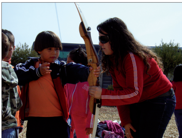
FIGURA 28. Equipo Deportivo de Tiro con Arco de Almonacid de Zorita mostrando en el PAR a un grupo de escolares cómo era la caza en época medieval.