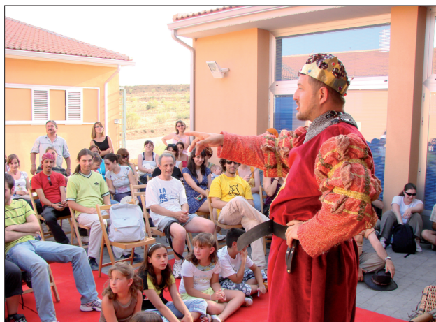
FIGURA 32. Representación teatral de "La Reina sin Nombre", novela contextualizada en época visigoda por su autor y representada por Galápagos Teatro Cálido en el PAR.

dos, para comprobar su total o nula efectividad en la recepción del mensaje a transmitir. Y todo con un objetivo común a la propia gestión y razón de ser del Parque Arqueológico: la conservación del Patrimonio, entendiéndose este tanto en términos culturales como naturales (fig. 32).