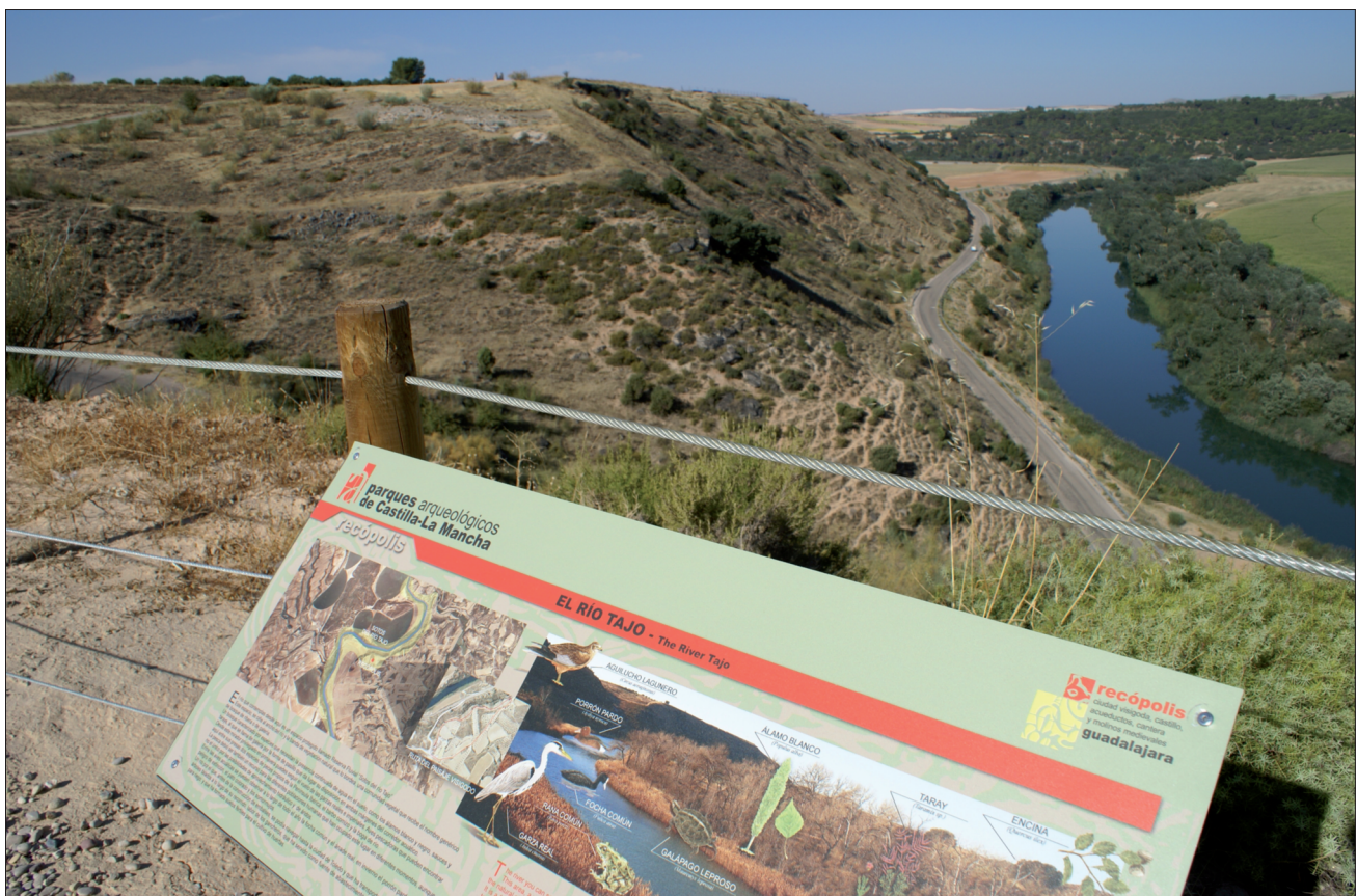
FIGURA 26. Recópolis de fondo y la arteria principal de este paisaje histórico: el Río Tajo.