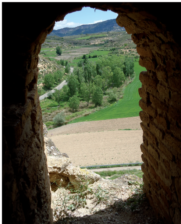
FIGURA 8. El control estratégico de los valles que dominan el territorio es patente desde el castillo.