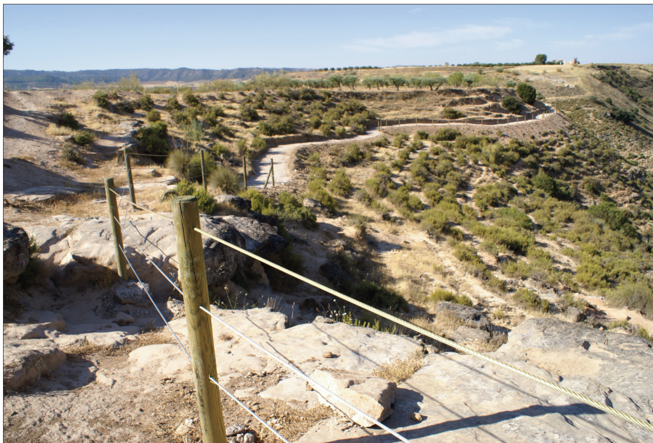
FIGURA 20. El PAR tiene marcados todos los itinerarios que pueden recorrer los visitantes para un buen uso y disfrute de la actividad, facilitando en la medida de lo posible el acceso y evitando cualquier tipo de riesgo para la integridad física de los usuarios así como para proteger y salvaguardar elementos frágiles del patrimonio visitado.