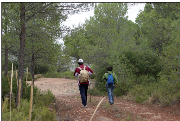
FIGURA 14. Son numerosas las rutas de senderismo en esta estribación montañosa para uso y disfrute de los amantes de la Naturaleza.

Europea de Espacios Naturales de alto valor ecológico donde se establecen áreas de conservación de la biodiversidad debido a su alto valor ecológico y paisajístico. Consta de Zonas Especiales de Conservación designadas de acuerdo con la Directiva Hábitat, así como de Zonas de Especial Protección para las Aves establecidas en virtud de la Directiva Aves. La finalidad de esta Red es asegurar la supervivencia a largo