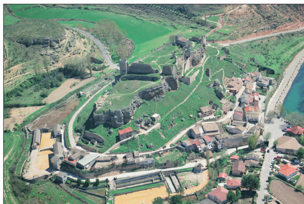
FIGURA 6. Vista aérea del Castillo de Zorita de los Canes.

Esta alcazaba islámica primero y luego fortaleza de la Orden de Calatrava, es reflejo del dinamismo cultural que se aprecia en este territorio y, obviamente, también es el otro gran yacimiento arqueológico del Parque. En la actualidad no es visitable, pues acaban de finalizar las tareas de restauración y consolidación de los paramentos del castillo llevadas a cabo gracias al 1% Cultural que el Ministerio de Fomento y la Junta de Comunidades de Castilla La Mancha han adjudicado para su rehabilitación. En estos momentos desde el Parque Arqueológico se están llevando a cabo tareas de limpieza y reacondicionamiento para que prontamente sea yacimiento visitable (figs. 9 y 10).