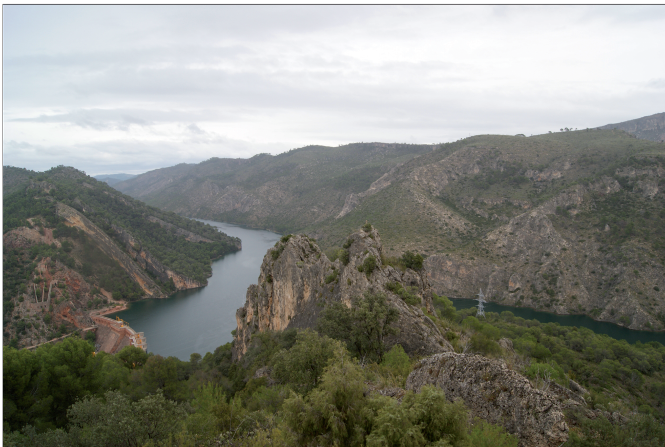
FIGURA 13. Vista panorámica de la Sierra de Altamira, con detalle de la Presa de Bolarque y el Río Tajo.