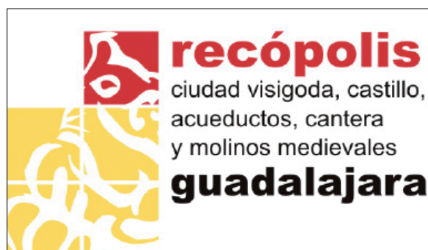
FIGURA 2. Al igual que el PAR, cada Parque Arqueológico tiene su propio distintivo o logotipo que le caracteriza e imprime imagen propia, aunque todos son y forman la Red de Parques Arqueológicos de Castilla-La Mancha.

Atendiendo a estas condicionantes, surge la Red de Parques Arqueológicos de Castilla-La Mancha, uno por cada provincia y cada uno con su propio Decreto Ley de Creación. La declaración del Parque Arqueológico de Recópolis la encontramos en el Decreto 280/2004, de 30-11-2004.