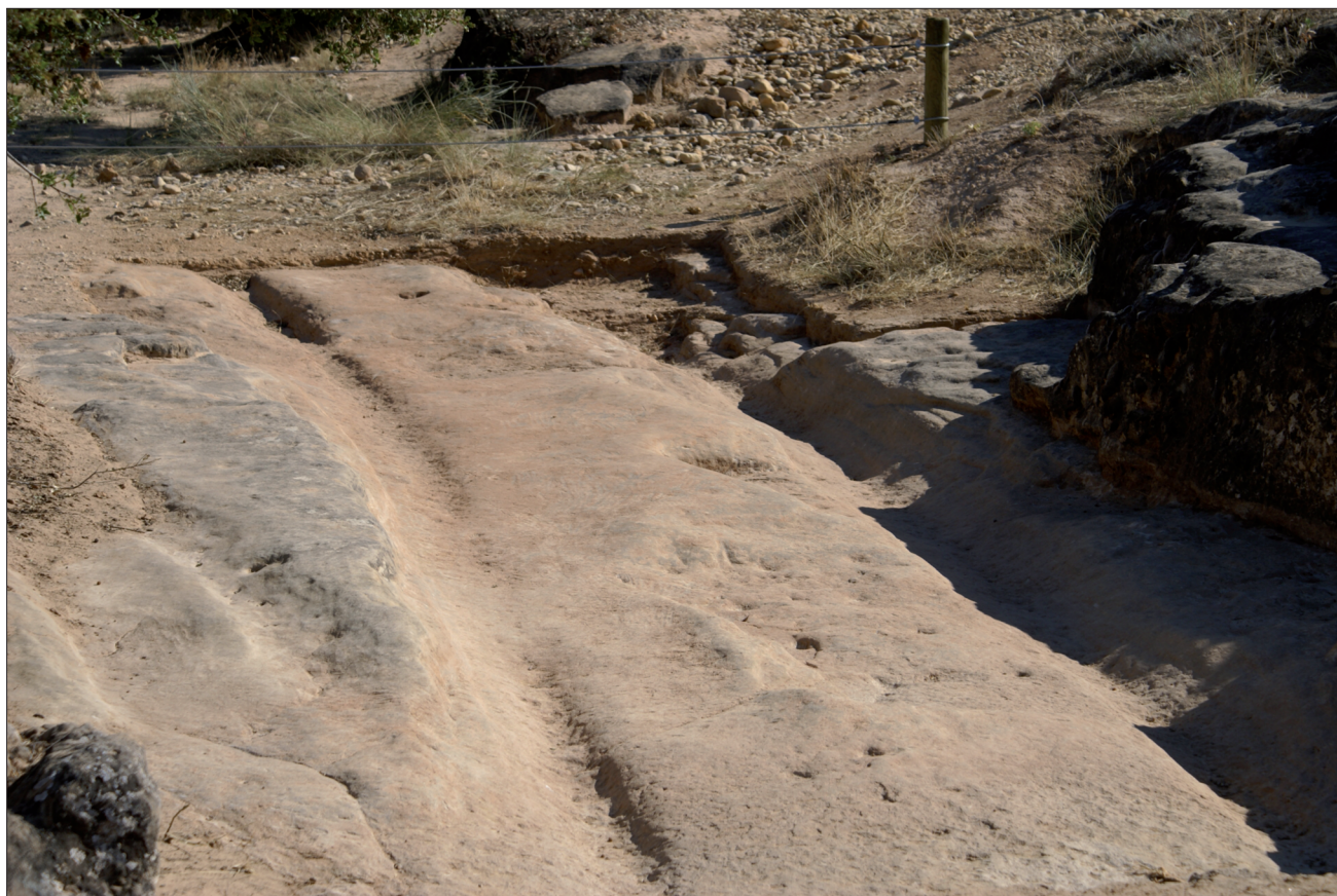
FIGURA 12. Rodadas de carro en el denominado «Camino Medieval» de Recópolis.