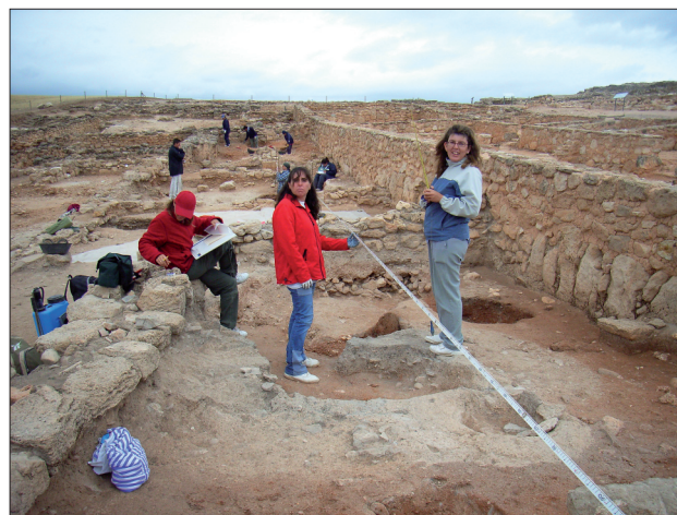
FIGURA 30. Campaña de excavaciones sistemáticas en el yacimiento de Recópolis.