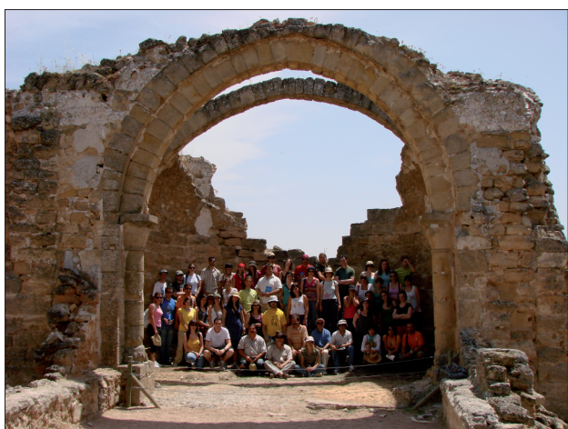
FIGURA 5. Detalle del interior de la basílica visigoda con un grupo de excursionistas posando.

Mancha) lo que explica también su gran importancia histórica. Fue fundado por Muhammad I a mediados del siglo IX. Al presentar diferentes modos de aparejo se aprecian las distintas fases constructivas de época islámica dándose el verdadero desarrollo del castillo en época califal. Con la llegada de la Orden de Calatrava en los siglos XIII y XIV se desarrollan también importantes obras de arquitectura e ingeniería, destacando de este período la iglesia que preside el castillo de estilo protogótico con una única nave (figs. 6, 7 y 8).