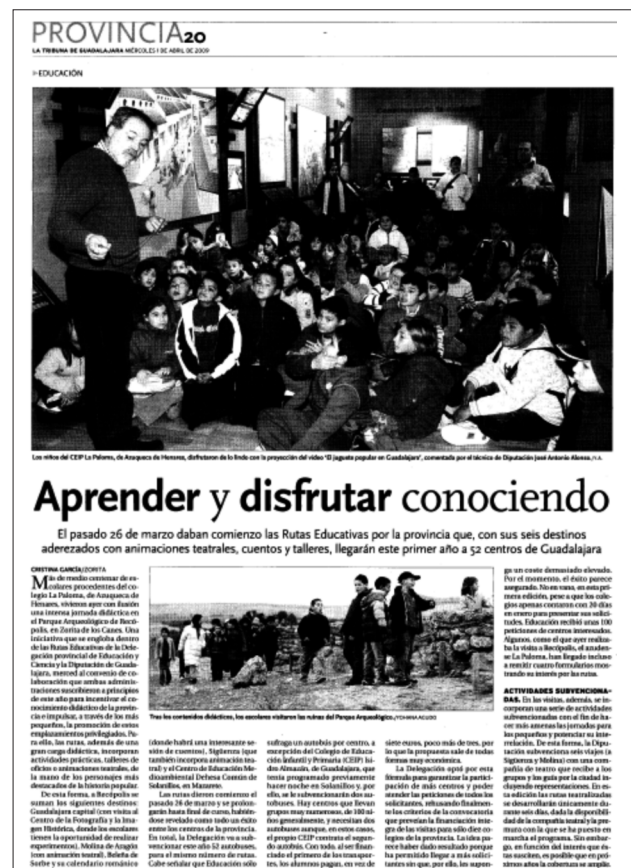
FIGURA 19. Reportaje sobre una actividad realizada en el PAR con motivo de las Rutas Educativas por la provincia de Guadalajara que se organizaban desde la Delegación de Educación, Ciencia y Cultura Provincial de Guadalajara.