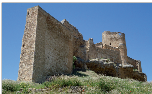
FIGURA 7. El enclave sobre el promontorio de arenisca confiere a la alcazaba un alto grado de inexpugnabilidad, característica elocuente de este BIC.