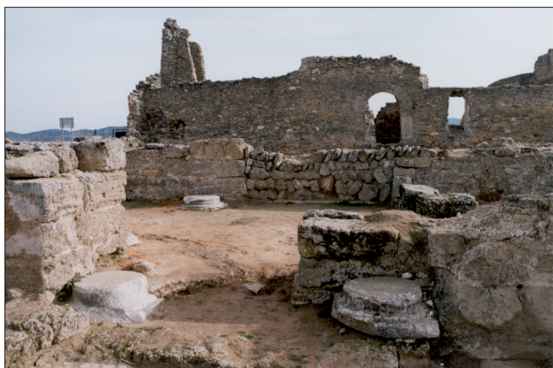
FIGURA 4. Imagen de la puerta de acceso al nartex de la basílica visigoda de Recópolis.