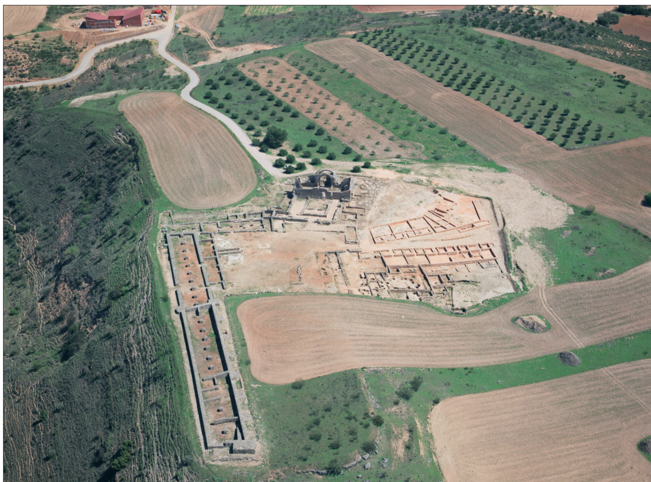
FIGURA 3. Vista aérea del yacimiento arqueológico visitable Recópolis.

Está en una situación de excelencia estratégica desde donde se controla uno de los pasos del río Tajo, así como los valles del Henares a las Sierras de Cuenca que son paso hacia Levante, junto a la confluencia de distintos ecosistemas (Alcarria-La