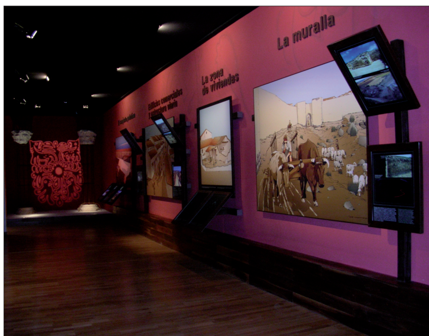
FIGURA 24. El Centro de Interpretación cuenta con 5 salas temáticas más un vestíbulo de atención al público y tienda de souvenirs relativos al PAR. Así mismo cuenta con una sala de audiovisuales donde se proyecta un documental del devenir histórico de este paisaje histórico.

ciones, que de un lado no sólo resultan atractivas al público, sino que son de una fácil comprensión para todos los visitantes —indistintamente de su edad y conocimientos culturales más o menos especializados con respecto al tema—. Así mismo el montaje de dichos paneles es un montaje de fácil renovación, pues todo se basa en vinilos de fácil desmonte, y fácil producción. Todo pensado y proyectado desde el punto de vista de dar mayor flexibilidad y dinamismo en el discurso expositivo en función de los distintos avances científicos, así como los propios de puesta en valor de los distintos yacimientos y elementos que conforman el Parque Arqueológico (fig. 24).