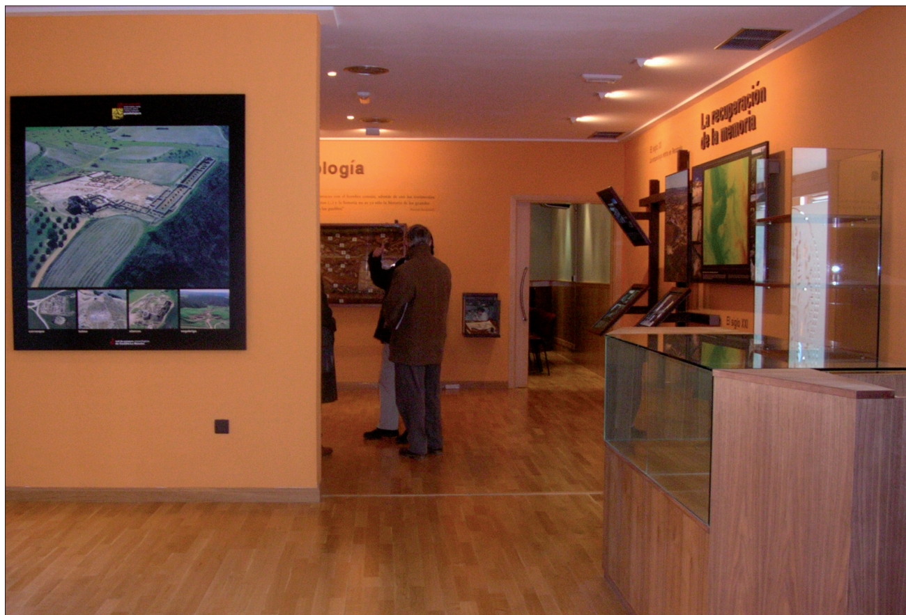
FIGURA 22. El Centro de Interpretación es lo primero que se encuentra el visitante a su llegada al PAR. En el vestíbulo es recibido por el personal del PAR e informado de todos los aspectos relacionados con la visita, uso y disfrute de las instalaciones y recursos a visitar.