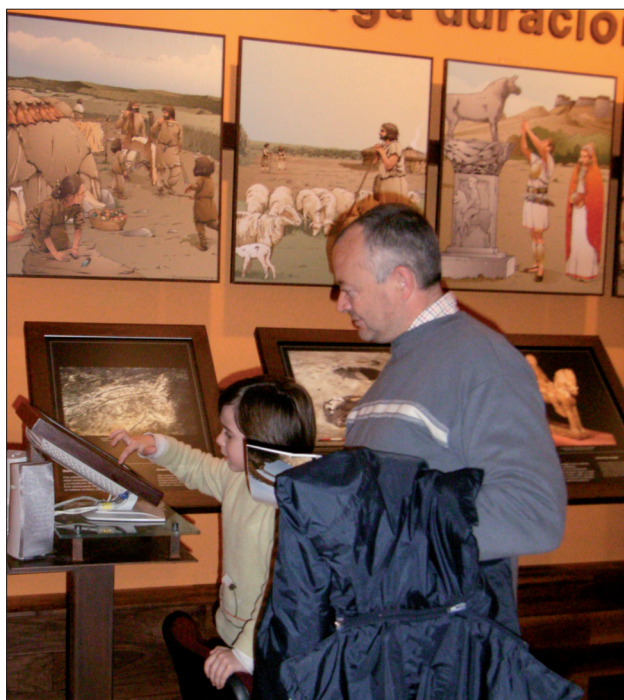
Figura 21. El público es general, pero no igual, y todos deben de ver satisfechas sus distintas necesidades culturales, luego el método debe ser particular.

El conjunto de principios que sirven de base para el desarrollo de la disciplina de Interpretación del Patrimonio, siguiendo a Tilden (1957) y a Guerra Rosado (1998) quedan resumidos de la siguiente manera: