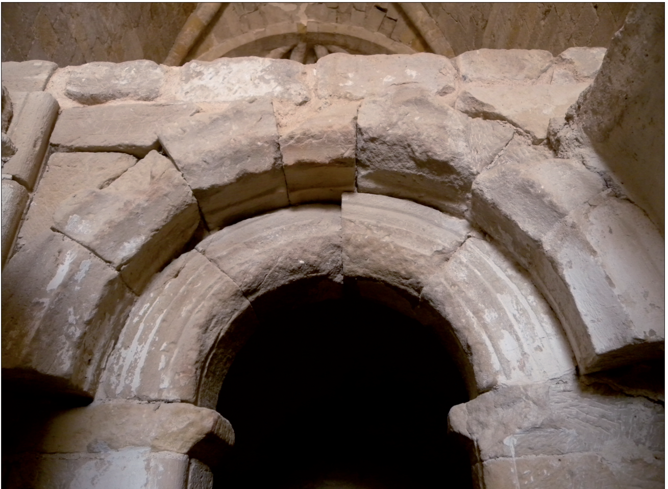
FIGURA 10. Arcos de medio punto de la entrada a la cripta de iglesia calatrava del Castillo de Zorita.