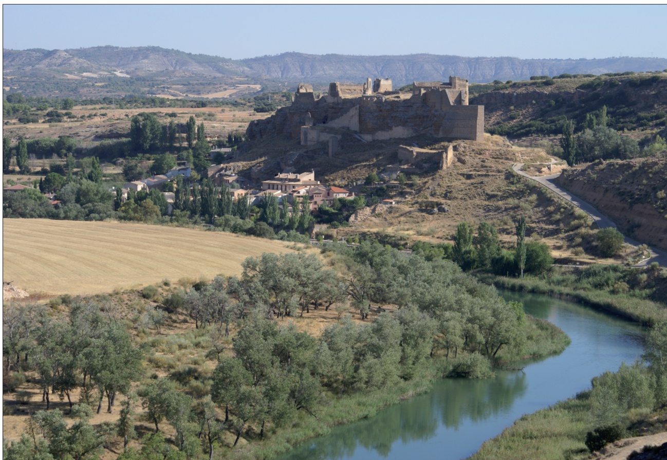
FIGURA 16. El río Tajo es el indiscutible protagonista del paisaje histórico del Parque.

da retenido en dos ocasiones más para el aprovechamiento hidroeléctrico en los pequeños embalses de Zorita (3hm 3 ) y Almoguera (7hm 3 ), (fig. 16).