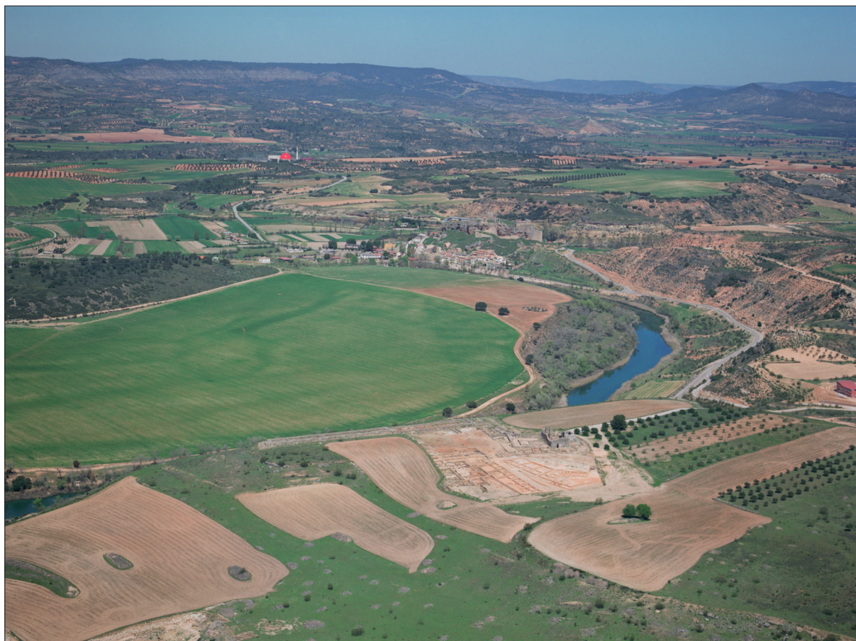
FIGURA 1. Fotografía aérea de todo el territorio que comprende el Parque Arqueológico de Recópolis.