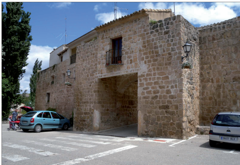
FIGURA 11. Puerta de acceso a la muralla de Zorita de los Canes, y por ende, a la alcazaba.