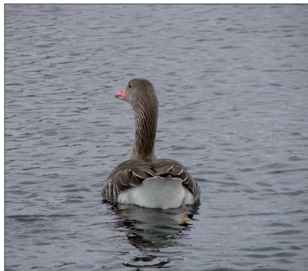
Figura 17. Es muy probable poder observar desde el PAR toda clase de aves acuáticas dado el gran número tanto de especies como de individuos que habitan este tramo del Río Tajo.

curso natural que aportaba agua y alimento a través de las huertas, así como vehículo hacia Toledo de las embarcaciones y sobre todo de la madera de los árboles talados a lo largo del recorrido, trabajo de los famosos gancheros (fig. 17).