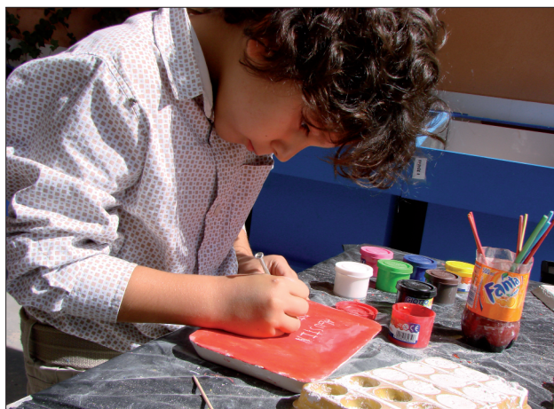
FIGURA 31. El desarrollo de actividades y talleres arqueológicos adaptados a escolares no sólo fomentan la visita al PAR, sino que ofrecen enormes posibilidades a la hora de la transmisión de diversos conocimientos relacionados con los propios currícula y planes de estudio escolares.