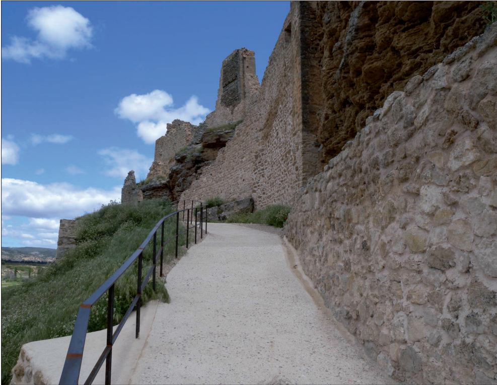
FIGURA 9. Ejemplo de acondicionamiento de los accesos al Castillo de Zorita en la rehabilitación realizada por el Ayuntamiento de Zorita de los Canes y llevada a cabo con la colaboración del Ministerio de Fomento y la Junta de Comunidades de Castilla-La Mancha con cargo a los Planes y Programas para la conservación del Patrimonio Arquitectónico e Histórico «1% Cultural» finalizada en abril de 2010.