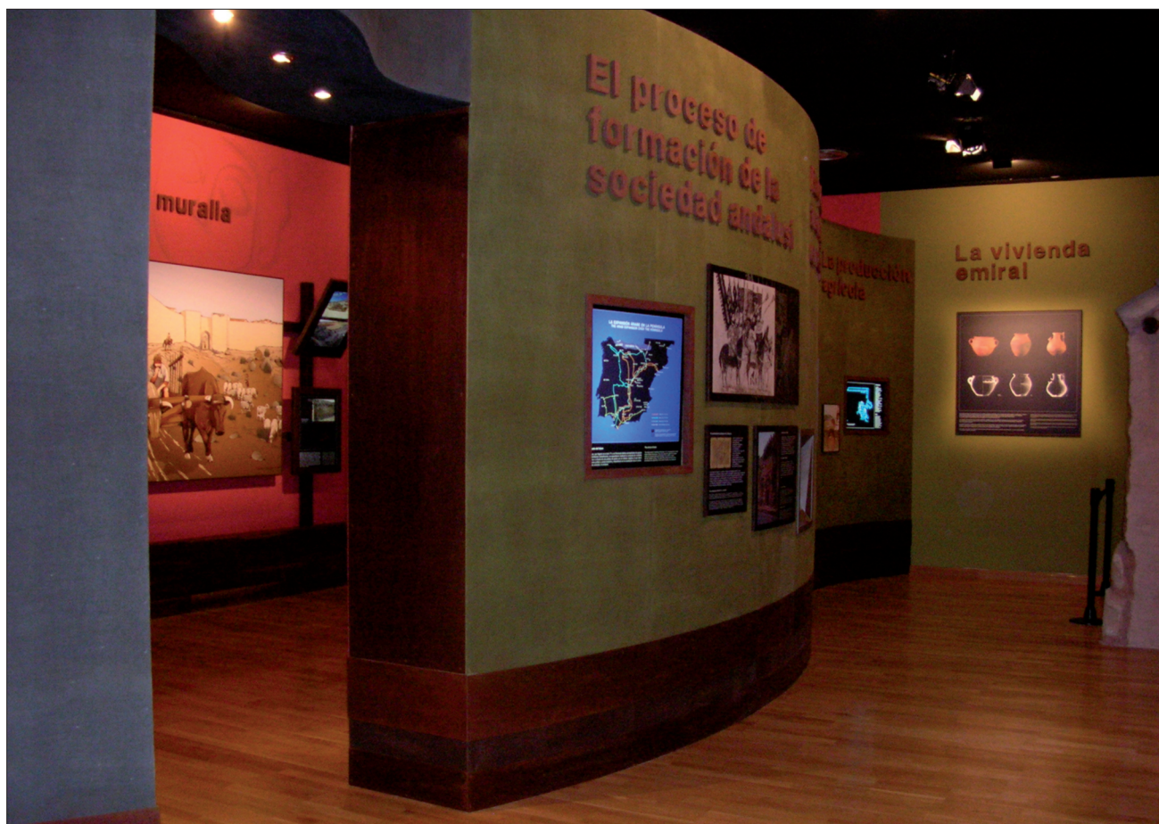
FIGURA 23: El diseño del centro de interpretación es lo suficientemente atractivo como para llamar y mantener la atención del público, sin embargo y lo que es muy importante, jamás se enmascara el mensaje histórico.