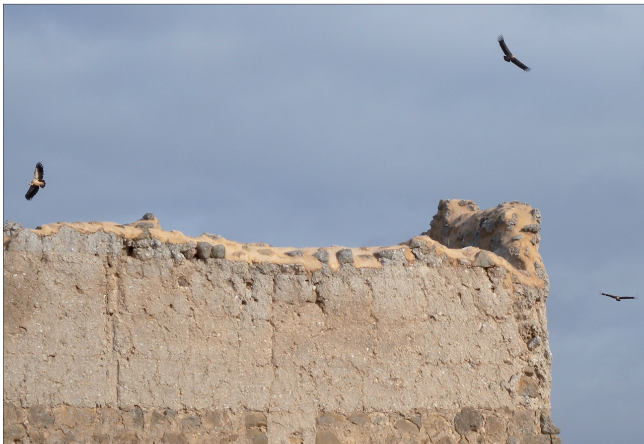
FIGURA 15. Grupo de buitres leonados surcando los cielos del PAR. Son imágenes habituales en este territorio.

Las especies de más interés son el grupo de las rapaces, pudiéndose observar ejemplares de Águila perdicera ( Hyera-tus fasciatus ) muy amenazada; Águila real ( Aquila chrysaetos ); Halcón peregrino ( Falco peregrinus ); Buitre leonado ( Gyps fulvus ); Alimoche ( Neophron pernocterus ); Águila cu-lebrera ( Circus gallicus ); Águila calzada ( Hieratus penna-tus ); Cernícalo primilla ( Falco naumanni ); Aguilucho lagunero ( Circus aeruginosus ), Ratónero común ( Buteo buteo ) (fig. 15).