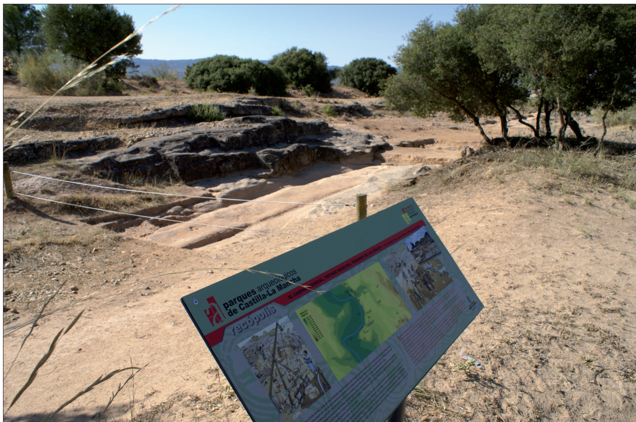
FIGURA 27. Detalle del Camino Medieval.

restos de las canteras de donde los visigodos extrajeron los grandes sillares con los que construyeron la ciudad de Recópolis (fig. 27).