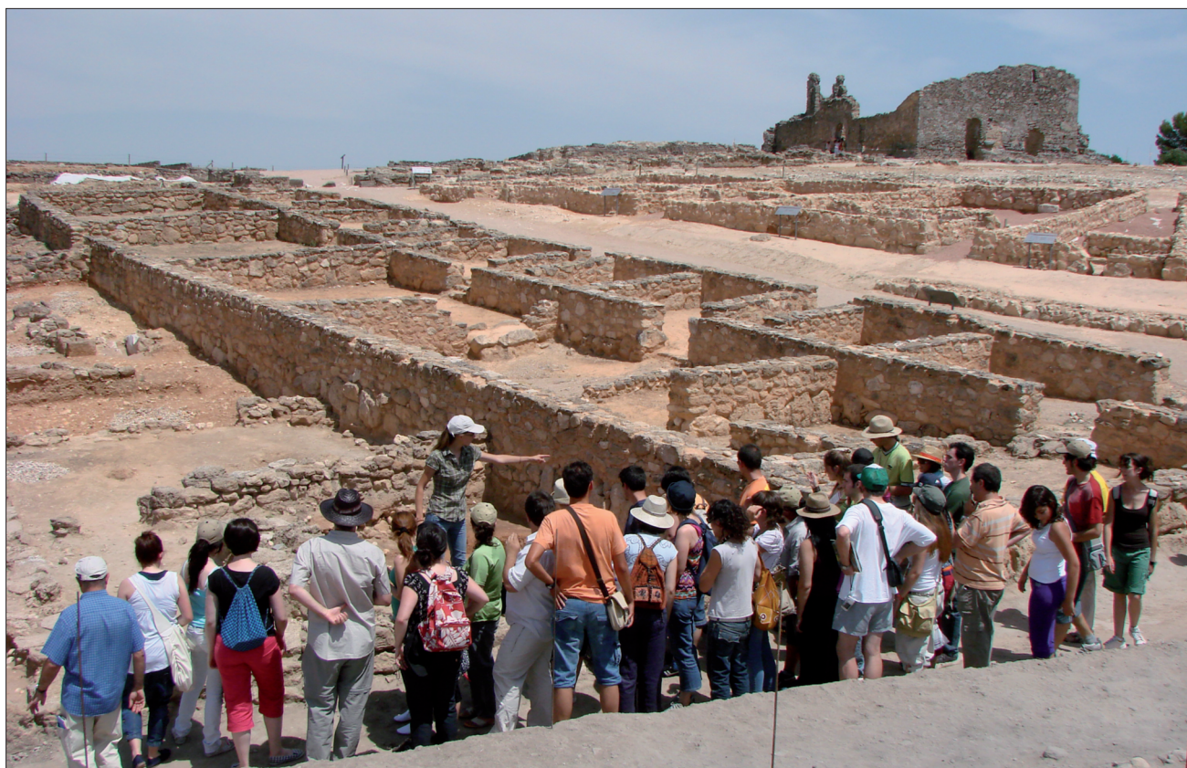
FIGURA 18. Grupo de visitantes en el yacimiento arqueológico de Recópolis.

Según, precisamente, la AIP, la Interpretación del Patrimonio es «el arte de revelar in situ el significado del legado natural, cultural o histórico, al público que visita esos lugares en su tiempo de ocio». Esta definición nos aproxima no sólo a la esencia misma de la Interpretación del Patrimonio (IP), sino que matiza ciertos sustantivos dotándoles así de