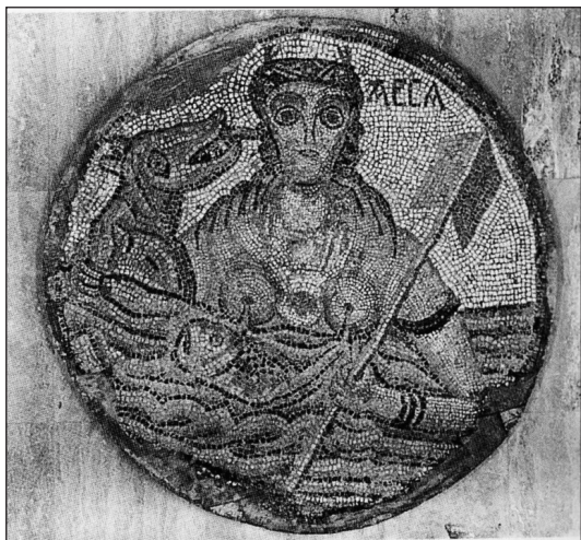
▲ FIGURA 7. Mosaico de Siria.