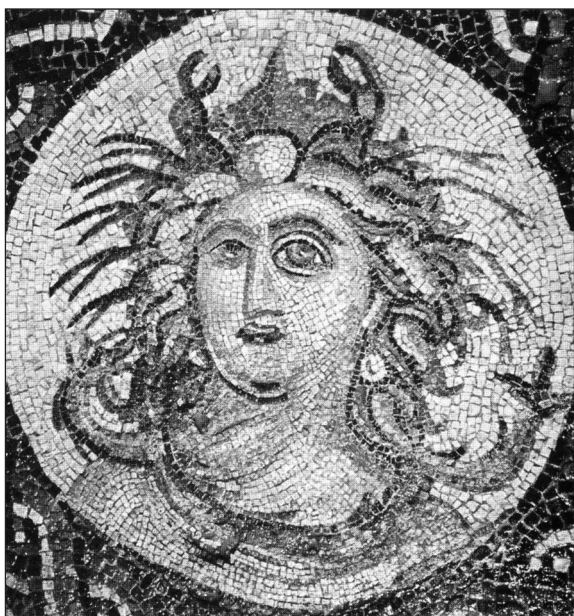
▲ FIGURA 9. Mosaico de la villa de la Gara de las Nereidas, Tagiura, Libia. Tablinum 6.