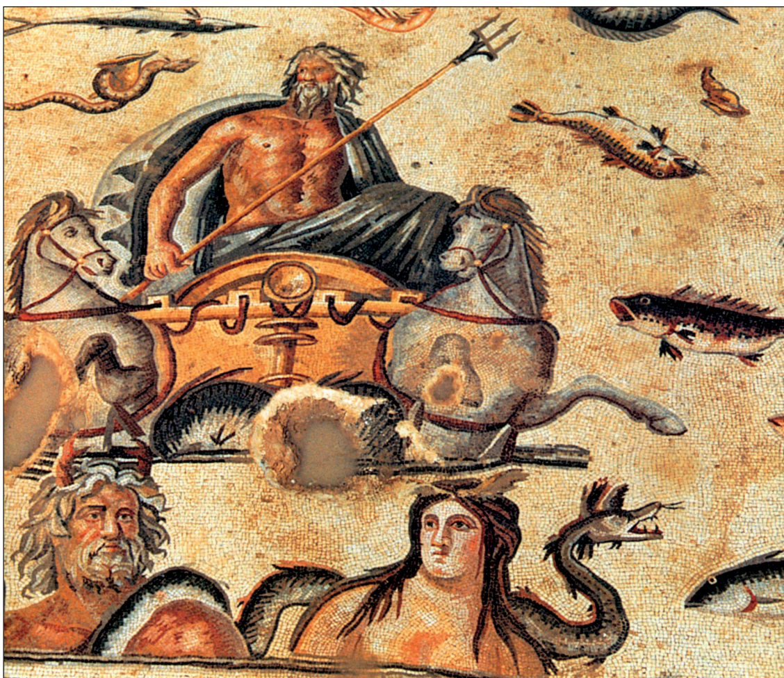
▲ FIGURA 5. Mosaico de Zeugma (Turqu a).