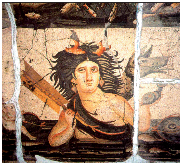
▲ FIGURA 10. Mosaico de Yakto de Antioquia.

ficadas como Anfritrite 23 (figs. 8 y 9). Estos dos ejemplares serían los paralelos más próximos para la figura del mosaico hispano de Bruñel puesto que llevan el khetos enrollado en el cuello, así como el pelo desordenado o mojado, patas de cangrejo y algunas algas en la cabeza. Igualmente se añadiría el mosaico de Yakto de Antioquia cuya figura fue atribuida a Thetys 24 y actualmente identificada con Thalassa 25 , señalando Sara M. Wages que esta imagen sería la última fase de la serie de la evolución iconográfica de Thetys/Thalassa. Esta figura emerge del mar entre erotes sobre del-