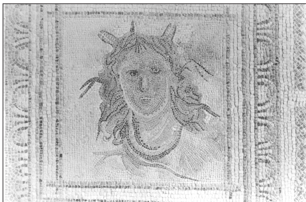
▲ FIGURA 3. Mosaico de la villa de Bruñel, Quesada, Jaén.

La iconografía de Tethys sola y en busto aparece en varios mosaicos de los siglos III y IV, hallados principalmente en la parte oriental del Imperio, en Antioquía y Shahba Philippopolis (Siria), además de los ejemplares de Italia y Gran Bretaña 12 . El contexto marino de peces es la constante en todos ellos, mientras que el khetos aparece generalmente enrollado alrededor de su brazo como en los ejemplares de Anazarbes (Sicilia) 13 y de Shahba Philippopolis que se conserva en el museo de Souweida 14 , o enrollado en el cuello en otro mosaico de Shahba Philippopolis conservado in situ 15 , y en el pavimento de Antioquía de la Casa del barco de Psiques, hab. 6 16 . El atributo del remo aparece, además de en los mosaicos anteriores, en el pavimento de las Termas F de Antioquía 17 , que se conserva en la colección americana de Dumbarton Oaks 18 . Este ejemplar es el único que va acompañado con una inscripción con su nombre en griego que la identifica, según Sara M. Wages, con Tethys y no con la nereida Thétis como proponía D. Levi (fig. 4). La misma investigadora modifica la datación propuesta por D. Levi y señala el periodo 325-360 por razones iconográficas y por la arquitectura del edificio.