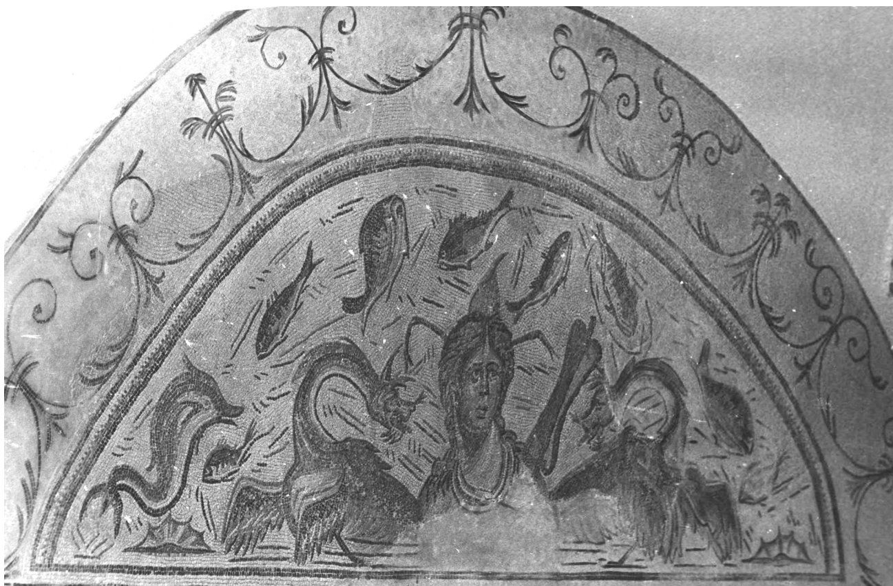
▲ FIGURA 1. Mosaico de Marroquíes Altos, Jaén capital.

Uno de los ejemplares hispanos en estudio fue hallado en 1959 en Jaén capital, en la zona de Marroquíes Altos. En el mismo lugar y a un nivel más inferior aparecieron otros pavimentos muy deteriorados con decoración geométrica, así como otros a unos 15 m que fueron destruidos 5 . El mosaico tiene forma semicircular, posiblemente pertenezca a una exedra de una habitación de prestigio, como el oecus, o a una fuente, y está fechado en la segunda mitad del siglo IV 6 . Se representa el busto de Tethys que lleva un ala o aleta en la parte posterior de la cabeza y patas de cangrejo a ambos lados de ésta; en el cuello, a modo de collar, se enrosca un pez serpentiforme. La figura está situada entre dos khetoí que la miran. A su izquierda figura un remo. Delfines, peces y una concha rodean a la diosa (fig. 1).