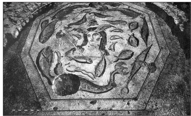
▲ FIGURA 4. Mosaico de las Termas F de Antioquía. Colección Dumbarton Oaks.

El atributo de las aletas a los dos lados de la cabeza es una constante en todos los ejemplares de Tethys, ya sea sola o con Océano, de cuerpo entero o en busto 19 , como el de Zeugma (fig. 5). Sin embargo en el ejemplar hispano de Marroquíes Altos solo lleva un ala o aleta detrás de la cabeza, mientras que las patas de cangrejo que porta los pa-