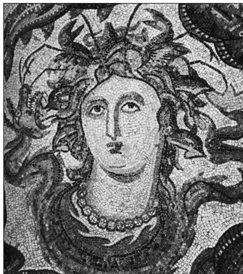
▲ FIGURA 8. Mosaico de la villa de la Gara de las Nereidas, Tagiura, Libia. Habitación 45.