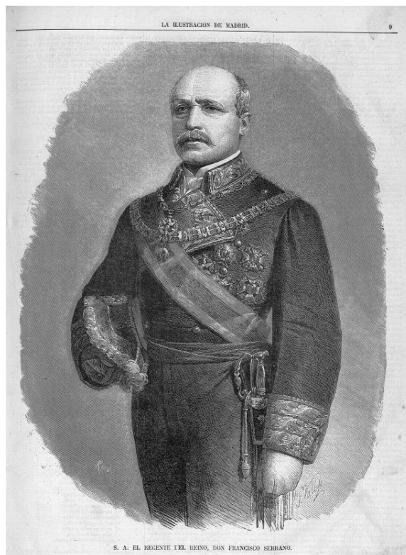
Figura 4. El Regente del Reino, D. Francisco Serrano. La Ilustración de Madrid.

de Cibeles dando esquina a la calle de Alcalá, en un coche tirado por dos caballos y pertenecientes al servicio particular del Duque de la Torre, su salida se acompaña por las correspondientes salvas de artillería. Se establece como recorrido el siguiente: calle de Alcalá, dirección Puerta del Sol y Carrera de San Jerónimo hasta el palacio de las Cortes, donde en sus alrededores destaca la instalación de tribunas, ocupadas por distintas autoridades y el Cuerpo Diplomático y una alta concurrencia en sus calles para asistir al acto. El general Serrano va en el coche sin acompañantes, abriendo la marcha “los nacionales de caballería” y un escuadrón de coraceros, a su derecha a caballo le acompaña el Capitán general de Madrid y a su izquierda el Teniente General Ramón Gómez Pulido, Director General de Caballería. Preceden al coche del regente seis ayudantes y dos piquetes de batidores de Caballería del Ejército y de Voluntarios, además de distintas autoridades militares y una escolta.