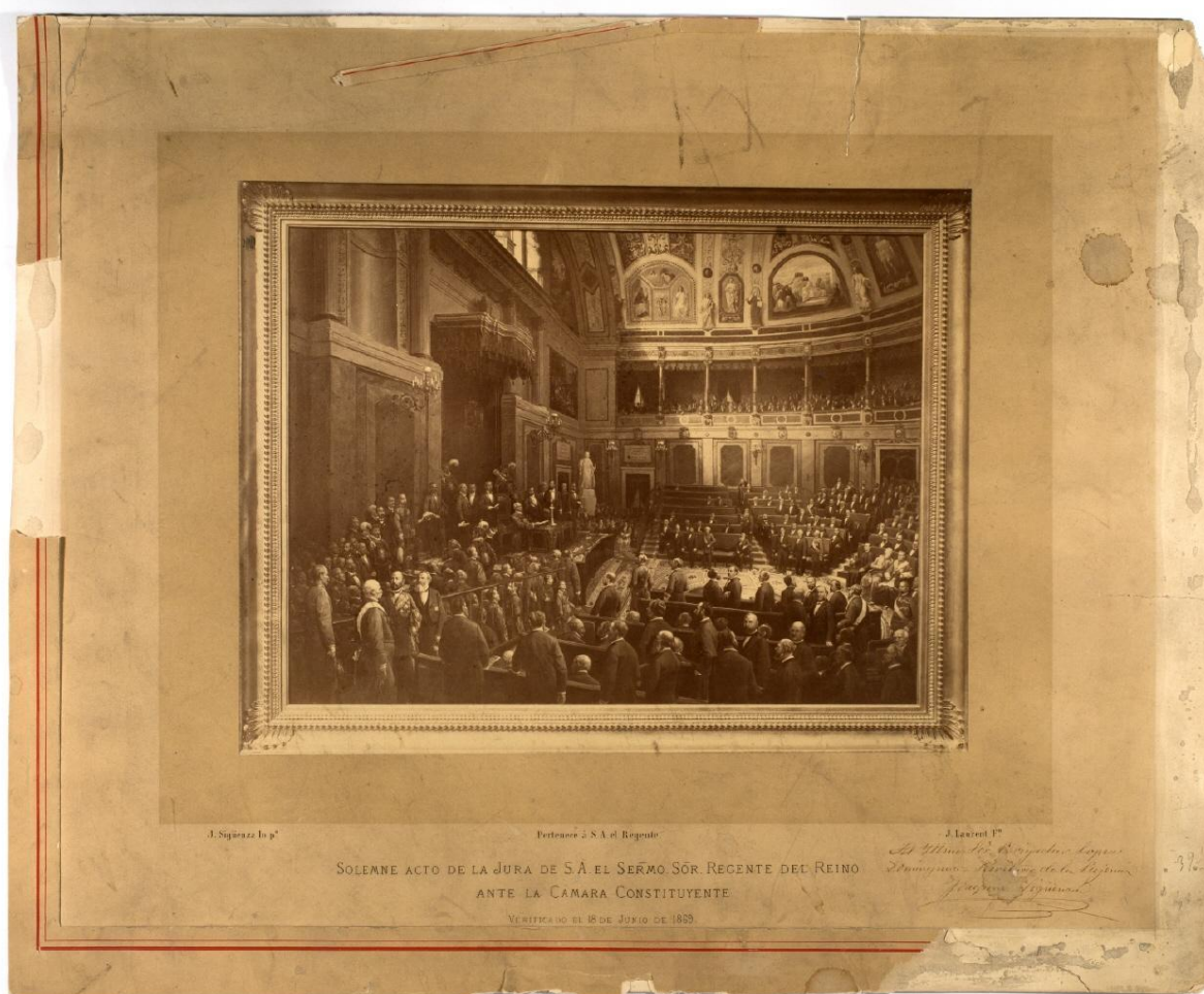
Figura 3. Solemne acto de la jura de S.A. El Sermo. Sor. Regente del Reino ante la Cámara Constituyente verificado el 18 de junio de 1869.