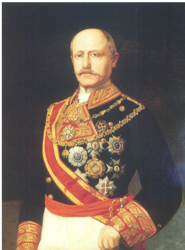
Figura 2. Francisco Serrano Domínguez. Duque de la Torre (Isla de León, Cádiz, 1810 - Madrid, 1885).

jurado, o parte de ello, lo contrario hiciere, no debo ser obedecido, antes aquello que contraviniera sea nulo y de ningún valor». Tal como refleja el Diario de Sesiones de la jornada el juramento lo realizará doblando la rodilla, contestando a su vez al juramento el Presidente de las Cortes Constituyentes, con la fórmula: «Si así lo hiciéreis Dios y la patria os lo premien, y si no os lo demanden» (Artículo 4).