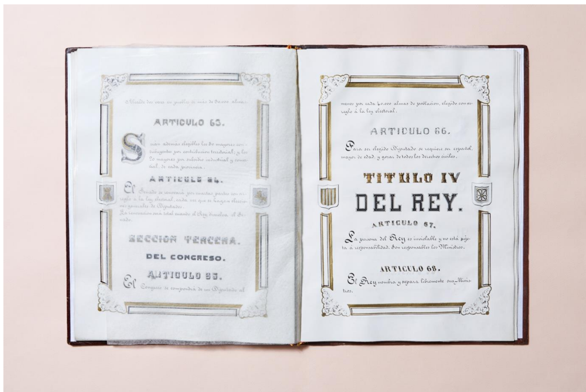
Figura 2. Edición original manuscrita de la Constitución de 1869.

cabo cambios en las instituciones y poniendo en valor a los ciudadanos y sus derechos 11 (MARTÍNEZ MARTÍNEZ, 2020; 18). Por Decreto de 5 de junio de 1869 12 , de Presidencia del Poder Ejecutivo, se fija el día para promulgar la Constitución. El Decreto, formado por tres artículos, establece que a promulgación de la Constitución se lleve a cabo en sesión extraordinaria (artículo 1) y que seguidamente los miembros del Poder Ejecutivo verifiquen el juramento ante el presidente de las Cortes. Por tanto, que el acto de promulgación y juramento se desarrolla en dos secuencias protocolarias distintas 13 (MESA GÖBEL, 2018; 18).