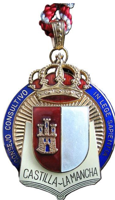
Ilustración 14 Medalla del Consejo Consultivo de Castilla-La Mancha.

del Consejo Consultivo tendrán el rango y consideración de Viceconsejeros del Gobierno de Castilla-La Mancha.