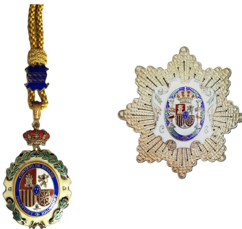
Ilustración 4 Medalla y placa de consejero del Consejo de Estado.