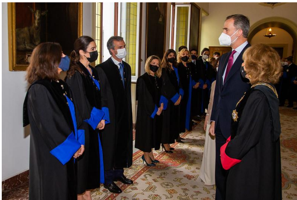
Ilustración 3 Visita de S.M. el Rey al Consejo de Estado, abril de 2021