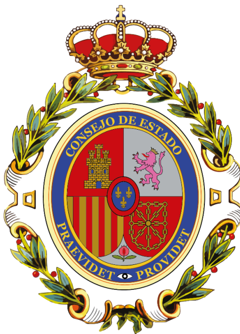
Ilustración 1 Emblema del Consejo de Estado.

Volviendo a sus antecedentes históricos, la función jurisdiccional del Consejo de Estado comenzó, sin embargo, a ser desvinculada en 1888, separación que se concretó en 1904, cuando se atribuyó la jurisdicción contencioso-administrativa al Tribunal Supremo, dejando al Consejo de Estado concentrado exclusivamente en su función consultiva. En este reinado de Alfonso XIII se volverá a recoger, en el Reglamento interno aprobado por Real Decreto de 10 de enero de 1906, el distintivo privativo del uniforme para los miembros del Consejo de Estado, recuperando el modelo aprobado en 1863 (Reglamento interno, 1906, Capítulo IX, artículos 70 a 73). No obstante, el Reglamento nada dispuso en relación con aquella toga y birrete, concedidos por Isabel II. En estos mismos términos de uso del uniforme privativo se pronunciarán los Reglamentos internos del Consejo de Estado, de 1924 y 1929.