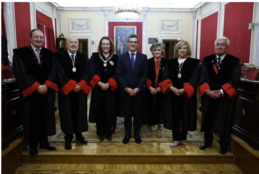
Ilustración 2 Foto de grupo con ocasión de la toma de posesión de cinco consejeras y consejeros del Consejo de Estado, marzo de 2023.