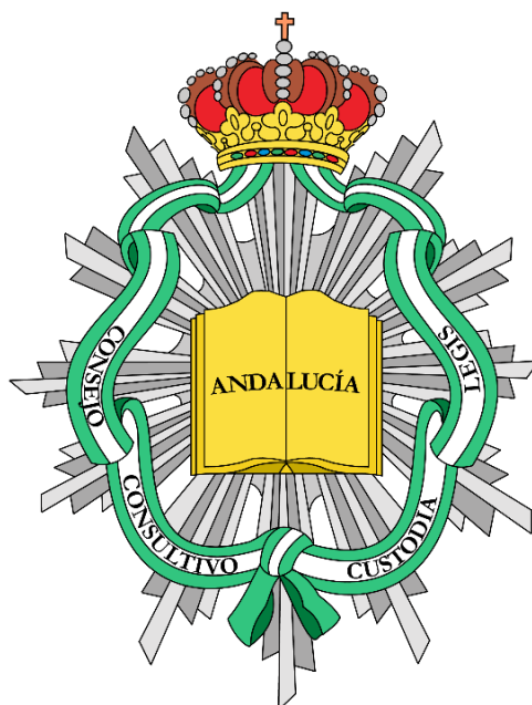
Ilustración 8 Emblema del Consejo Consultivo de Andalucía.