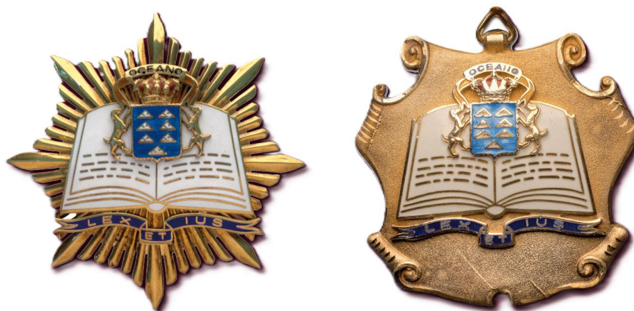
Ilustración 6 Placa y medalla del Consejo Consultivo de Canarias.

De acuerdo con este último instrumento normativo, “en los actos del Consejo Consultivo que el presidente considere de especial relevancia o solemnidad, los miembros del Consejo vestirán la toga tradicional con vuelillos y, además, llevarán placa y cordón con emblema del Consejo Consultivo, y el presidente el distintivo de su cargo” (Reglamento de Organización y Funcionamiento del Consejo Consultivo de Canarias, 2005, artículo 21, punto 2). Además, se establece que en los actos de etiqueta o de protocolo en los que no se utilice la toga, el presidente podrá usar, además de la placa y medalla, una banda de color rojo, con emblema del Consejo Consultivo en el lazo.