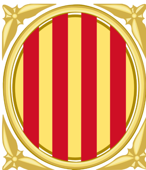
Ilustración 5 Emblema del Consell de Garanties Estatutàries de Catalunya.

vestirán toga en aquellos actos en los que la presidencia así lo indique por razones de relevancia o de solemnidad” (Reglamento interno del Consell Consultiu de la Generalitat de Catalunya, 2010, artículo 25). Asimismo, dispone que, en estos actos, los consejeros lucirán una placa con el emblema del Consejo y el presidente o presidenta, además, un distintivo de su condición. No obstante, el Reglamento no profundiza ni en la descripción del emblema, ni en el distintivo del presidente o presidenta. En cualquier caso, el emblema ha venido tradicionalmente a ser el propio de la Generalitat, esto es, un escudo de oro palado de gules.