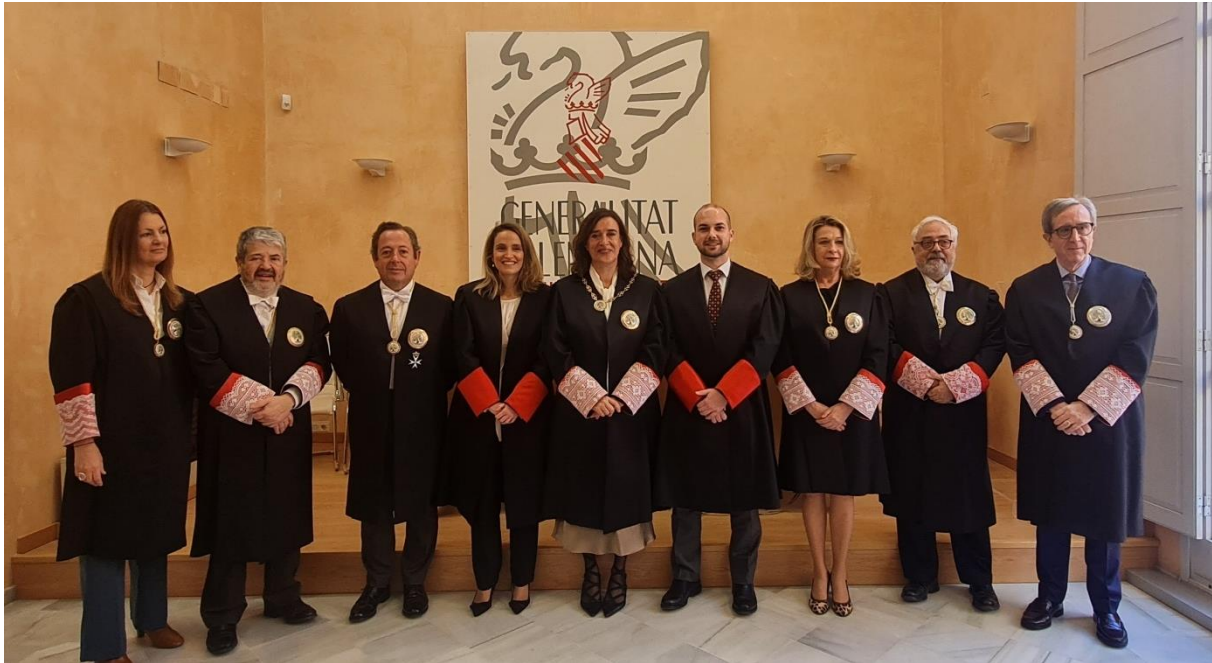
Ilustración 12 Toma de posesión de los nuevos miembros del Cuerpo de Letrados y Letradas, 2024, del Consejo Jurídico Consultivo de la Comunidad Valenciana.

cargo salvo que se la remueva por incumplimiento de su función, por incompatibilidad no aceptada, o por inhabilitación declarada por resolución judicial firme. La Secretaría General, las consejeras y los consejeros por elección tendrán el tratamiento de Ilustrísima o Ilustrísimo , con las mismas condiciones ya expresadas. Las consejeras y los consejeros natos tienen el tratamiento vitalicio de Molt Honorable Senyora o Molt Honorable Senyor .