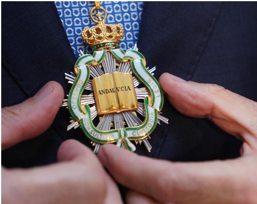
Ilustración 7 Medalla del Consejo Consultivo de Andalucía.

De acuerdo con la disposición sobre Honores y distinciones , se establece que “en los actos públicos y solemnes organizados por el Consejo en los que intervengan sus miembros usarán la toga y la medalla del mismo” (Reglamento Orgánico del Consejo Consultivo de Andalucía, 2005, artículo 6). Esta medalla ostentará en una de sus caras el escudo de Andalucía, y en la otra, el emblema. La medalla pende de un doble cordón, con colores blanco y verde trenzados, con hilo dorado y pasador del mismo color, con el escudo de Andalucía. El emblema está formado por el libro de la Ley, con la palabra ANDALUCÍA, la bandera de la Comunidad Autónoma y la leyenda CONSEJO CONSULTIVO CUSTODIA LEGIS. Sobre el tratamiento de los consejeros, el Reglamento establece que el mismo es impersonal.