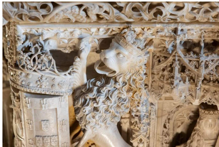
Ilustración 5 Detalle del sepulcro de Juan II y su esposa, Isabel de Portugal, en la Cartuja de Miraflores (Burgos).