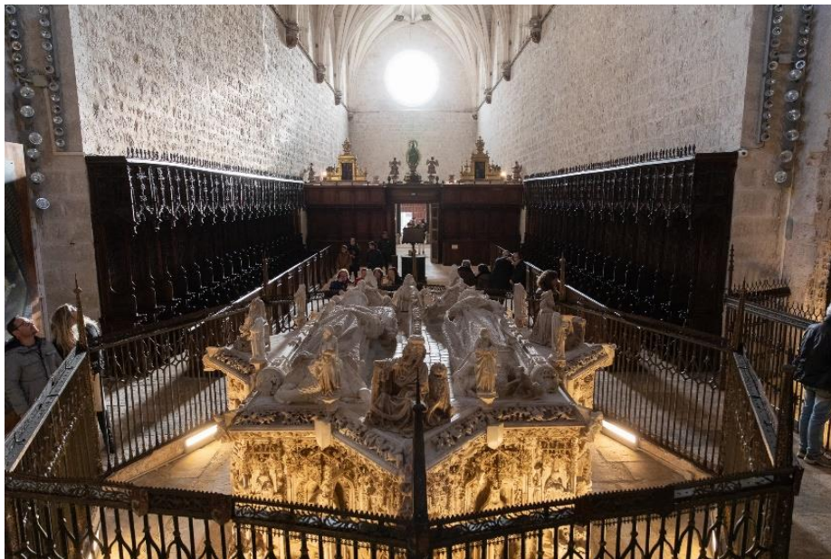
Ilustración 1 Sepulcro de Juan II de Castilla y su esposa, Isabel de Portugal. Cartuja de Miraflores (Burgos).