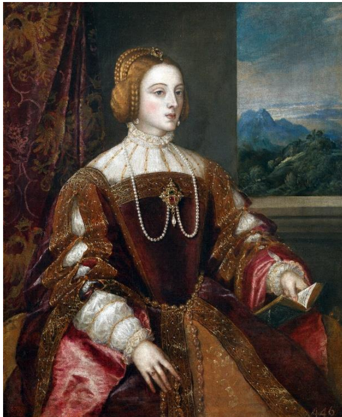
Ilustración 2 La emperatriz Isabel de Portugal, de Tiziano (1548). Fuente: museodelprado. Es

En cuanto a la ceremonia, las instituciones eclesiásticas de la ciudad celebraron sus oficios en diferentes capillas, por ejemplo, los franciscanos en la capilla del Rey Casto y los de San Vicente en la capilla de la Cámara Santa. También lo hicieron a lo largo de varios días, lo que supuso una diferencia con lo sucedido en otras partes de Castilla.