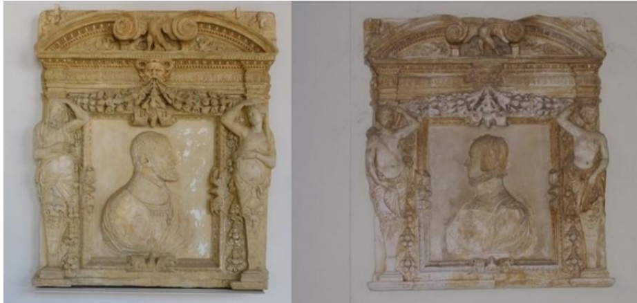
Figura 8. Retratos realizados en piedra, del emperador Carlos V y su esposa Isabel de Portugal, situados en el descanso de la escalera del patio. Palacio de Fuensalida de Toledo.

agua desde el río Tajo hasta la ciudad Imperial de Toledo. Todos ellos junto al Rey Carlos I dejaron un legado arquitectónico y estético de un calado sin igual que aún hoy sigue admirando a turistas y estudiosos de la cultura y el patrimonio.