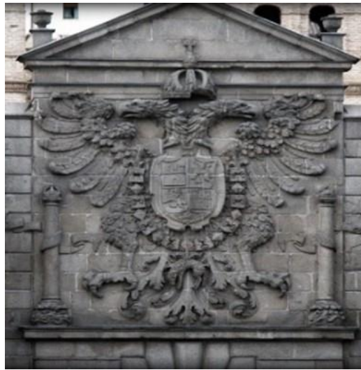
Figura 7. Puerta de Bisagra, fue totalmente reconstruida bajo los reinados de Carlos V y Felipe II, según las trazas de Alonso de Covarrubias. Está formada por dos cuerpos, entre los que se intercala una plaza de armas. El cuerpo interior es de arco de medio punto flanqueado por torreones cuadrados coronados por chapiteles de cerámica, en una de cuyas caras aparece el escudo imperial de Carlos V, y ajedrezado en otras.