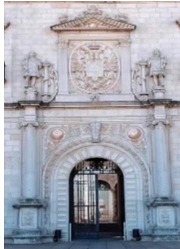
Figura 6. Portada plateresca, con destacado escudo imperial. El emperador Carlos I quiso construir un palacio-fortaleza. En su arquitectura intervinieron Alonso de Covarrubias, Luis de Vergara, Juan de Herrera y Francisco de Villalpando. Hoy se conoce como la puerta de Covarrubias.

La edificación, concebida por el arquitecto Alonso de Covarrubias, consta en su frontón principal con el escudo imperial tallado con todo detalle y protegido por el Toisón de Oro. Asimismo, el Palacio de Fuensalida, buen ejemplo de gótico mudéjar toledano de la primera mitad del siglo XV fue la residencia imperial cuando los emperadores se encontraban en su capital y en él falleció la emperatriz y Reina de España el 1 de mayo de 1539. El monarca encomendará a su hijo Felipe que presida y acompañe el cortejo fúnebre que partió desde el mismo palacio a la capilla Real de Granada. Otro de los ejemplos arquitectónicos de la época es el Hospital de Santa Cruz, hoy museo, que alberga algunas de las exposiciones más importantes del mundo como la del Greco, o la España de los Austrias y la Moda en el Siglo de Oro. Entre sus obras se puede encontrar un cuadro del pintor de la Corte, Juan de los Ángeles, que representa al Rey y el Papa Clemente VII entrando en Bolonia.