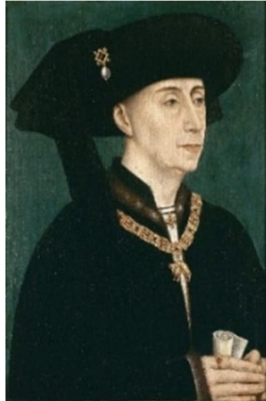
Ilustración 3. Retrato de Felipe III el Bueno, es un óleo sobre tabla. realizado por el taller del pintor Rogier Van der Weyden (1450).

aparece en el patrimonio que la historia nos ha legado como el símbolo visible de una dinastía creada en el siglo XV por el duque Felipe III de Borgoña.