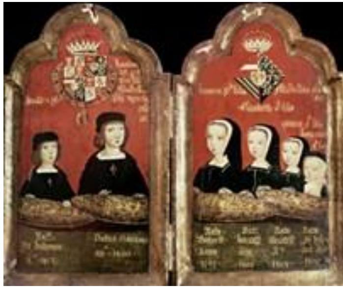
Ilustración 1. Díptico con los retratos de Felipe el Hermoso, Dña. Juana de Castilla y sus hijos en Toledo. Anónimo flamenco de comienzos del siglo XVI c. 1508.

Este legado que se puede observar paseando por la ciudad empedrada es fuente de investigación para una gran diversidad de disciplinas, cuestiones historiográficas e investigaciones propias que, según Moreno Nieto, ponen a dicha ciudad en el epicentro cultural del mundo como atracción del conocimiento, contribuyendo así al engrandecimiento de la capital castellanomanchega (1983:132). Este autor describe a la antigua Toletum , como “encrucijada inmortal de todas las culturas”, “imperial”, “cabeza de España” y crisol de herencias y culturas, de creencias religiosas y altas políticas, de amores y odios que han dejado huellas imborrables en la historia de España” (MORENO NIETO,1983: 194)