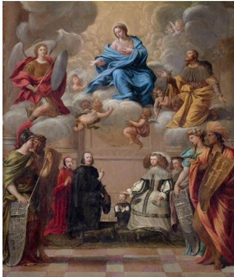
Ilustración 15. La obra muestra la Apoteosis de la Virgen María, madre de Jesucristo, y a sus pies aparecen el rey Felipe IV de España y Mariana de Austria junto al futuro Carlos II, rodeados por el cardenal Pascual de Aragón, una dama de la Reina y las cuatro partes del mundo. Óleo sobre cobre donde S.M. el Rey aparece con Toisón de Oro prendido al pecho. En la actualidad se encuentra situado en el camarín de la Virgen del Sagrario.

Fuente: Archivo Catedral Primada de Toledo