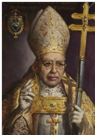
Ilustración 12 Retrato del cardenal y arzobispo de Toledo D. Pedro Segura Sáenz ubicado en la Sala Capitular de la Catedral Primada de Toledo. Con sus atributos de Cardenal y arzobispo mitrado, con cruz pectoral, anillo y Cruz Patriarcal también denominada cruz arzobispal. En su escudo de armas se puede apreciar el collar de la Orden del Toisón de Oro.

Al igual que pasará en los escudos del Emperador, el del Cardenal don Luis de Borbón y Farnesio, luce en la fachada del Palacio Arzobispal de Alcalá de Henares todos sus atributos heráldicos y premiales primando la voluntad regia sobre los Estatutos como lo demuestra el expediente de concesión de la Orden del Toisón de Oro al Cardenal Luis de Borbón y Vallabriga, arzobispo de Toledo (AHN, Estado 7682, Exp.36 y AHN Estado, 7670, Exp. 34).