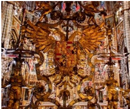
Ilustración 14. Imagen extraída del vídeo oficial de promoción del Concierto de la Novena Sinfonía de Beethoven que se realizó El 28 de marzo del año 2015 con motivo de los 200 años después de la publicación de la Segunda Parte de El Quijote en la Catedral de Toledo.