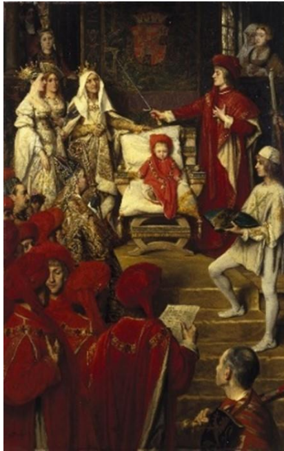
Ilustración 5: Philip I, the Handsome, Conferring the Order of the Golden Fleece on his Son Charles of Luxembourg, Albrecht De Vriendt 1880, Óleo sobre tabla, Museo Brooklyn.

Sus diferentes responsabilidades llevaron a Carlos V a convertir a la capital del imperio en un territorio esencial para la monarquía de los Austrias. Tal y como se detalla en los archivos de la ciudad, el monarca llegó a residir en ella al menos en quince ocasiones. Esta Villa ha sido siempre exponente de grandeza regia desde los visigodos y el Emperador la dotará de un mayor esplendor dirigiendo desde allí su imperio, lo que conllevó trasladar a la ciudad la Corte, así como todos los servicios del Reino, guardia personal, etc. Seguirá vinculado a la ciudad hasta la muerte de la Emperatriz Isabel de Portugal su esposa. Tras su deceso, el Emperador decidió retirarse durante un tiempo al monasterio toledano de los monjes Jerónimos de Santa María la Sisle y después nunca más volvería a la ciudad imperial.