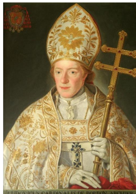
Ilustración 11. Retrato del cardenal y arzobispo de Toledo D. Luis Antonio Alfonso de Borbón y Farnesio XIII conde de Chinchón ubicado en la Sala Capitular de la Catedral Primada de Toledo. Con sus atributos cardenalicios color escarlata, hábito coral y prendidas del pecho las condecoraciones de la Orden del Espíritu Santo (Francia) La Orden de San Jenaro (Reino de Nápoles) y la Orden del Toisón de Oro (Reino de España).