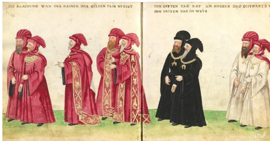
Ilustración 2. Vestimenta Caballeros del Toisón de Oro. Fuente: Manuscrito S. XVI Códice de Trajes, Biblioteca Nacional de España. Fundación Carlos de Amberes, Madrid, 2012 p. 192 -197.

El 30 de noviembre de 1431, día de San Andrés, se celebra en Lille el primer Capítulo General de la nueva Orden, durante el cual ejerció como canciller el obispo de Nevers, Jean Germain. Años más tarde, el papa Eugenio IV dará legitimidad a su creación mediante la firma de una bula por la que se aprobaban sus reglamentos y estatutos. En ellos aparecían cuatro dignidades: canciller, tesorero, rey de armas y secretario. Al frente de todas ellas se situará el máximo responsable de la Orden, el Duque de Borgoña.