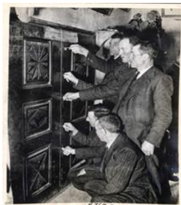
Fotografía 7. Armario de seis llaves. Ilustración del libro Casa de la Vall, De Casa Pairal a Seu del Consell General