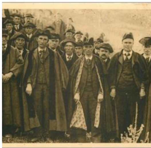
Ilustración 1 Consellers Generals .

Las primeras normas escritas aparecen en el siglo XVIII en el Manual Digest , que describía las obligaciones dels Consellers Generals de guardar cortesía y urbanidad tanto en su modo de estar como en la manera de hablar. Actualmente, esta cortesía también queda recogida en el Reglamento del Consell General en vigor del año 1993 12 .