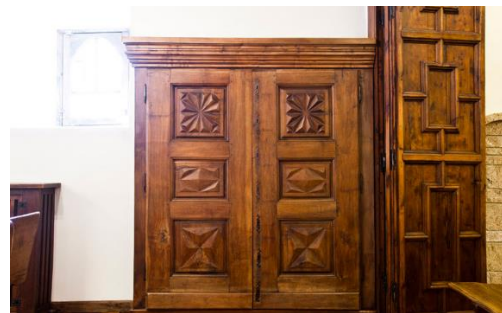
Fotografía 8. El armario con las siete llaves al crearse la parroquia de Escaldes-Engordany. Ilustración del libro Casa de la Vall, De Casa Pairal a Seu del Consell General