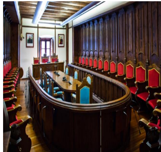
Fotografía 6. Sala del Consell tras la Constitución de 1993. Mesa central para el poder ejecutivo.