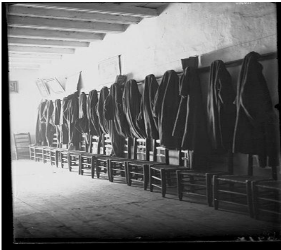
Fotografía 5. Sala del Consell antes de 1993.