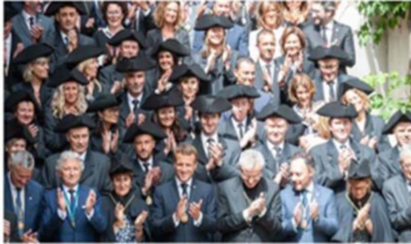
Fotografía 16. Símbolos tradicionales y modernos en la visita oficial de SE el Copríncipe francés en el año 2019.