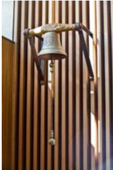
Ilustración 2 La campana de Canillo Fuente: Ilustración del libro Casa de la Vall, De Casa Pairal a Seu del Consell General

edad de la parroquia de Canillo. De aquí la expresión que se utiliza y conocida por todos “a campana tocada” 13 .