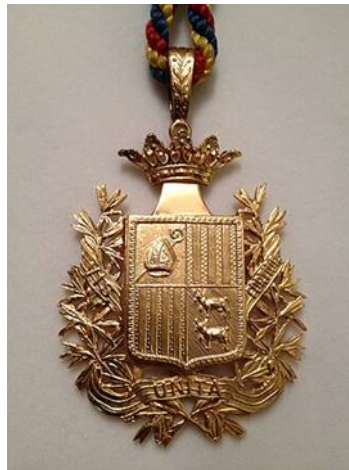
Fotografía 13. Medallas de autoridad.

Las medallas de autoridad fueron modificadas en el año 1995. Son reproducidas por el Consell General .