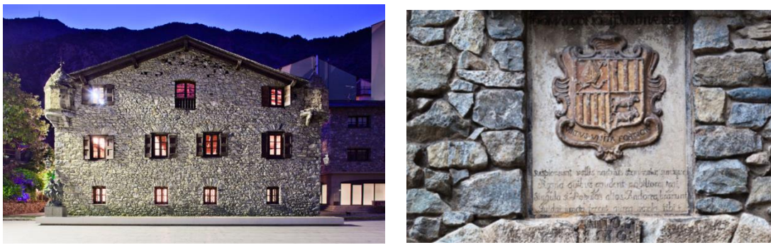
Ilustración 3. La Casa de la Vall y el escudo de Andorra que oficializa la sede.

En la Baja Edad Media y según testimonios de viajeros “No existía una sede. Se reunían en los pórticos de la iglesia o en la plaza del pueblo con sus hábitos para realizar las reuniones...”. Con la adquisición de la Casa de la Vall en el año 1702, el Parlamento andorrano se asienta en una sede fija, lo cual implica también un asentamiento de la institución como tal y de las estructuras representativas del país. La Casa de la Vall enmarcada en la puerta de entrada con el escudo de Andorra se convertiría desde entonces en el lugar emblemático, oficial y solemne de la institución más originaria de Andorra.