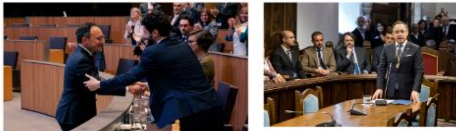
Fotografía 15. Toma de posesión del Cap de Govern .