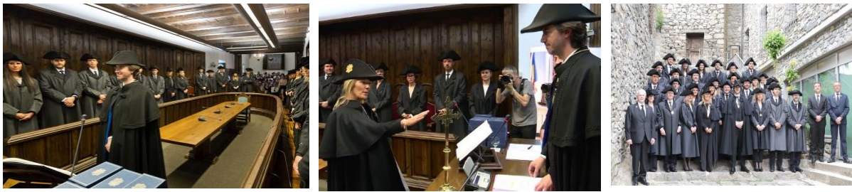
Fotografía 10. Juramento de Síndic general , Subsíndic general y fotografía oficial del Consell General recién constituido.

Uno a uno, los Consellers Generals 16 electos se levantarán, tras colocar su voto dentro de la urna, volverán a su sitio. Tras el recuento de votos, los Consellers Generals abandonan la sala y tras una pausa vuelven ya ataviados con la vestimenta tradicional: el Síndic y Subsíndic electos con la capa y el bicornio y los Consellers Generals con capa y tricornio. Seguidamente, se inicia la ceremonia de juramento o promesa de todos ellos, delante de los signos tradicionales, el crucifijo y la Constitución del Principado de Andorra. Comenzará el Síndic General electo, quien jurará o prometerá su cargo ante el presidente de la mesa (provisional). Tras pronunciar la fórmula del juramento o promesa, se le impone la medalla institucional correspondiente. El procedimiento se repite para el Subsíndic General y el resto de Consellers Generals , pero ya estos lo hacen ante el Síndic General , que acaba de jurar o prometer su cargo. La sesión termina con la fotografía oficial en las escaleras de la Casa de la Vall.