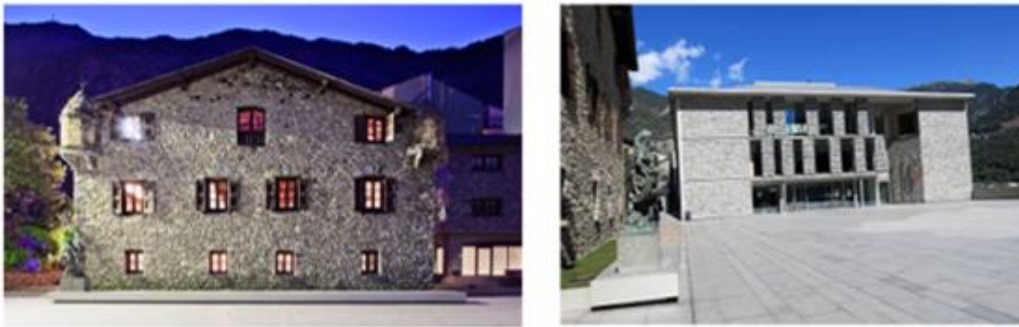
Fotografía 11. Sede tradicional y nueva sede para sesiones ordinarias. Fuente: Ilustración del libro Casa de la Vall, De Casa Pairal a Seu del Consell General

La continuidad con el pasado se pone de manifiesto en las sesiones tradicionales, en las cuales se sigue utilizando la capa y el bicornio, al Síndic y Subsíndic Generals y la capa y el tricornio a los Consellers Generals . Se continúan celebrando en la Casa de la Vall, sin embargo, la modernidad requirió la construcción de un nuevo edificio, con un hemiciclo más moderno, adaptado a las nuevas tecnologías para las sesiones ordinarias del Consell General.