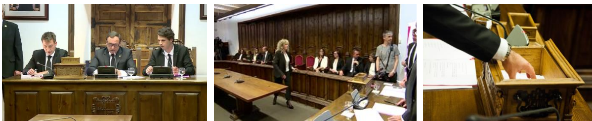
Fotografía 9. Inicio de la sesión, votación y urna.

Como es tradicional, el inicio de la sesión se lleva a cabo a campana tocada. La mesa del inicio de sesión está compuesta por el Conseller general de mayor edad de Canillo y el de menor edad, y el secretario del Consell General. La urna donde se recogerán los votos está expuesta sobre la mesa, abierta. El nuncio de Consell General procederá a mostrarla a todos los Consellers Generals con el fin de enseñar que está vacía.