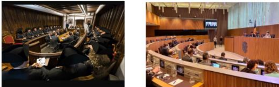
Fotografía 12. Dos sedes. Una misma institución.