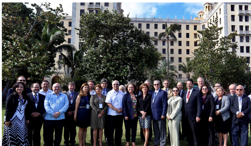
Imagen 1: foto oficial de la reunión de Ministras y Ministros y Altas Autoridades de Educación Superior en La Habana (Cuba)