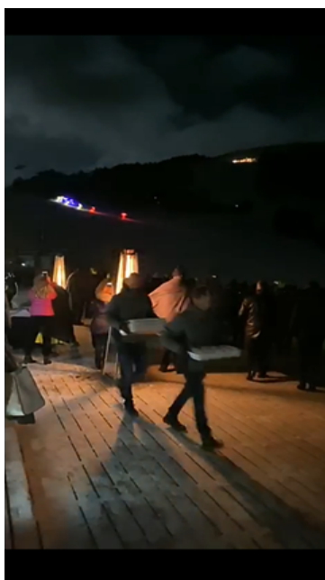
Imagen 7: espectáculo descenso de antorchas, Estación de Esquí Grandvalira, El Tarter

El equipo de protocolo junto con la ministra organizó un evento cultural atractivo y representativo de Andorra, en la nieve, en la estación de esquí de Granvalira, en el que se pretendió cautivar a nuestros visitantes con un espectáculo nocturno de descenso de antorchas seguido de una cena oficial con producto local: