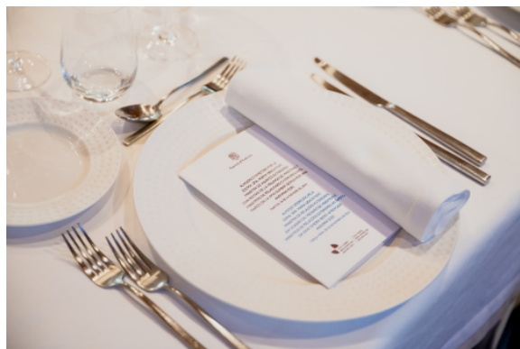
Imagen 5: foto de mesa del almuerzo oficial