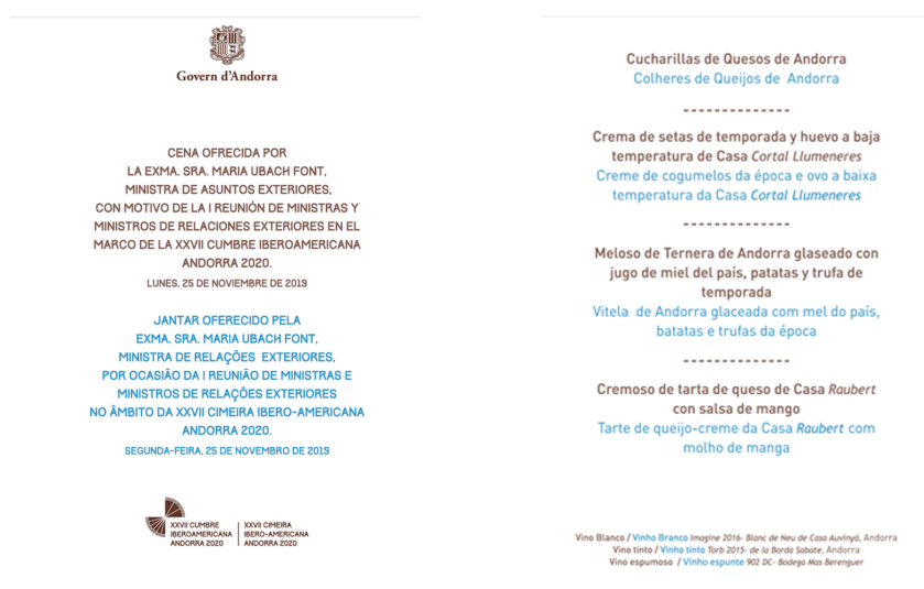
Imagen 4: minuta de la cena oficial ofrecida por la Ministra de Asuntos Exteriores de Andorra durante la Reunión de Ministras, Ministros de Asuntos Exteriores en Soldeu (Andorra) el 25 de noviembre de 2019.

Otro de los elementos que juegan un papel invisible especial son los menús que se ofrecen durante las reuniones, ya que permiten mostrar la cultura gastronómica. Se trata de una vía más para estrechar lazos culturales. El equipo de protocolo se encargó también de consensuar los menús oficiales con la Ministra de Asuntos Exteriores. En ellos el producto local tuvo un papel destacado, como así se puede ver en un ejemplo de minuta (más abajo) donde se indica el origen local del producto a degustar. Se trata de una forma más de llegar al invitado a través de la gastronomía del país. Los lugares escogidos para celebrar las cenas de bienvenida, cócteles o almuerzos también son escogidos con la finalidad de mostrar la historia y costumbres del país.