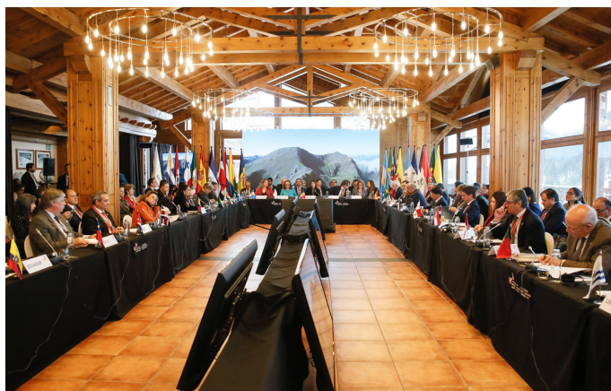
Imagen 2: sala de la I Reunión de Ministras y Ministros de Asuntos Exteriores , 26 de noviembre de 2019, Soldeu, (Andorra)

Procedemos a analizar los principales elementos protocolarios que caracterizan la organización de una reunión ministerial en el marco de las Cumbre iberoamericanas. En este caso, la reunión se organizaba en Andorra por ser el anfitrión del calendario en curso 2019-2020. La sala de la reunión fue distribuida en forma de U invertida y los delegados se colocaron en orden protocolario establecido por SEGIB, que es el orden alfabético en castellano. La mesa presidencial fue presidida por Andorra, SEGIB, República Dominicana y Guatemala (países que forman la troika). Las banderas también se colocaron siguiendo el orden protocolario, que es el orden alfabético en castellano en alternancia comenzando con la bandera del país anfitrión. Todos estos elementos protocolarios dieron forma a la reunión.