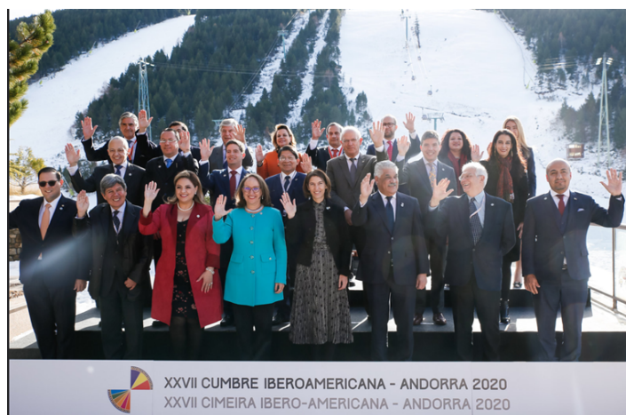
Imagen 3: fotografía oficial en orden protocolario por país y rango de la I Reunión de Ministras y Ministros de Asuntos Exteriores, 26 de noviembre de 2019, Soldeu (Principado de Andorra)

Un elemento más, como ya hemos visto en las anteriores reuniones, colaboró en estrechamiento de relaciones e intercambios entre los participantes: los obsequios entregados a modo recuerdo y cuya elección busca dar a conocer la riqueza cultural local y recordar la visita oficial al país con motivo de la reunión. Por este motivo, todos los obsequios entregados llevaban el nombre de la reunión, la fecha, el lugar y la tarjeta de visita firmada de la ministra o ministro que acoge, en este caso, la ministra de Asuntos Exteriores de Andorra. El mismo procedimiento se siguió con la reunión que tuvo lugar el día previo con los Responsables de Cooperación y Coordinadores Nacionales: