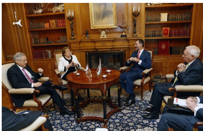
Ilustración 5. Reunión bilateral realizada en el Palacio de la Zarzuela.

La Presidenta de Chile es recibida a pie de coche por los Reyes que se sitúan todos juntos ante los medios de comunicación acreditados dejando que la invitada ocupe la posición frontal y a los lados los anfitriones, situándose el Rey a su derecha y la reina a la izquierda. A continuación acceden al interior en donde se desarrolla una reunión bilateral de ambos jefes de Estados acompañados por sus ministros de Asuntos Exteriores, en el primer momento se permite el acceso de la prensa para la realización de fotografías y video y a continuación ya a puerta cerrada se desarrolla la reunión. Por cortesía hacia la invitada se deja que la Presidenta y su delegación ocupen la posición preferente de la derecha. Una vez acabada la reunión se sirve un almuerzo