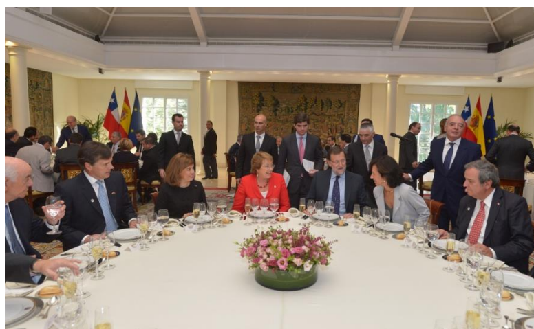
Ilustración 16. Mesa presidencial del almuerzo en Moncloa.

El montaje se hizo con mesas redondas y al inicio de la misma hay dos pequeños discursos-brindis al inicio del almuerzo.