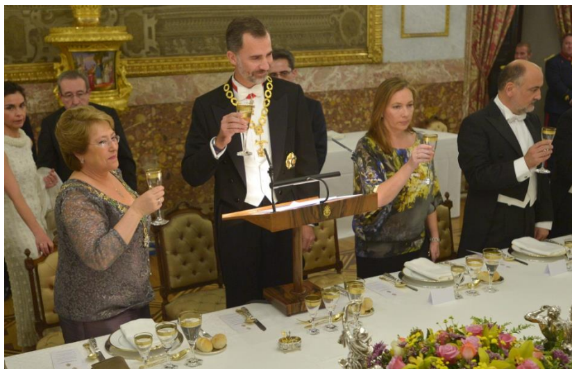
Ilustración 9. Brindis ofrecido por S.M. el Rey a la Presidenta Bachelet.

En este caso, como el jefe de Estado visitante era una mujer, no se colocó frente al Rey como corresponde a una mesa imperial con presidencia francesa, que es la que se utiliza en estas cenas en España, sino que se colocó a la derecha del Rey, situándose en esa segunda presidencia la Reina y de esta manera mantener la alternancia entre hombre y mujer preceptiva.