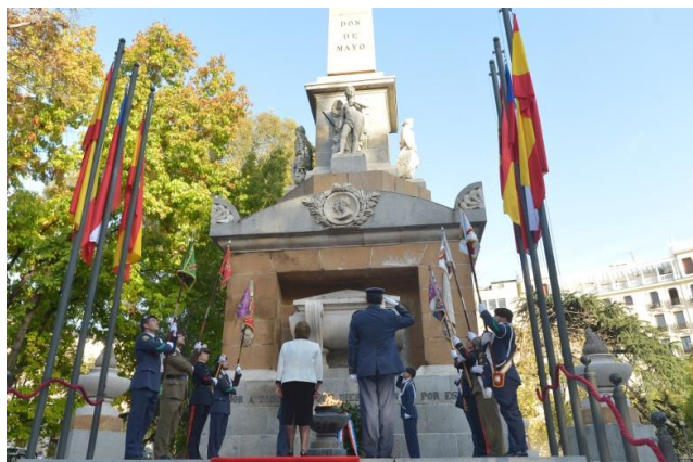
Ilustración 6. La Presidenta durante la interpretación del toque de oración flanqueada por los guiones.

Recepción Ayto. Madrid (Ayuntamiento de Madrid, Salón de plenos. 29/10/2015. 17.05 h.)