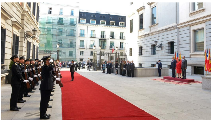
Ilustración 10. Momento de la interpretación de los himnos al recibir a la Presidenta de Chile.

En la visita al Congreso de los Diputados es recibida por el presidente el Congreso y del Senado a pie de coche. El capitán de la compañía de la Policía Nacional que está formada le saluda a la entrada del recinto y se dirigen hacia la tribuna en donde se escucharán los himnos de ambos países. En la tribuna se sitúa la Presidenta en la posición central quedando a su derecha el Presidente del Congreso de los Diputados que ejerce como anfitrión y a la izquierda el Presidente del Senado, a un lado y fuera de la tribuna observamos al Ayudante de Campo de la Presidenta que siempre le acompaña. Tras la interpretación de los himnos hacen un breve posado para la prensa acreditada. A continuación acceden al interior del Congreso de los Diputados.