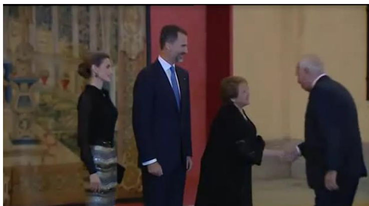
Ilustración 17. Saludo a los invitados a la recepción ofrecida por la presidenta de Chile.

La llegada de los invitados se hace por orden siendo los últimos en llegar el presidente del Gobierno y su esposa que son recibidos por miembros de su séquito y por último SS.MM. los Reyes que son recibidos personalmente por la presidenta de Chile. Tras una breve conversación en una sala privada en la que participan ambos jefes de Estado y el presidente del Gobierno español acceden al Patio de los Borbones en donde tiene lugar el saludo a todos los invitados a la recepción, similar al que se hizo el día anterior en el Palacio Real de Madrid en la cena de gala, solo que en este caso cambia la disposición de los jefes de Estado, en primer lugar se sitúa la presidenta de Chile como anfitriona y a su derecha y por este orden, el Rey y la Reina.