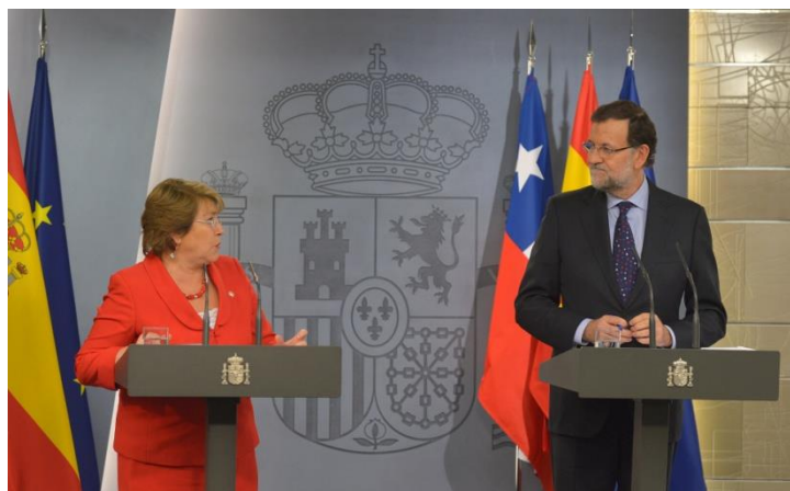
Ilustración 15. Rueda de prensa posterior a la reunión y firma de acuerdos.

A continuación se desarrolla un almuerzo en honor de la presidenta de Chile al que acuden además de miembros el Gobierno empresarios con intereses económicos en Chile y en el que también están presentes los miembros del séquito y los empresarios que acompañan a la presidenta de Chile. Se realiza en el Salón de Tapices del Palacio de la Moncloa.