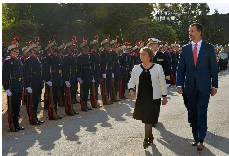
Ilustración 2. La Presidenta de Chile pasando revista a la compañía de honores de la Guardia Real, acompañada por S.M. el Rey.

A continuación se invita a la Presidenta a que pase revista a la compañía de la Guardia Real que está formada. Ella es la que va más cerca de la compañía formada para visualizar que es ella la que pasa la revista aunque va acompañada por S.M. el Rey y por el Ayudante de Campo de la Presidente y el Jefe de Cuarto Militar de la Casa de S.M. el Rey para a continuación presenciar el desfile que realiza la compañía formada. En el momento que se pasa por delante de la bandera de la compañía se hace el saludo correspondiente con una leve inclinación de cabeza, saludo que la bandera devuelve al Rey inclinando la bandera. Si fuese la Presidenta de Chile sola la que pasase revista, la bandera de España no se inclinaría en devaluación del saludo.