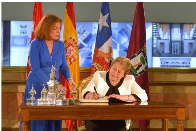
Ilustración 7. Firma en el Libro de Honor del Ayuntamiento de Madrid.

La alcaldesa ocupa el lugar de la presidencia en la tribuna del pleno situando a la Presidenta a su derecha. La alcaldesa pronuncia un discurso de bienvenida dirigido a Bachelet, que responde con otro de agradecimiento. Termina el acto haciéndole la entrega simbólica de las llaves de la ciudad.