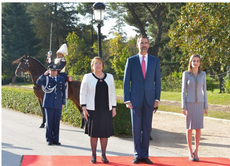
Ilustración 1. Disposición de la Tribuna para la interpretación de los himnos nacionales.

A continuación se invita a la Presidenta a que pase revista a la compañía de la Guardia Real que está formada. Ella es la que va más cerca de la compañía formada para visualizar que es ella la que pasa la revista aunque va acompañada por S.M. el Rey y por el Ayudante de Campo de la Presidente y el Jefe de Cuarto Militar de la Casa de S.M. el Rey para a continuación presenciar el desfile que realiza la compañía formada. En el momento que se pasa por delante de la bandera de la compañía se hace el saludo correspondiente con una leve inclinación de cabeza, saludo que la bandera devuelve al Rey inclinando la bandera. Si fuese la Presidenta de Chile sola la que pasase revista, la bandera de España no se inclinaría en devaluación del saludo.