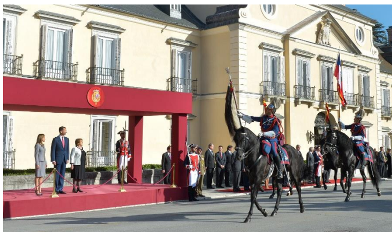
Ilustración 3. Disposición de la tribuna durante el desfile militar.

Una vez hechos los honores militares se dirigen a la tribuna para presenciar el desfile de la compañía de la Guardia Real que está formada. En un primer momento se dejó que la presidenta de Chile ocupara el centro de la tribuna situándose el Rey a su derecha y la Reina a su izquierda, pero al llegar el momento de iniciarse el desfile, lo que hicieron cambiaron el orden y dejaron fuera la Presidenta de Chile la que recibía en primer lugar las tropas en el orden en el que llegaban situándose el Rey y la Reina a su derecha. En el momento inicial teníamos una presidencia frontal alterna y pasaron a una presidencia lineal.