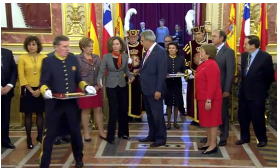
Ilustración 11. Momento del acceso de los ujieres con las medallas para condecorar a la Presidenta de Chile.

Se colocan ahora la jefa de Estado y los dos presidentes de las cámaras frente a la puerta y desde esa puerta se incorporan dos ujieres con dos bandejas portando ambas medallas. ES una puesta en escena que sería conveniente depurar por que el acceso por la puerta en la que están los presidentes situados hace que se tengan que retirar para dejar paso y que el personal de protocolo de la cámara tome más protagonismo del que le corresponde para organizar el desarrollo del acto. Tal vez la entrada de los ujieres frontalmente a la situación de la visitante y los anfitriones daría un mejor resultado visualmente a la puesta en escena de la ceremonia.