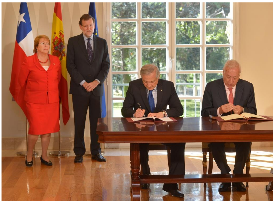
Ilustración 14. Firma de acuerdos bilaterales por los ministros de Asuntos Exteriores de Chile y España.

Es de observar el exceso de protagonismo que toman los técnicos de protocolo que participan en esta ceremonia puesto que tienen que hacer los intercambios de las carpetas por detrás de los firmantes cuando ellos mismos se podrían intercambiar las carpetas que están situadas sobre la mesa y la puesta en escena gana en protagonismo con los firmantes y no por el personal de soporte. El profesional del protocolo debería de desaparecer en las imágenes del acto, estar presente pero no visible.