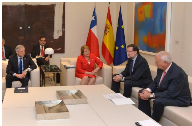
Ilustración 13. Disposición de las delegaciones en la reunión bilateral en el Palacio de la Moncloa.

Firma de acuerdos bilaterales (Salón Mompou, Palacio de la Moncloa. 30/10/2014. 13.00 h)