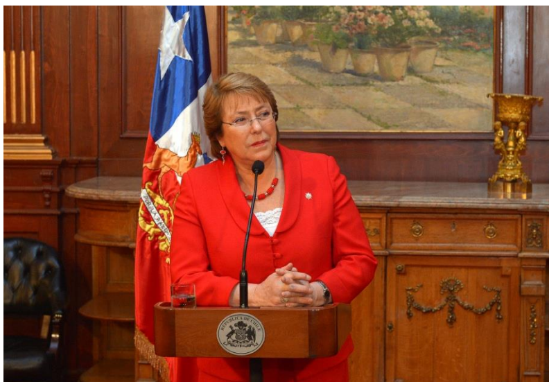
Ilustración 12. Rueda de prensa ofrecida por la Presidenta tras su intervención en el Foro empresarial "Invertir en Chile"

Reunión con el Presidente del Gobierno (Salón Tapies, Palacio de la Moncloa. 30/10/2014. 10.05 h.)