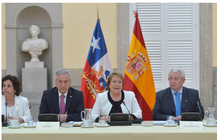
Ilustración 4. Colocación de las banderas en la reunión con empresarios realizada en el Palacio del Pardo.

A continuación tiene lugar en el mismo Palacio una reunión con los principales empresarios de la CEOE y un grupo de empresarios chilenos que acompañaban a la Presidenta. Una vez que ha saludado a todos los empresarios que están presentes en la reunión la presidenta ocupa su puesto presidiendo la misma. Es importante observar que detrás del lugar ocupado por la Presidenta hay dos banderas, la de Chile colocada a la derecha de la presidencia y la bandera de España a la izquierda. El motivo de esta colocación es que en ese momento ese Palacio es la residencia oficial de la presidenta de Chile, con lo cual la bandera de Chile tiene precedencia respecto a la española, aunque estemos en España. Eso mismo ocurre en el exterior en el que en el balcón de la puerta principal solamente ondea la bandera chilena.