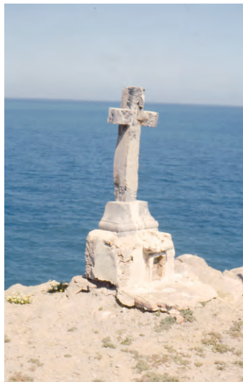
En otros lugares de las islas se levantaron recuerdos a militares fallecidos, como esta cruz que estaba junto a los acantilados al norte de Isabel II.