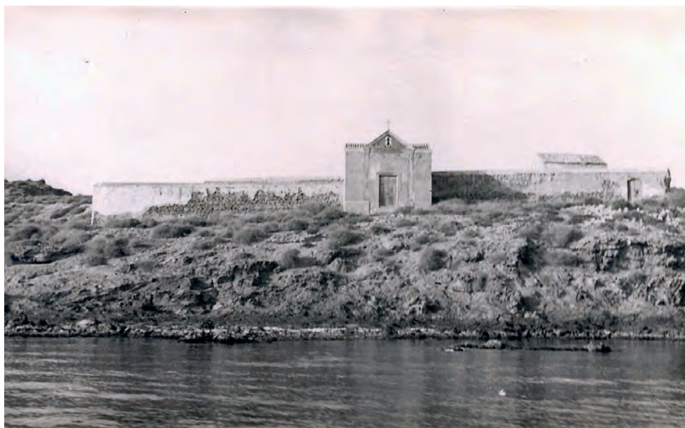
Vista del cementerio desde el mar.