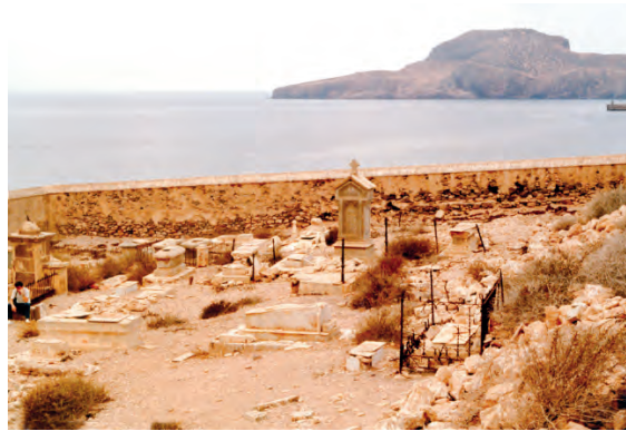
Imágenes del interior del cementerio en 1986.