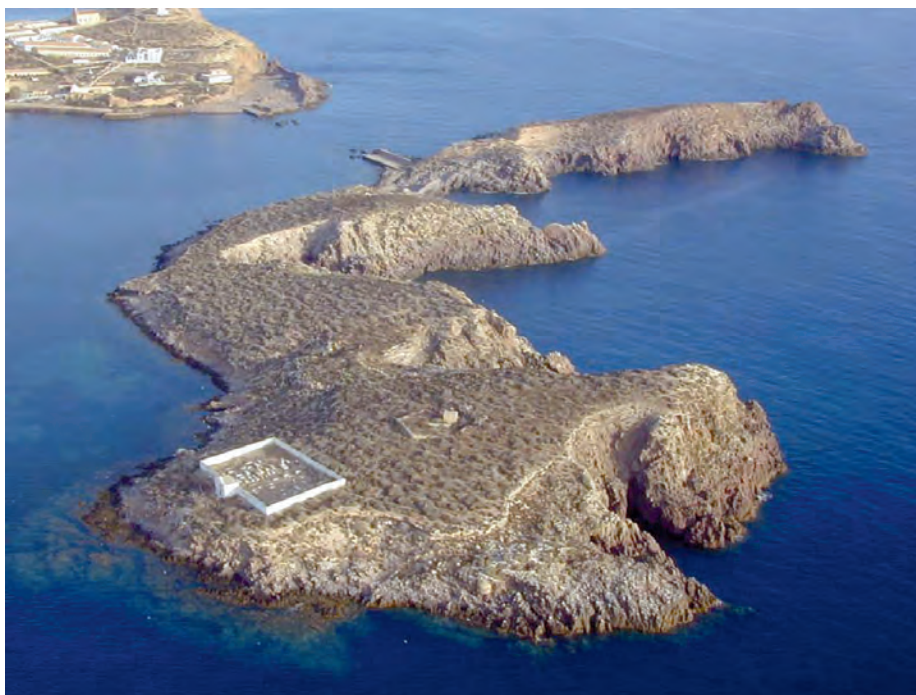
Vista de la isla del Rey con su cementerio en primer plano.

El primer enterramiento del que hay constancia en las lápidas se realizó en 1886 y el último en 1926.