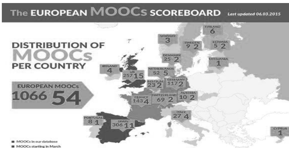
Figura 2. Infografía de los MOOC europeos