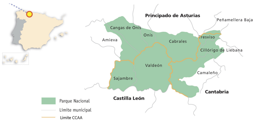
Ilustración 1. Localización Geográfica del PNPE